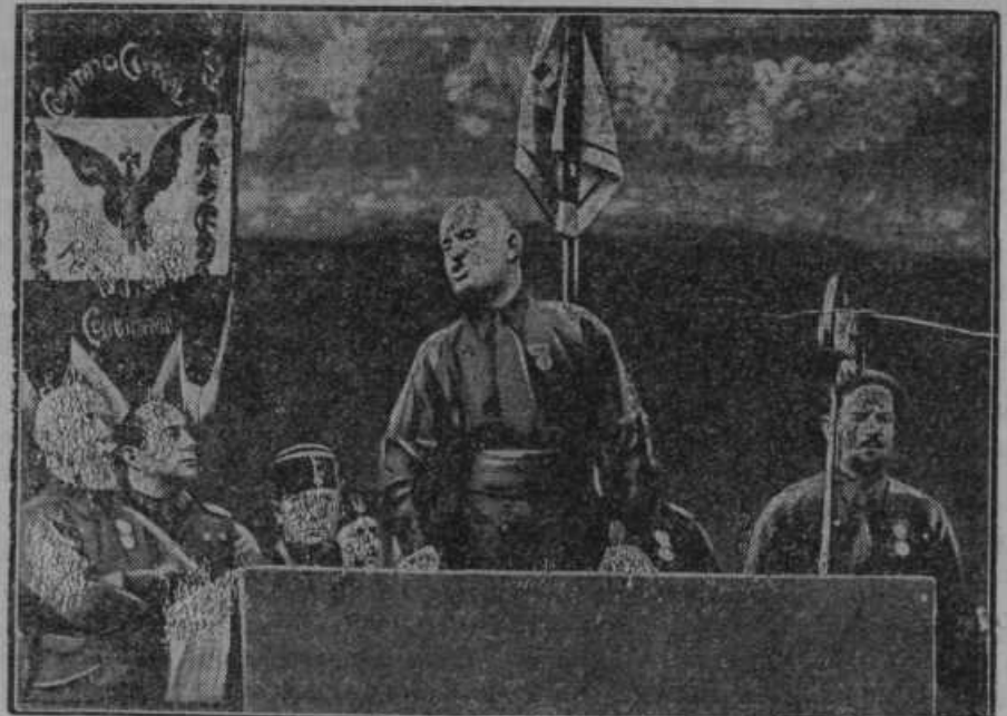
linijev slavnostni govor, v katerem se je spominjal diktator Italije desetletnice pohoda fašistov v Rim in prevzema državne oblasti.