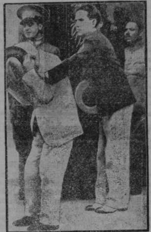
Ameriškega kralja elektrike Samuela Insulla so aretirali te dni na zahtevo Združenih držav na Grškem v Atenah. Aretirani zakriva s klobukom obraz pred fotografi.