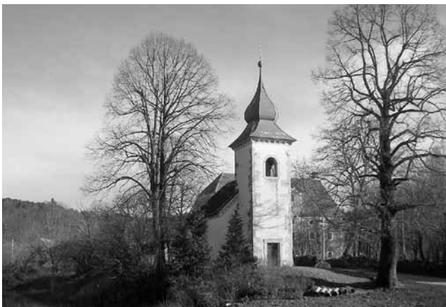
Rakiška cerkev, v ozadju pa Andrejaceva »ta večja hiša«, kjer so pripravili ribanje repe.