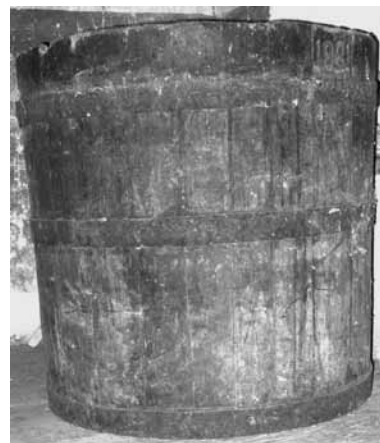
Odslužen čeber za kisavo (desno zgoraj ima letnico 1931).