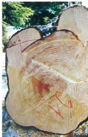
Slika 3: Ocenjevanje velikosti rane pri ogledu stoječega drevesa je lahko zelo nezanesljivo

Popis 2000 zajema 20.025 zapisov o drevesih na 709 traktih. 10.315 zapisov se nanaša na drevesa na KPP, 9.710 zapisov pa na drevesa na