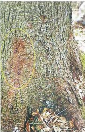
Slika 2: Vidnost mehanskih poškodb drevja je odvisna od mesta rane in pozornosti popisovalca

Figure 2: Visibility of mechanical tree injuries depends on a wound location and surveyor's attention