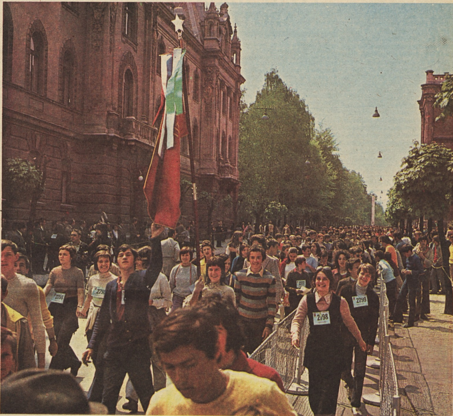
Tisoči po poteh partizanske Ljubljane