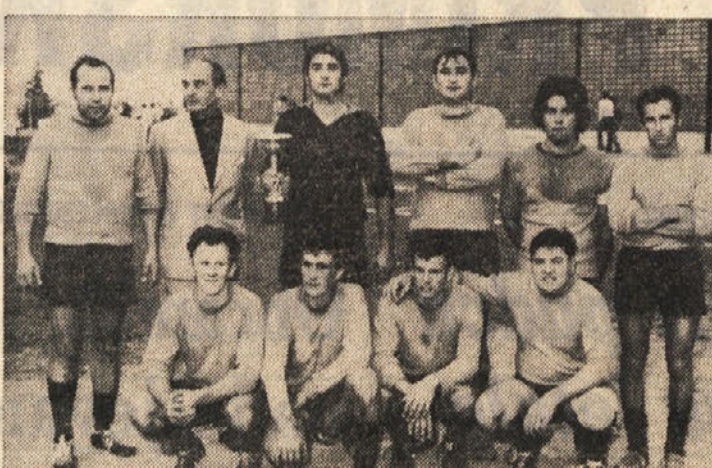
Delavci in uslužbeni štirih gorjskih tovarov so odigrali medsebojni turnir v nogometu. Na turnirju so sodelovale ekipe tovarov LACEGO iz Sovodnja, Vouk, Brunschweller in La Giulia iz Gorice. Zmagala je ekipa tovarne Vouk. Na naši sliki je ekipa, ki zastopa tovarno LACEGO v Sovodnjah. Ta je zasedla drugo mesto, v njej pa je tudi precej slovenskih nogometašev, katere vidimo na sliki