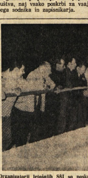
Organizatorji letošnjih SŠI so poskrbeli tudi za tako imenovane rekreativne športe: organizirali so tudi turnir v balinanju