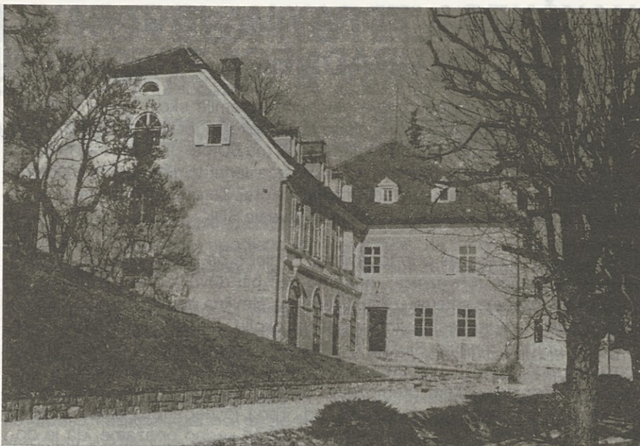
Rogaška Slatina- Grafični muzej, 1989