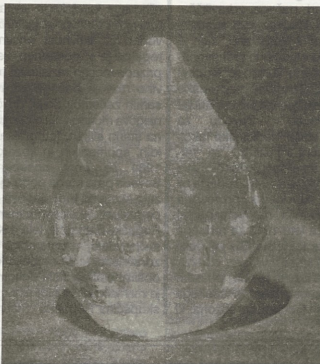
Tanja Pak - Stekli obtežilnik za papir