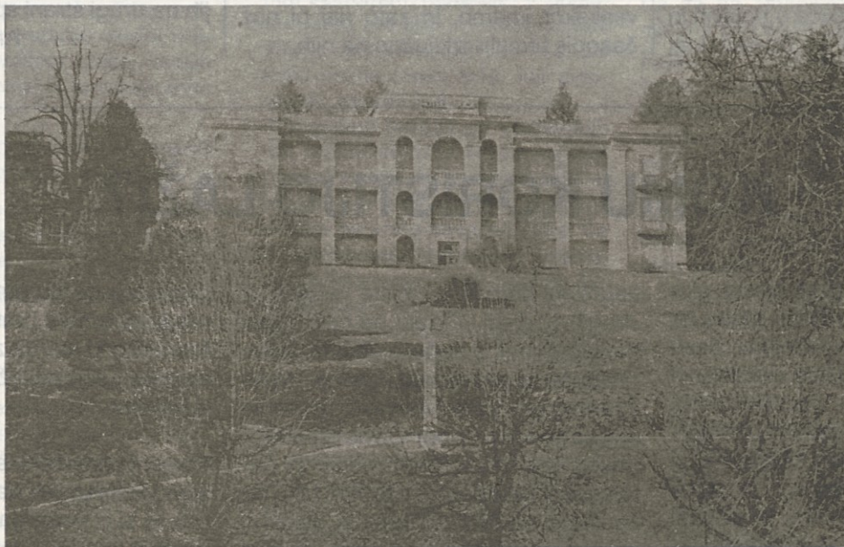
Rogaška Slatina, Hotel Soča, 1989