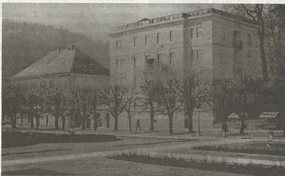
Rogaška Slatina, Hotel Ljubljana, 1989