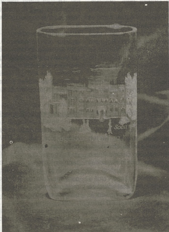
Remi in Dana Kočica - Kopija starega kozarca za pitje mineralne vode z vgravirano veduto Rog. Slatine