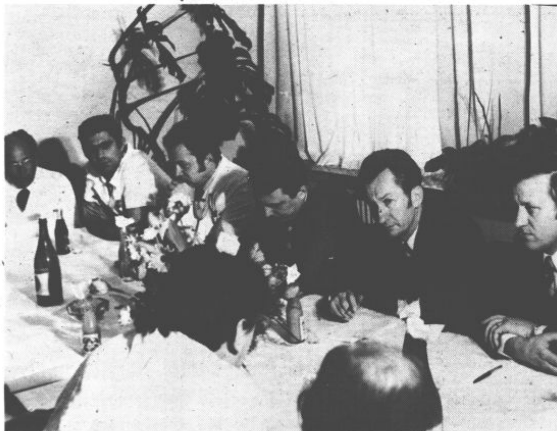
Sekretar izvršnega komiteja predsedstva centralnega komiteja Zveze komunistov Slovenije Franc Šetinc se je mudil minuli ponedeljek v Slovenjem Gradcu. Poročilo o obisku objavljamo na 2. strani.

elektrarne Šoštanj nemo-tene. Dnevno ga odpremijo celo nekaj več, kot ga porabijo, tako da so se v prvih dveh mesecih letos za več kot enkrat povečale zaloge lignita na deponiji.