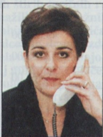
Piše: Lidija Jerkič, univ. dipl. iur.