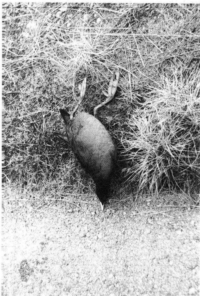
Slika 1: Liska Fulica atra, 5. 12. 1987, Ormož

Nadalje lahko zbiramo in urejamo tudi zbirke najrazličnejših telesnih delov kot so lobanje, noge, peruti, peresa ali kar cele primerke, če so dovolj dobro ohranjeni. Sam recimo na ta način urejam zbirko peres. Vse to gradivo nam bo kasneje koristilo na terenu, ko