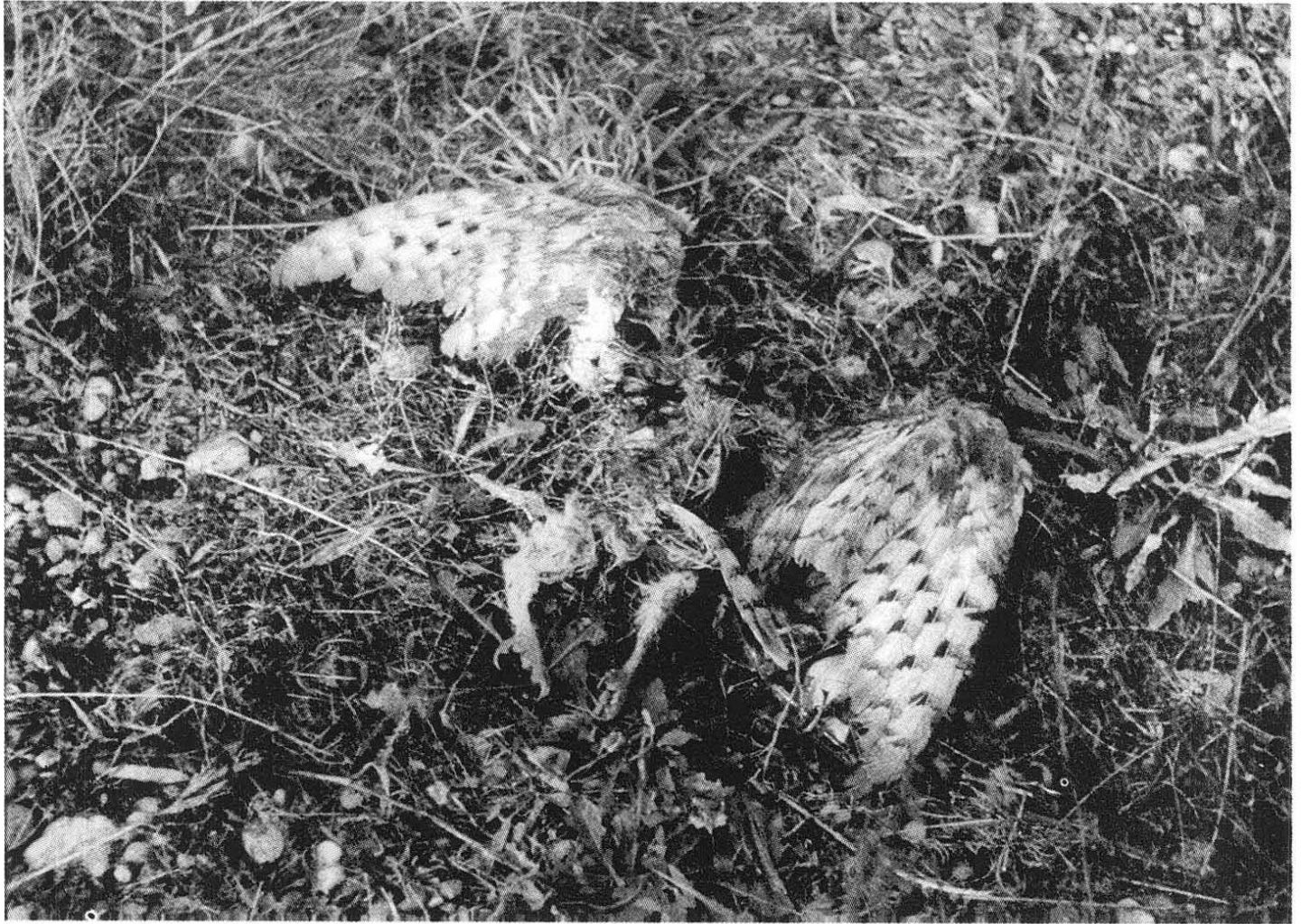
Slika 4: Pegasta sova Tyto alba, 5. 12. 1987, Ormož