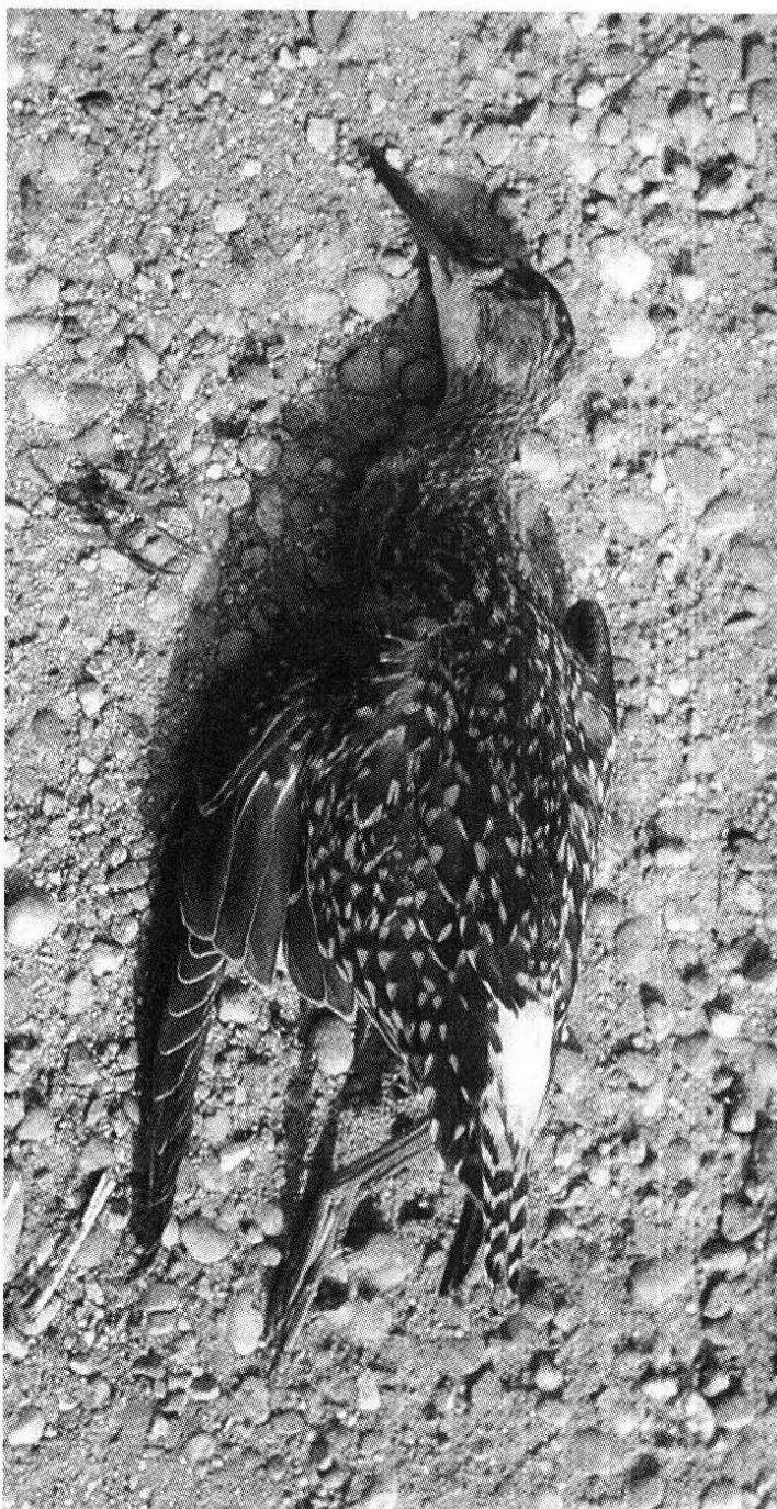
Slika 2: Močvirski martinec Tringa glareola, 2. 8. 1980, Ormož

In nenazadnje nas na nogi lahko preseneti še obroček!