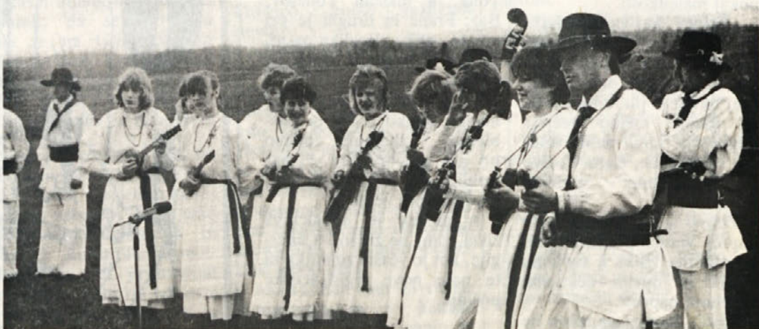
Nagradno vprašanje – Kje je bila posneta fotografija, ob kakšni priložnosti in kdo je stal za fotoaparatom? Odgovore pošljite v uredništvo Vezila.