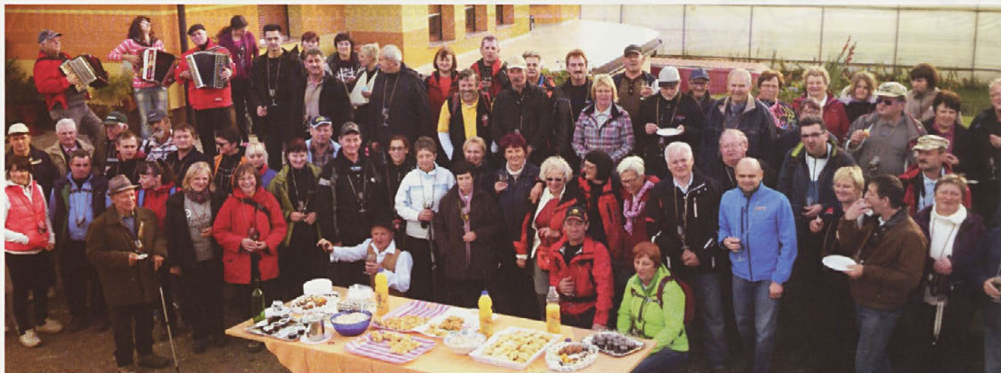
Vinogradniški pohod po vinsko-turistični cesti Kukava-Hlaponci in po delu Rotmana (Vinšak).