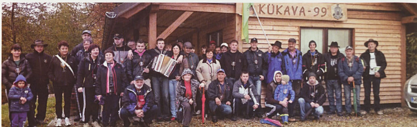
Martinovega pohoda na Kukavi se je kljub slabemu vremenu udeležilo veliko pohodnikov.