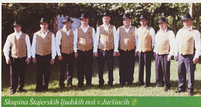
Skupina Štajerskih ljudskih noš v Juršincih

S toplino božič naj vas greje, naj vez med vami utrdi, a novo leto naj zaseje, kar vaše si srce želi. Ljubezen, zdravje in obilje bogato naj vas obdari in vse načrtane naj cilje v uspeh usoda spremeni.