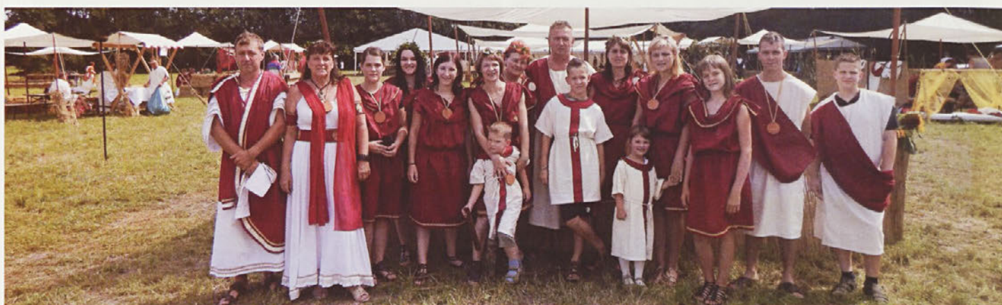
Člani KED smo se avgusta udeležili VII. RIMSKIH IGER, ki so potekale v počastitev 1945. obletnice zbora vojskovodij v Petovionih.