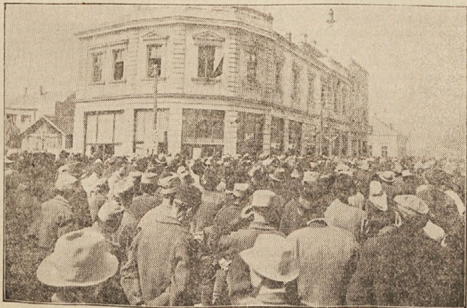
Slika z Ljotićevega shoda v Smederevu dne 7. t. m., kjer je bilo zbranih 7000 kmetov

Zakaj se je v Jugoslaviji v teh 16 letih nabralo toliko nezadovoljstva? Zato, ker nismo imeli državne in splošne ljudske politike, ampak smo imeli političko strank, katerij in klik, politiko, ki je šla za tem, da ugodni interesom posameznih oseb ali skupin, organiziranih v strankah, katerijah in klikah. Vsa težka in usodna vprašanja so se reševala z ozkega, strankarskega stališča, ne pa s splošnega ljudskega stališča. Vodila se je in se še vodi politika »naših« ljudi. Ako nisi naš, težko tebi! Naše gibanje pa trdi: Država in ljudstvo — to je politika! — Gotovo ste imeli tudi pri vas državnega uradnika, bodisi višjega ali nižjega, ki je vestno vršil svojo službo ljudstvu in državi, čigar službovanje je bilo veskozi zakonito in prožeto z iskrenim prijateljstvom do ljudstva. In doživeli ste, da je bil ta uradnik preganjan, prestavljen ali celo reduciran. In ste zopet imeli državnega uradnika, čigar delovanje je bilo v nasprotju z onim zgoraj, pa je ta uradnik v nasprotju od onega napredoval na višje položaje. Zakaj? Ker je ta drugi uradnik deloval za svojega vplivnega prijatelja