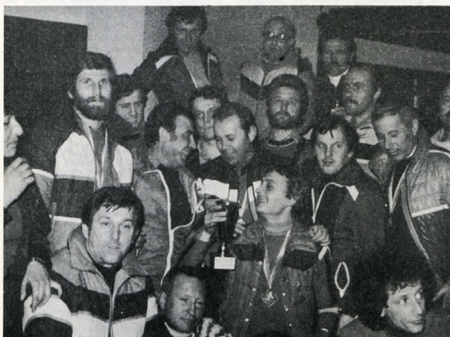
Skupina smučarjev po razglasitvi rezultatov