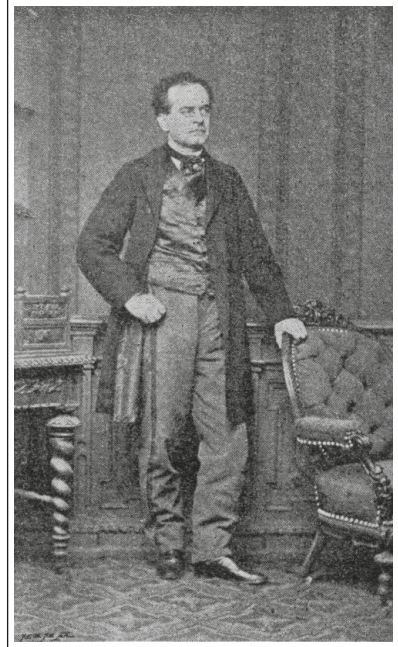
Blaž Kocen.

Kartograf Blaž Kocen se je rodil 24. januarja 1821 v Hotunjah pri Ponikvi. Gimnazijo je obiskoval v Celju, licej pa v Gradcu. Bogoslovje je obiskoval v Celovcu, na fizikalnem zavodu dunajske univerze pa je leta 1853 opravil izpit iz prirodopisja, fizike in matematike. Služboval je kot duhovnik v Šentrupertu nad Laškim, Šoštanju in Rogatcu. Po letu 1849 je prišlo do reforme gimnazij, ko so potrebovali profesorje. Kocen je dve leti poučeval na gimnaziji v Celju, nato pa v Ljubljani, Gorici in na nemški gimnaziji v Olomucu. Posebej ga je zanimala geografija, za katero je napisal številne učbenike za srednje in osnovne šole. Na Dunaju je pomagal pri ustanovitvi zasebnega kartografskega podjetja, kjer je začel izdajati atlase za osnovne, meščanske in srednje šole. Prevajali so jih v mnoge jezike in doživeli so številne ponatise. Atlas iz leta 1875 je vseboval karto slovenskih dežel.