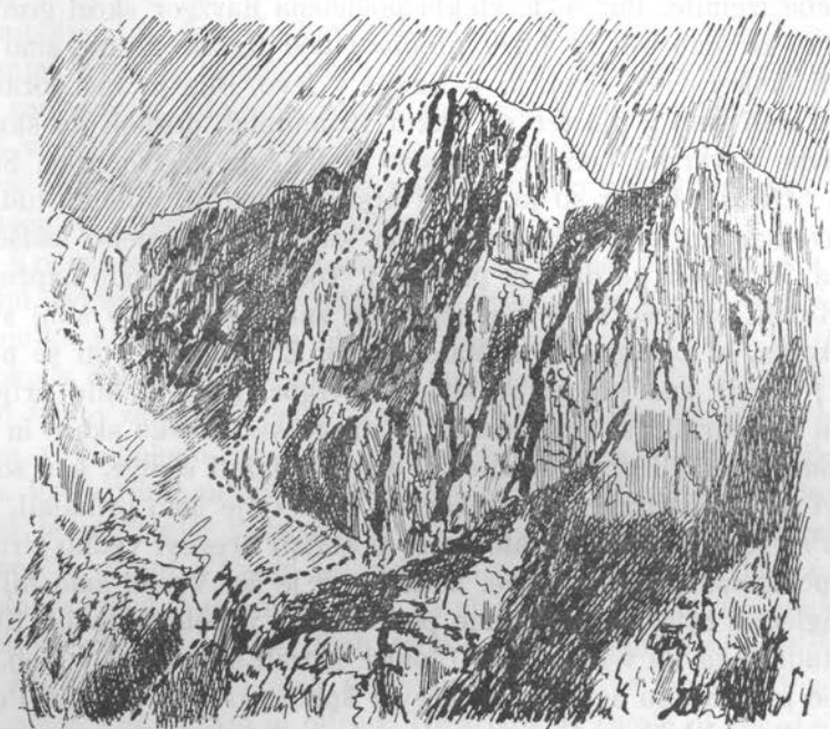
Severozapadna stena Škrlatice. .... Plezalna smer

Meni je sicer vseeno, ali plezam kot prvi ali kot drugi; saj pri težji-plezalni turi morajo biti vsi plezalci prvovrstni, posebno če se pleza v neznanem terenu. Vsak plezalec ima svoj delokrog ostro načrtan. Prvi je pri plezanju navzgor izpostavljen nevarnosti, da globokeje pade; zato mora biti v svojih gibih popolnoma svoboden in ne sme imeti pri sebi nobene stvari, ki bi ga ovirala, posebno ne nahrbtnika. Naloga drugega pa je, da varuje prvega. To ni nič manj težko: paziti mora na vsak gib predplezalca, pomagati mu mora z