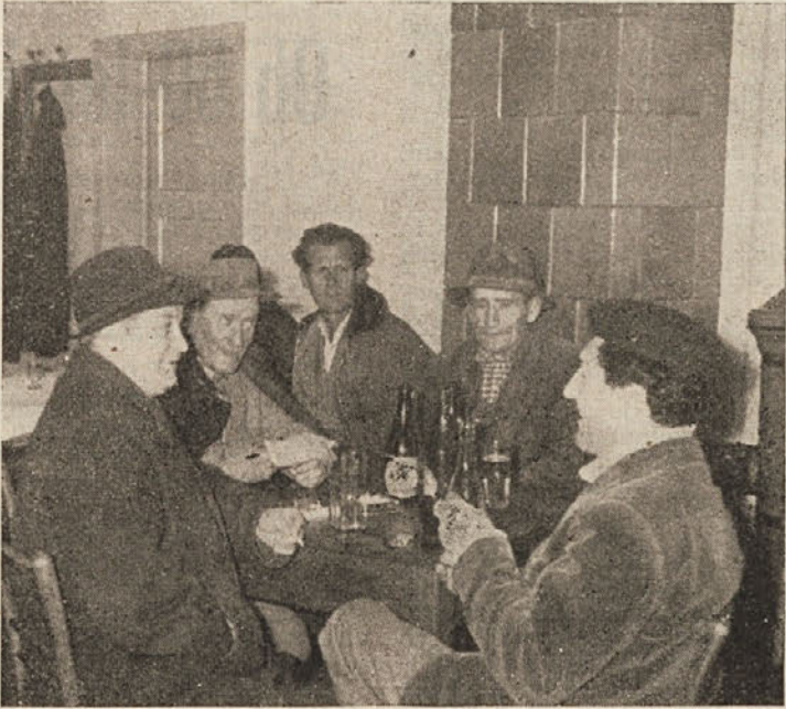
Gostje v Turjaku

ena moč 1200 din na dan. To je pa kar dober zaslužek. Tudi KZ ima pri tem nekaj dobička. Tako ti majhni delovni kolektivi, ki se jih nikjer ne vidi, združeni v KZ, ustvarjajo lep dohodek sebi in skupnosti.