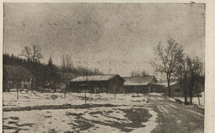
Delavsko naselje v Turjaku

Helena Kožar je rojena 14. novembra 1884. leta na Sapu pri Grosupljem. Leto 1910 se je poročila na Turjak. V zakonu je rodila 10 otrok. Leta 1925 ji je umrl mož in potem je sama skrbel za otroke, od katerih so