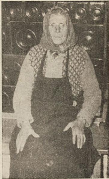
Kožarjeva mama iz Turjaka

Gostinski obrat pri Ahacu je znan vsem potujočim ljudem