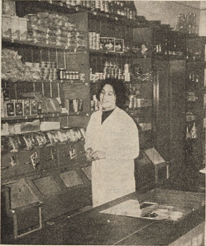
V trgovini Turjak