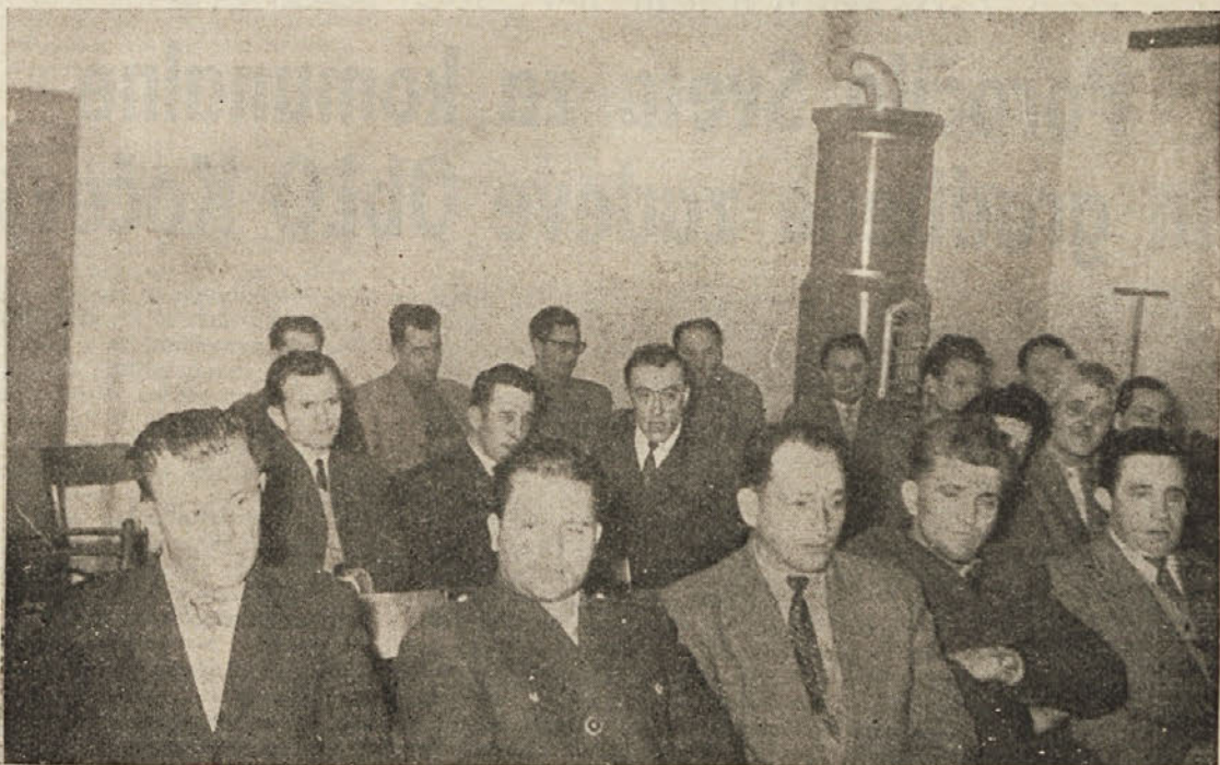
Delegati občinske konference ZROP poslušajo poročilo predsednika