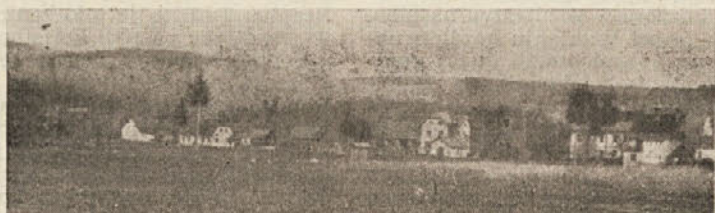
Center Strug s šolo v sredini

Dolina Strug je bila mirna in tiha. Pogled na hiše in domove ljudi vzbudi v človeku občutek toplote do našega slovenskega doma, ki je vedno tako prijeten. Zdi se nam, da smo prišli na naš dom, dom naše mladosti, ko nismo imeli še stanovanjskih blokov, stolpnice in vsega tistega, kar imamo danes. Dolina Strug je še vedno tisti naš skromni in tihi dom, v katerega še ni posegla industrija in doba 20. veka. In vendar imajo tudi Struge svojo zgodovino in napredek.