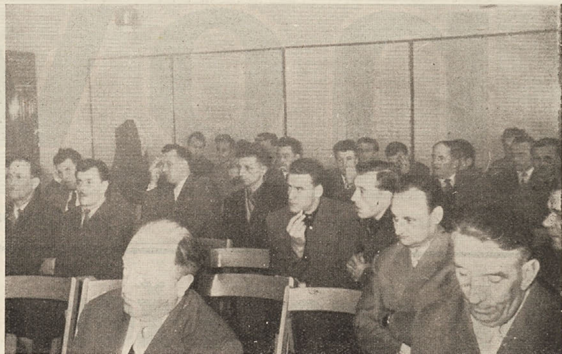
Del udeležencev letne konference ZK Rudnik