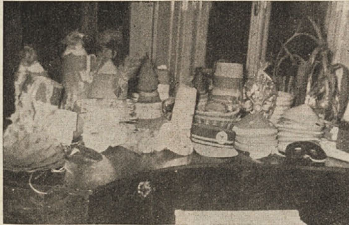
Priprave za ribniški karneval

»Kako gredo kaj priprave za vašim astronautom?« smo vprašali Ribničane.