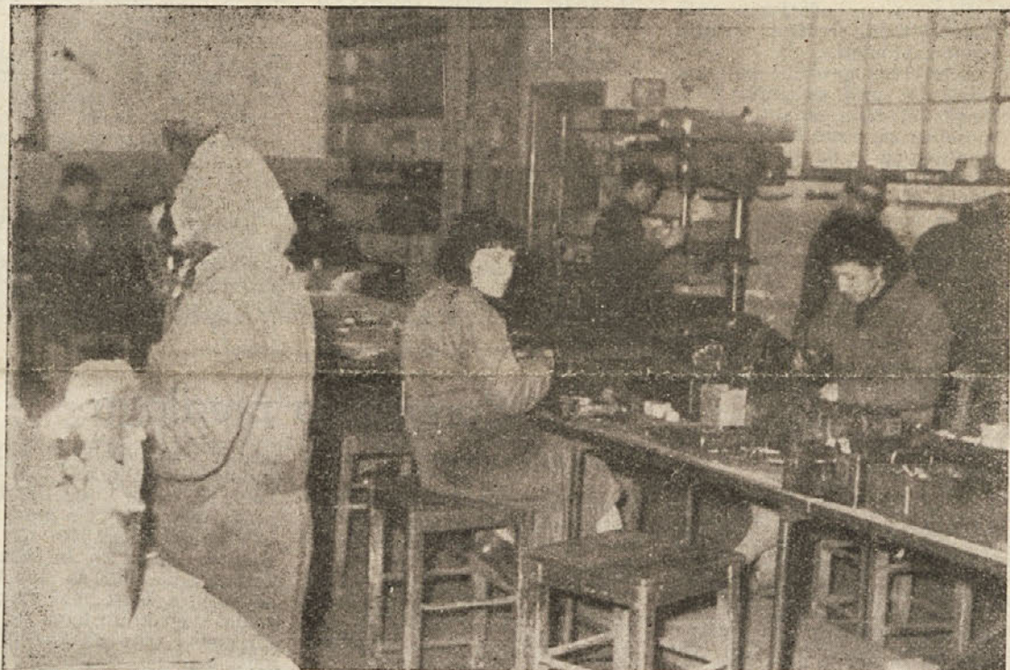
V Inkopu je zaposlenih 65 žensk

v prvi vrsti pravilne politike pri poglobljanju delavskega upravljanja, nagrajevanja po učinku in drugih oblik socialističnih družbenih odnosov.