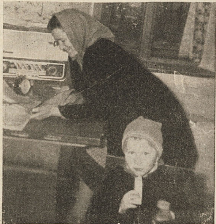
Ženska z otrokom iz Velikih Lašč

Pri Somrakovih smo dobili samo ženske in otroke. Mati je iz koruznega ličja pletla predpraž-