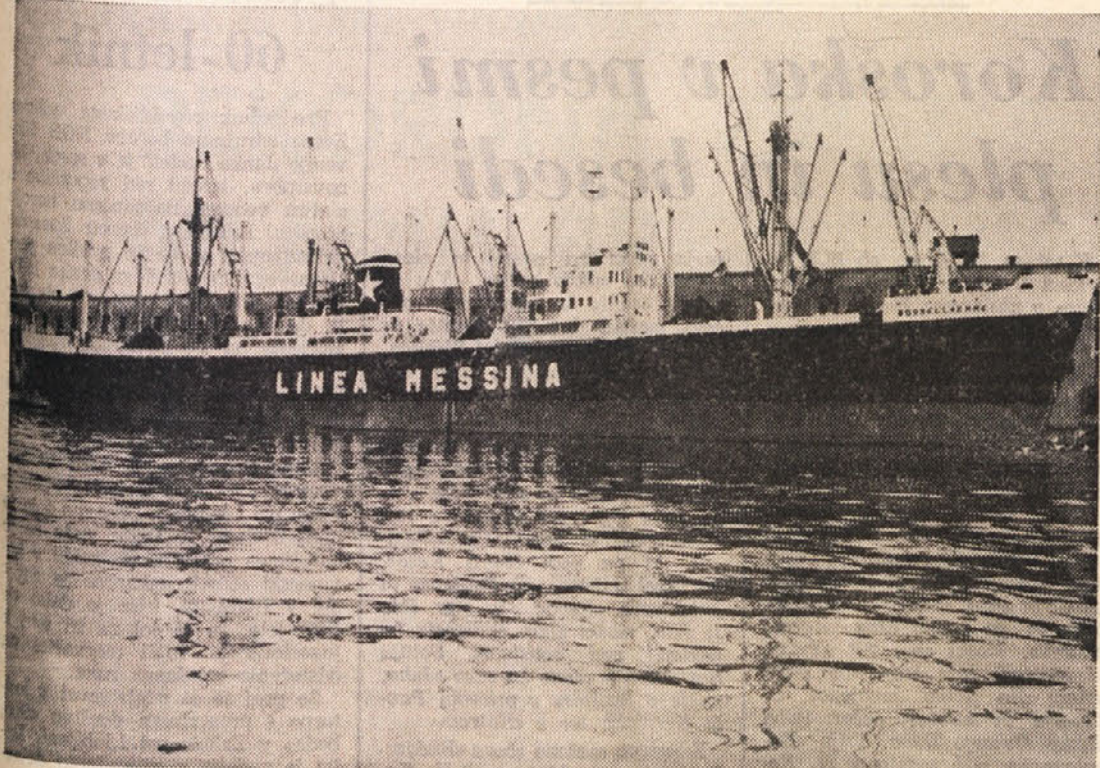
Ena izmed petih ladij, ki bodo vzdrževale novo redno zvezo med Trstom in Avstralijo