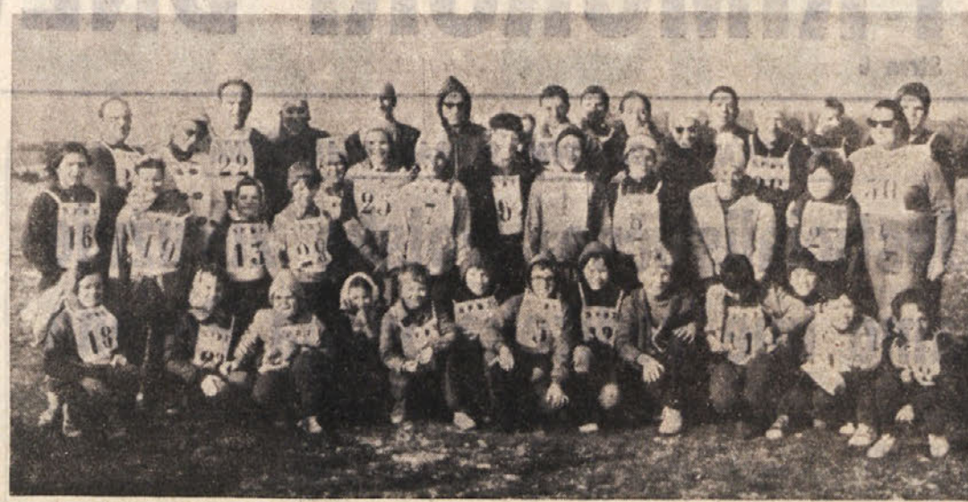
Rekreacijskega in kondicijskega tekmovalca, ki ga je SPDT Trst organiziralo pod imenom «križ - kraž - kross» v bližini Bazovice, se je udeležilo več kot 40 mladih in starejših smučarjev in planincev. Kljub hladnemu vremenu, je tekmovalce doseglo lep uspeh