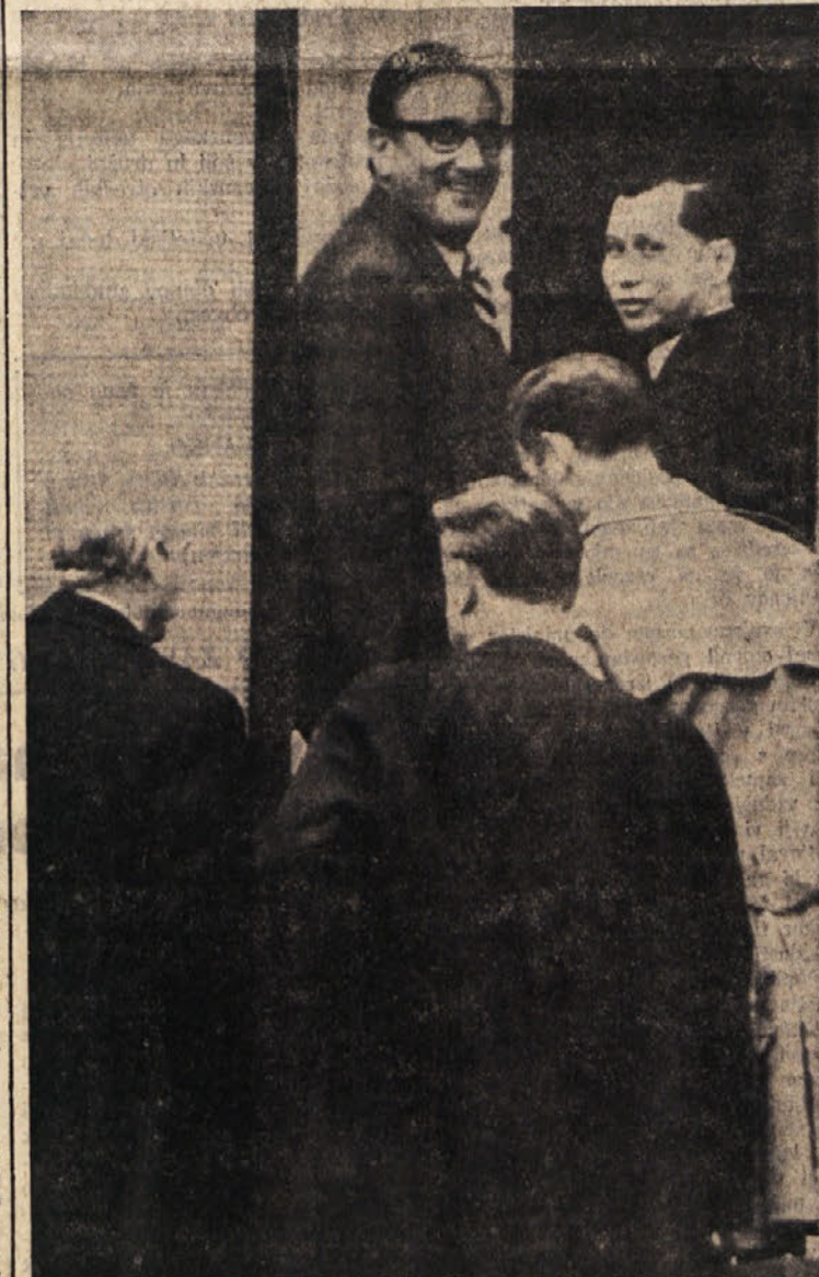
Kissinger v spremstvu drugih članov ameriške delegacije ob prihodu na tajna pogajanja

PARIZ, 21. — V vili, oddaljeni približno 60 km od francoskega glavnega mesta, so se nadaljevala tajna pogajanja med posebnim Nixonovim odposlancem Henryjem Kissingerjem ter hanoiskimi pogajalci Le Duc Thojem, ki ga spremlja še severnovietnamskega odposlanca na pariških pogajanjih o Vietnamu, Xuan Thuy. Danes sta bili na vrsti dve srečanju, o katerih pa ni nobene vesti. Nekateri opazovalci so skušali pripisati ne vem kakšen pomen dejstvu, da sta si Kissinger in Le Duc Tho po zaključku današnjih pogovorov segla v roke in da sta bila oba nasmajana. Gre za vsakdanjo rutino, ki ji ni pripisati nobenega posebnega pomena.