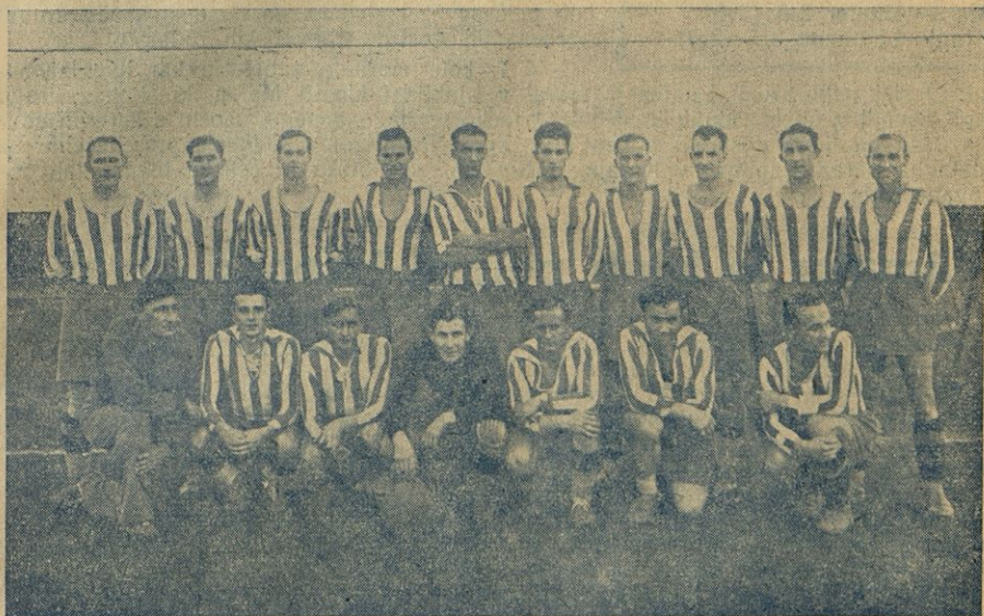
LIGASKO MOŠTVO SK LJUBLJANE 1938