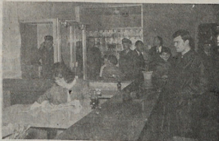
V novi pošti v Kočevju

Na zadnji seji sveta za komunalne in stanovanjske zadeve pri občinski skupščini Kočevje so razpravljali predvsem o gradnji nove Tomšičeve ceste v Kočevju in o predlogu odloka o stanarinah in gopodarjenju s sredstvi stanovanjskih hiš. Sedanja Tomšičeva cesta ima slabo osnovo, je vijugasta in ima še nekatere druge pomanjkljivosti. Nova bo bolj ravna, bolje utrjena in asfaltirana. Potekala bo deloma po povsem novi trasi (bliže novi kemični tovarni). Dokončana bo morda že letos.