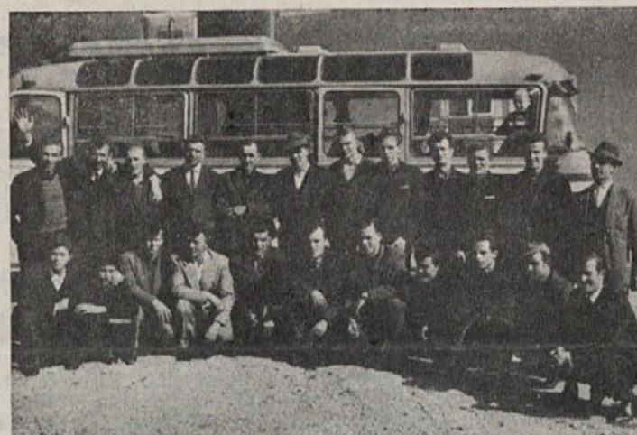
»Zidarjevi« zidarji pred odhodom v Skopje

ideje in dejanja. Sadove dela mladine lahko vidimo povsod. Mlade generacije so iz dneva v dan opazljive in opozarjale na nepravilnosti, na izboljšave. Te revolucionarne podlage mladine, to njeno navidezno nestrpnost in kritiziranje vsega, kar se zdi mladini nepravilno, ne smemo obsojati, kajti vse to pripomore pri izgradnji res socialističnih odnosov, k izgradnji take ureditve, ki bo ustrezala načelom NOB in so-