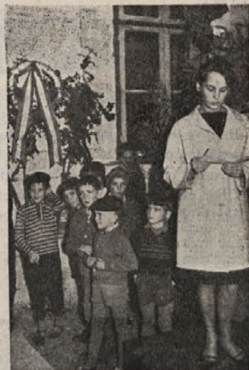
Ob praznovanju 20-letnice I. kongresa ZSM v Kočevski Reki so tamkajšnji pionirji in mladina nastopili s krajšim kulturnim programom

VPIS LJUDSKEGA POSOJILA ZA OBNOVO IN IZGRAADNJO SKOPJA