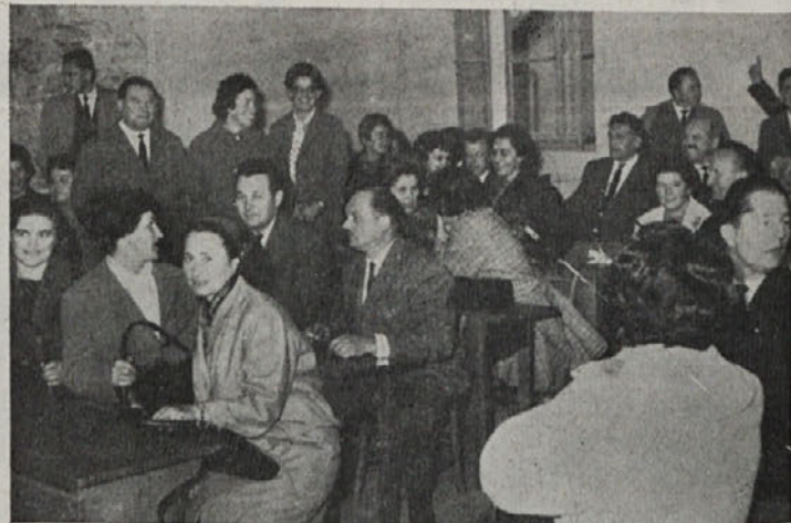
Preživeli udeleženci I. kongresa ZSM v Koč. Reki so se ob praznovanju 20-letnice kongresa posedli v šoli po istih sedežih kot takrat

ja, od takrat pa do začetka tega meseca je bil pretvornik v poizkusnem obratovanju. Po odstranitvi nekaterih napak je bil naš pretvornik (ki oddaja na osmem kanalu v smeri Mozlja) vključen v redni program RTV mreže. Elektro Kočevje prosi TV naročnike, naj mu sporoče, kako so zadovoljni z novim sprejemom oziroma delom novega TV pretvornika (telefonska številka 86026).