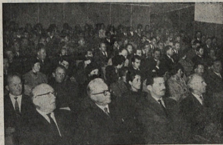
Slovenski zgodovinarji so od ponedeljka do srede ta teden imeli v Seškovem domu 12. zborovanje. Na sliki: pogled v dvorano

Težave so bile na nekaterih mestih s stranišči, katerih niso mogli postaviti v mestu. Zlasti je prišel zaradi tega do izraza sanitarni voz podjetja Snaga iz Ljubljane, to je edini voz podobne vrste v Sloveniji.