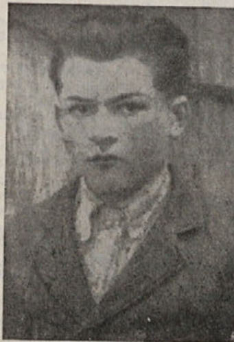
Petrček je pri Jelenovem žlebu poslednjič pomeril na italijanskega oficirja

Belo Krajino ter Hrvatsko. Bojeval se je v Vivodini in Sv. Križu ter se v mrzlih januarskih dneh in snežnih metežih prebijal skozi