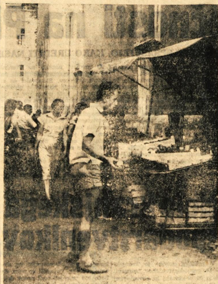
Ze dolgo je tega, kar cerkveni zid v Kranju nudi zavetje vsem čistim branjevkam in branjevcem, ki prodajajo tudi takrat, ko ni tržnega dne. Res, da se ne pritožujejo, le takrat, kadar dežuje in sedaj, ko jim hočejo ose pojesti vse sadje, žalostno pogledujejo proti zidu, za katerim bo stala nova tržnica

V Crnomlju bo 19. in 20. avgusta zbor PTT delavcev Slovenije, združen z otvoritvijo prvega novega poštnega postopja na Dolenjskem. Crnomelj - središče Bele kraji- ne, v katerem je bilo zgodovinsko I. zasedanje SNOS, bo sprejel 19. in 20. avgusta poštno, telegrafsko in telefonske delavce iz vseh kra- jev Slovenije, da skupno z biv- šimi borci aktivisti in interniranci ter prebivalstvom Bele kra- jine proslavi 20. obletnico vstaje jugoslovanskih narodov.