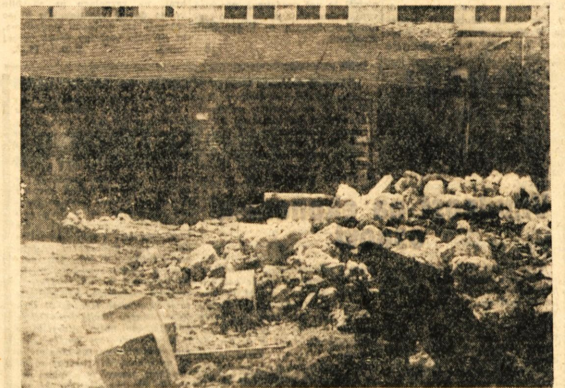
Tale kup kamnja nam res ne obeta nič posebnega, še najmanj pa bi se ob pogledu nanj lahko nadejali, da bo že letos tu stala pokrita tržnica. Vendar so nam na Zavodu za komunarno izgradnjo pri Obli Kranj povedali, da bo gradbeno podjetje Projekt Kranj že prihodnji teden pričelo z gradnjo tržnice, ki naj bi bila usposobljena že do letošnje zime. Zunanji tržni prostori pa naj bi bili urejeni do 1. maja 1962

- Gostišče na Šmarjetni gori se ne more pohvaliti z obiskom med poletnimi meseci. Pravijo, da je vsako leto tako: spomladi in jeseni pa se obisk neprimerno poveča.