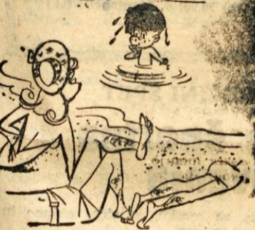
»Mama, moram lutati!«

Lahko rečemo, da noben narod na svetu ni prestopil toliko ponižan- nja, preganjanja in mučenja kakor Židje. Trpeli so zaradi vere, zara- di premoženja, v nacistični dobi pa že zaradi same rase. Hitler jih je hotel popolnoma iztrebiti. Ste- vilo Židov, ki so izgubili življenje v hitlerjanski dobi, cenijo na 5.890.000. Ta pomor Židov se po pravici imenuje NAJVEČJI ZLO- ČIN V VESEJ ZGODOVINI ČLO- VESTVA.