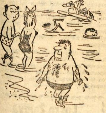
»Kar v vodo napravil!« »Če se ta umazani kovač kopa v tej vodi, potem bomo zahlevali, da jo večkrat izmenjajo!«