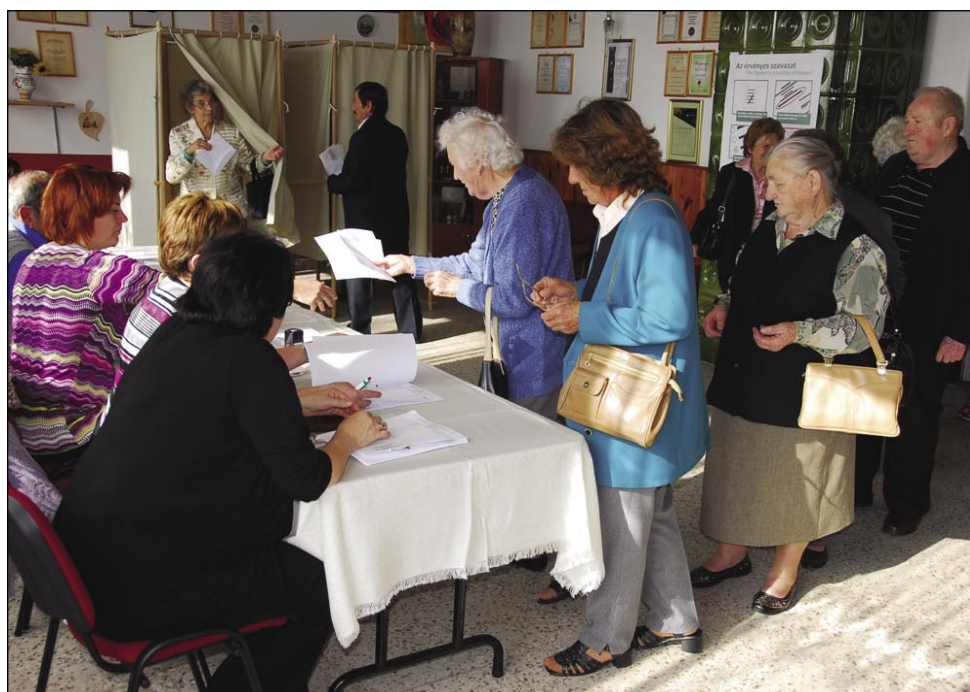
V Števanovci je največ ljudi šlau volit po meši

12. oktobra so bile lokalne in narodnostne volitve (helyhatósági és nemzetiségi választások) v Porabji tó. Kak se kaže, so meli lidgé po porabski vasicaj malo več volé dola dati svoj glas (szavazat) kak povprečno po rosagi, ka je pri nas na volitve šlau več kak 58 procentov volivcov. Da pa med porabskimi vasicami so tó velke razlike. Procentualno največ lidi je volilo ranč v najmenjšoj vesi, v Andovcaj, gde je od 67 volilnih upravičencov (választási joggal rendelkező) šlau volit 55 lidi, tau je 82 procentov. Najmenje aktivni so bili lidgé v najvejšoj slovenskoj vesnici, na Gorenjom Seniki, gde je šlau na volišče samo 35,4 procenta lidi (od 496 lidi 176). Drugi najbole aktivni so bili Števanovčarge (68,2%), dapa tau je nej čüda, vej pa oni so meli 5 kandidatov za župana. Odlaučili so se za školnika Csabo Bartakoviča Császára, steroma je zavüpaló svoj glas 53,7 procenta lidi. Pri vsej drugi vasicaj so meli samo enoga kandidata za župana, vsepovedik so bili tau lidgé, steri so že do tejsa mau tó opravlati tau funkcijo. Sakalovci so bili edina ves, gde je županski kandidat kandidiro s podporo stranke (FIDESZ), vsi drugi so bili neodvisni (független) kandidati. V Sakalavcaj je šlau volit 64,1 procenta lidi, na Verici-Ritkarovcaj 57,6 procenta, na