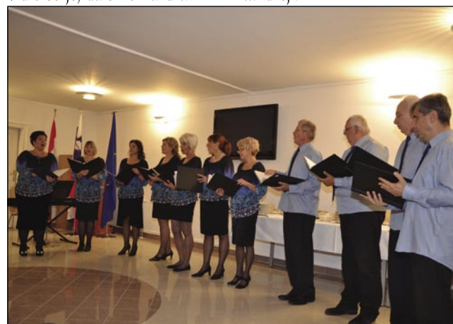
Pevski zbor Slovenskega društva Triglav iz Subotice

Črešnjevcem pa Subotičanom smo v nedeljo pokazali najlepše zanimivosti Budimpešte. Subotičanci so šče bili z našimi v Sentandreji.