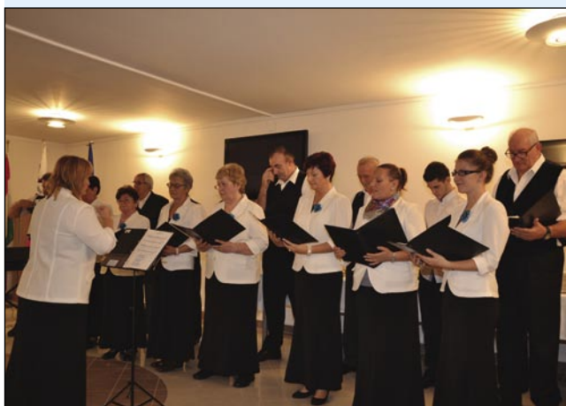
Pevski zbor Slovenskega društva iz Budimpešte

pri nas zdaj tamburaška skupina iz Črešnjevec, iz Subotice pa slovenski pevci Slovenskega društva Triglav.