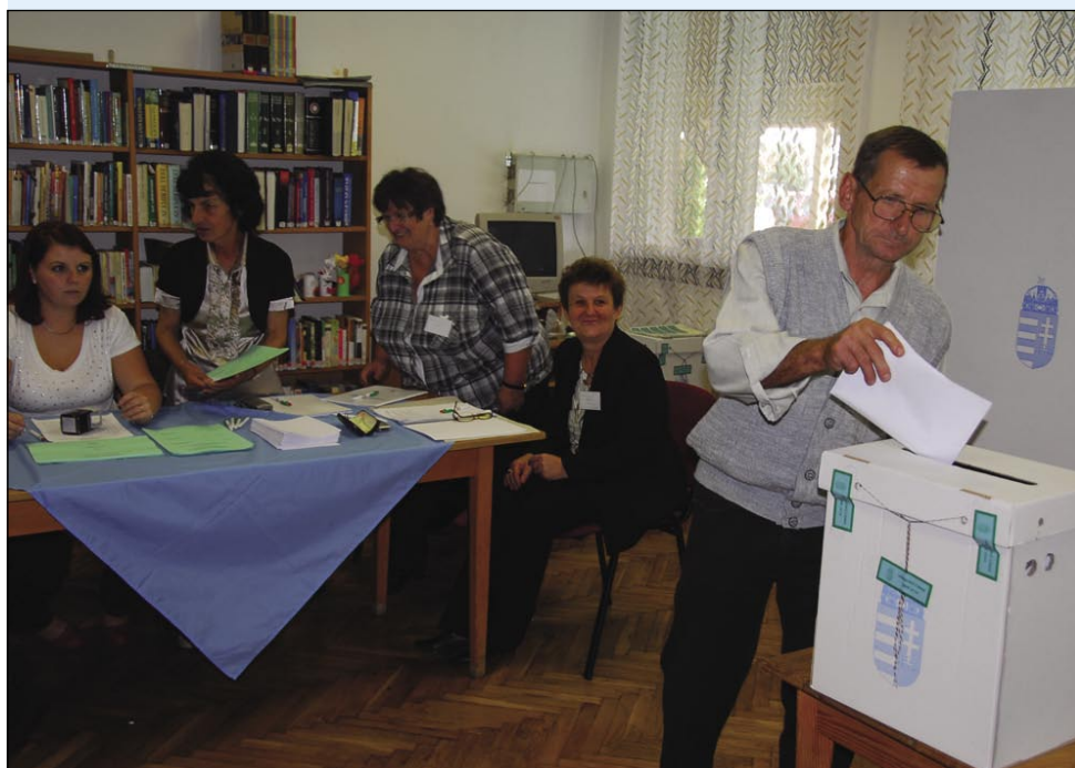
Na narodnostni volitvaj je sodelovalo več kak 71 procentov registriranih