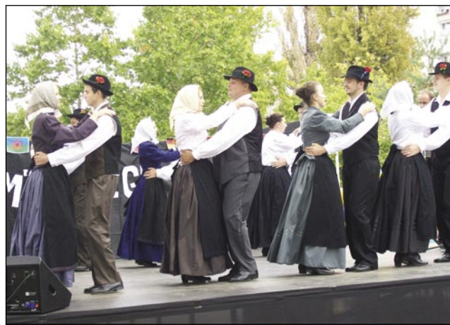
Sakalovska folkloro na odri