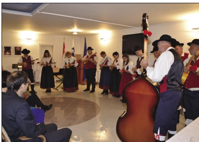
Tamburaši iz Črešnjevec