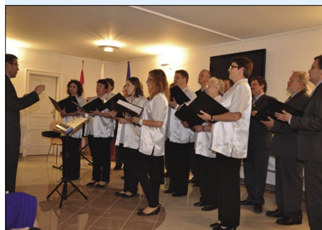
Mešani pevski zbor Zveze Slovencev z Gorenjoga Senika, steri je spejvo pri svetoj meši tō

srečanje slovenskih pevskega zborov iz Vojvodine.