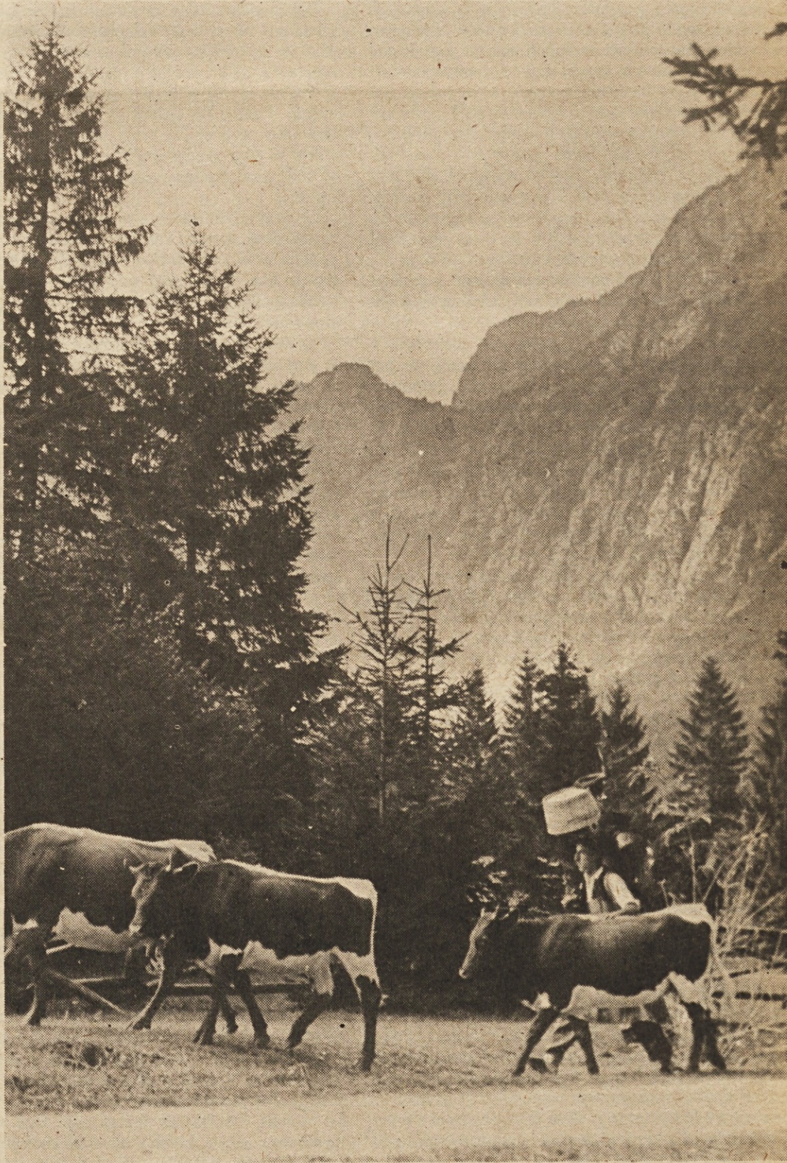
Rejci živine bi lahko pocenili pitanje živine tako, da bi precejšen del močnih krmil nadomestili z domačo krmo

Tako je sedaj v Jugoslaviji baje okrog 25000 ton piščančjega mesa na zalogi: zaradi dviga življenjskih stroškov in drugih cen – se ljudje, kadar se že odločijo za nakup mesa, odločijo za druge vrste mesa, saj je ponudba večja kot prej. Vzrok za velike zaloge pa je tudi v ostalem uvozu piščančjega mesa. Zvezna direkcija za rezerve je lani intervencijsko kupila v tujini velike količine piščancev, del tega mesa pa je prispel šele v letošnjem letu in poslabšal že tako slabo prodajo.