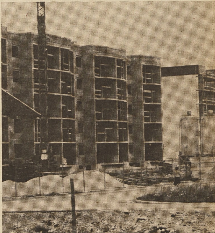
Delavci SGP „Gorenje“ Radovljica so lani za Volčjim hribom v Radovljici zgradili dva stanovanjska bloka z 80 stanovanji. Takoj zatem, v jeseni pa so začeli graditi še dva taka bloka, ki stojita na severozahodni strani prvih dveh. Kot predvidevajo, bo prvi vseljiv še to jesen, drugi pa v začetku prihodnjega leta. Stanovanja grade za prodajo, za tiste pa, ki nimajo sredstev za odkup, financira gradnjo občinski solidarnostni sklad Radovljica. — B. B.