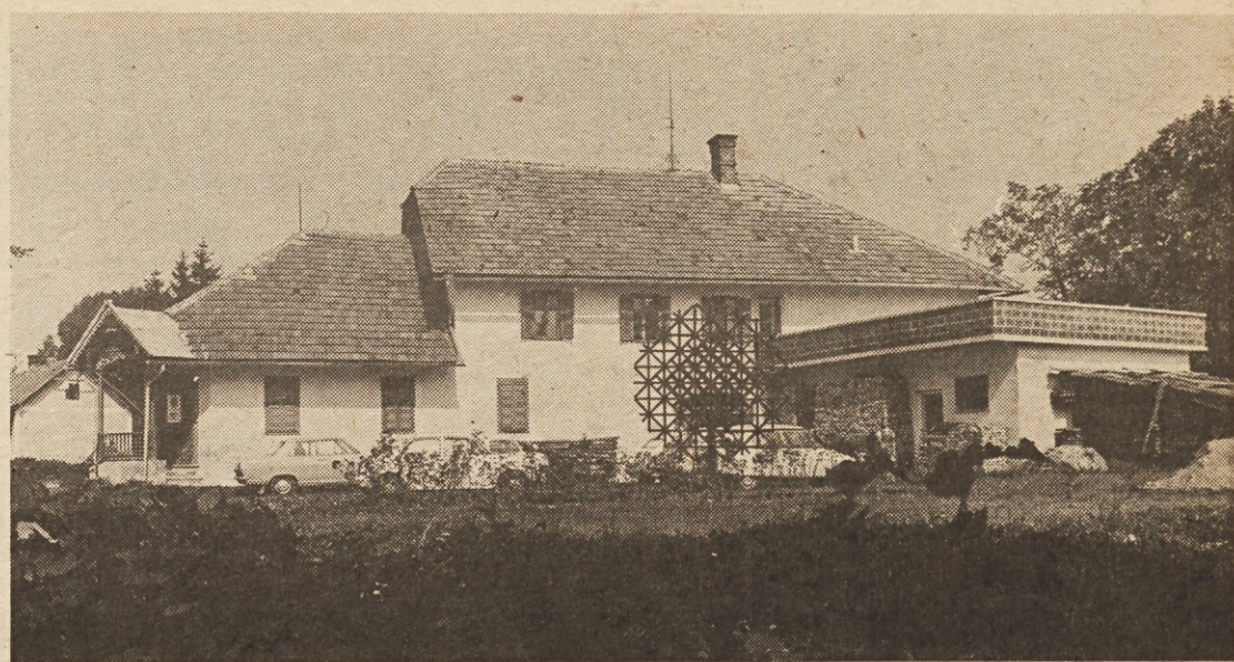
Galerija „Domačija“ v Seliščih v radgonski občini je bila sedež slikarske kolonije „Selišči 74“.

PO STROKOVNO-IZOBRAŽEVALNI SLIKARSKI KOLONIJI »SELIŠČI 74« ● SODELOVALI SLIKARJI – AMATERJI IZ VSE SLOVENIJE