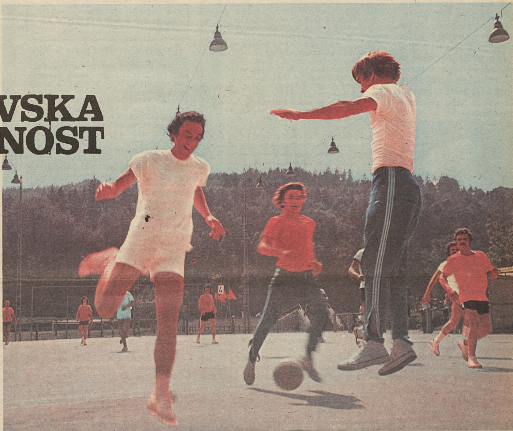
V organizaciji ČGP Delo so bile 30., 31. avgusta in 1. septembra v Ljubljani XIX. letne športne igre delavcev grafične in grafično-predelovalne industrije Slovenije. Športnih iger se je udeležilo 28 grafičnih podjetij iz Slovenije. Tekmovali pa so v namiznem tenisu, streljanju, šahu, odbojki, rokometu in nogometu. Naš posnetek je z rokometne tekme med tiskarno Ljudske pravice in Pomurskim tiskom, ki pa so ga prvi krepko odločili v svojo korist.