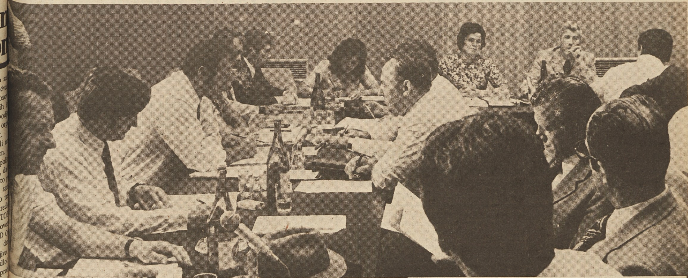
NAKAZUJEJO SE OBRISI 8. KONGRESA ZSS