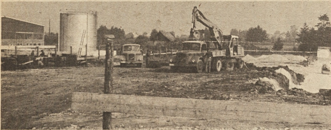
V Opekarnah Ljubecna so pred kratkim začeli graditi sodoben obrat za klinker izdelke. Gradbena dela izvaja celjsko gradbeno podjetje Ingrad, montažno proizvodno dvorano pa bo dobavilo gradbeno podjetje Gorica iz Nove Gorice. Opremo za ta obrat bodo uvozili iz Zahodne Nemčije. Predvidevajo, da bodo prve klinker izdelke izdelali že prihodnje leto.

V KISOVCU BODO SEZIDALI TOVARNO PLINASTEGA BETONA