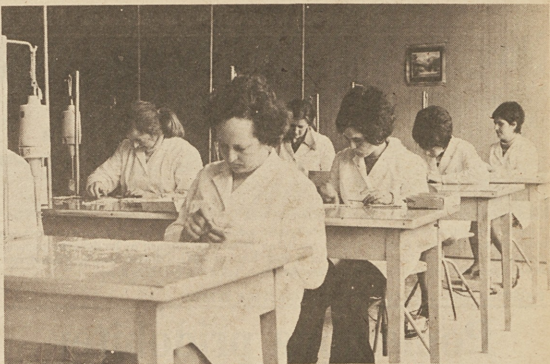
Tovarna Poligalant iz Volčje drage, ki se ukvarja s predelavo plastičnih mas, se je v zadnjih letih močno uveljavila s proizvodnjo umetnih zob. Osvojila je domači trg, navezala pa je tudi tesne poslovne odnose s tujimi partnerji...