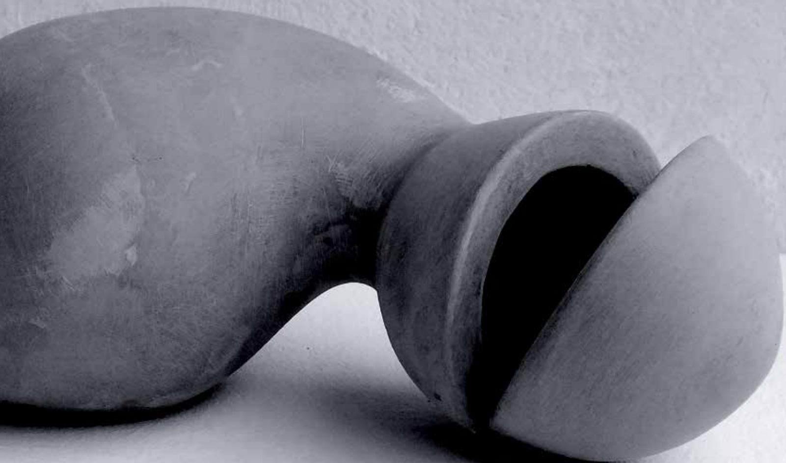
10. Forma, 2023, glina, 11 × 22 × 12 cm