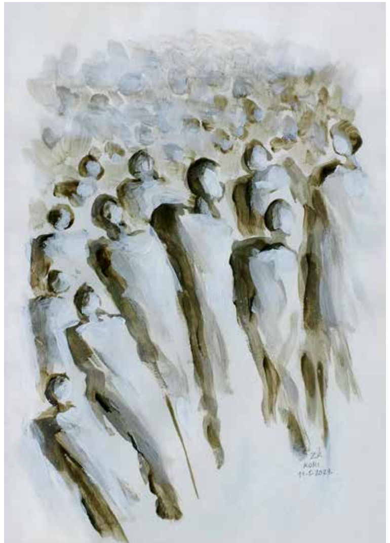
29. Skica, 2023, akril, papir, 30 × 21 cm