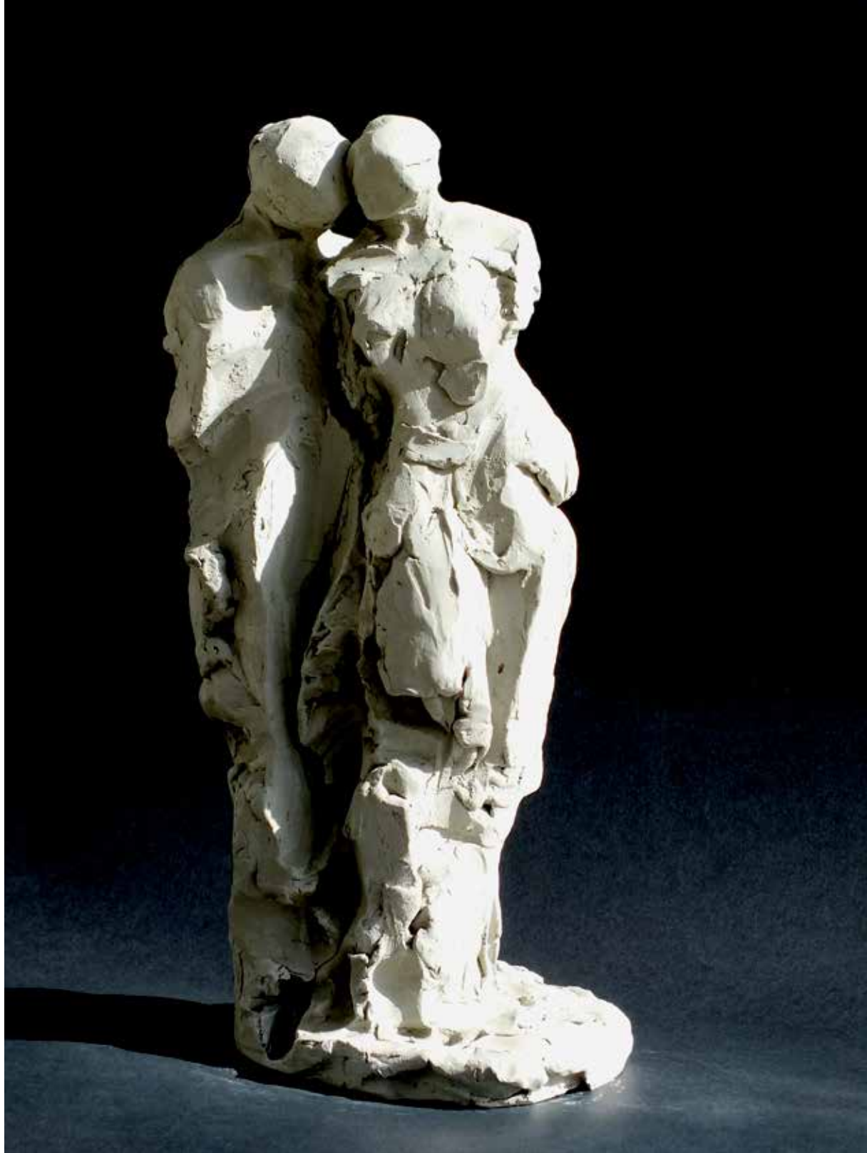
21. Dvoje, 2023, glina, 30,5 × 16 × 13 cm