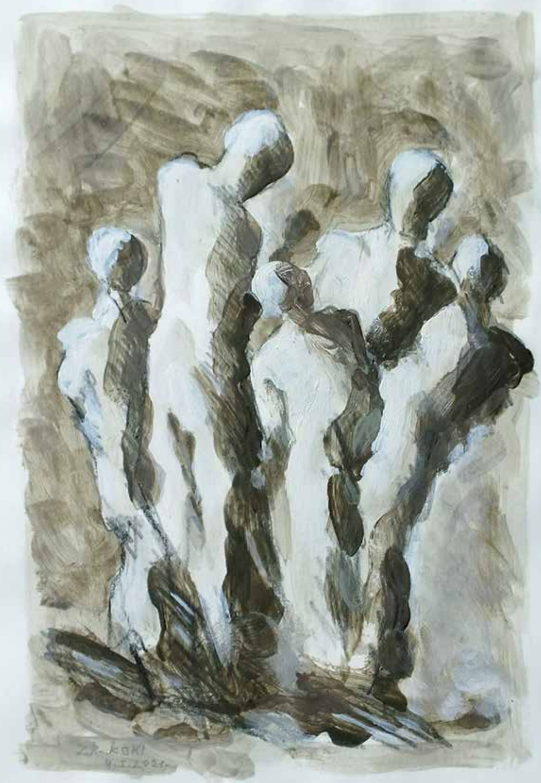
28. Skica, 2023, akril, papir, 30 × 21 cm