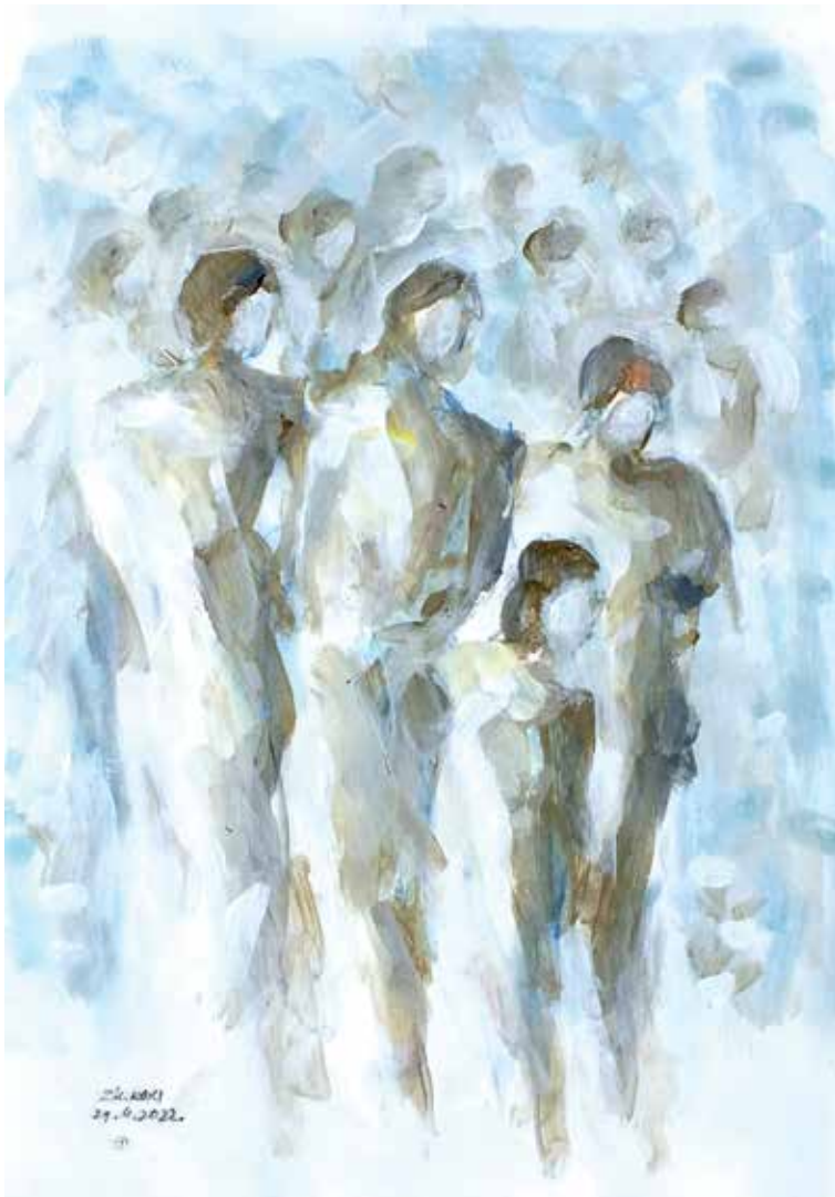
31. Skica, 2023, akril, papir, 30 × 21 cm