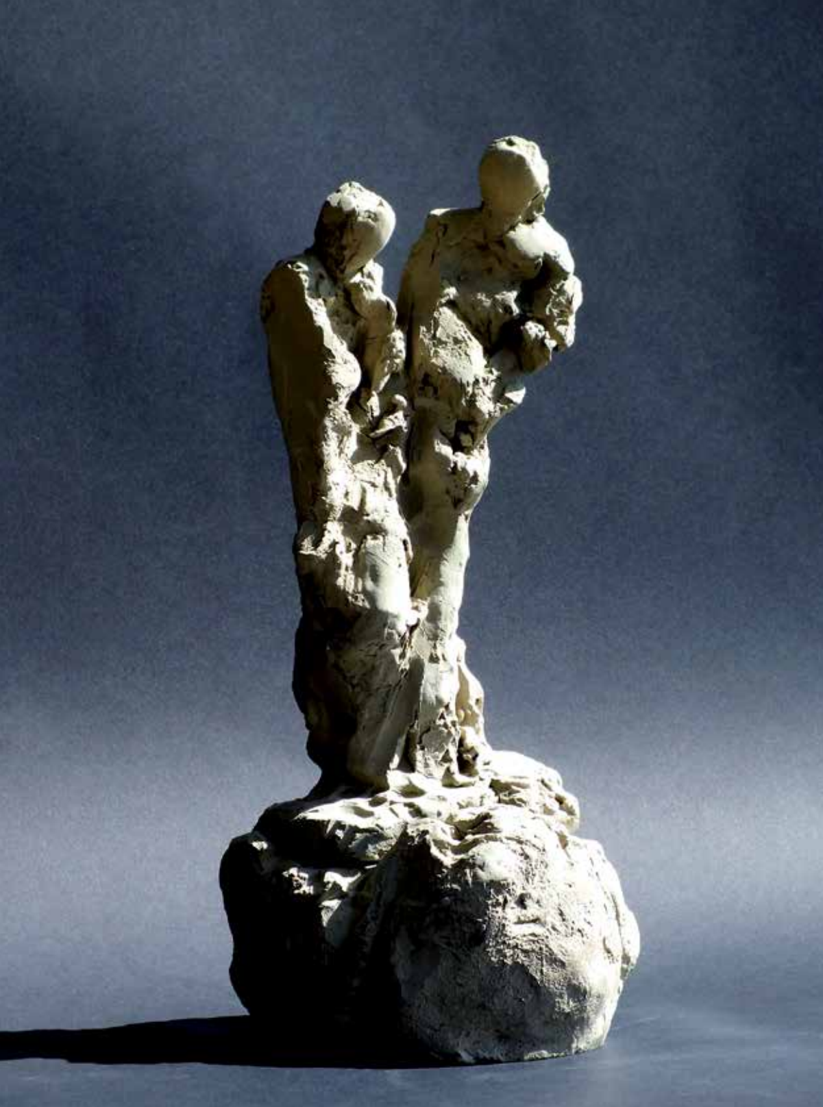
20. Dva, 2023, glina, 32 × 15 × 14 cm