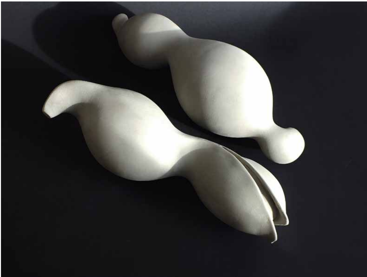
15. Dve formi, 2023, glina, 10 × 31 × 9,5 cm / 10 × 32 × 11 cm