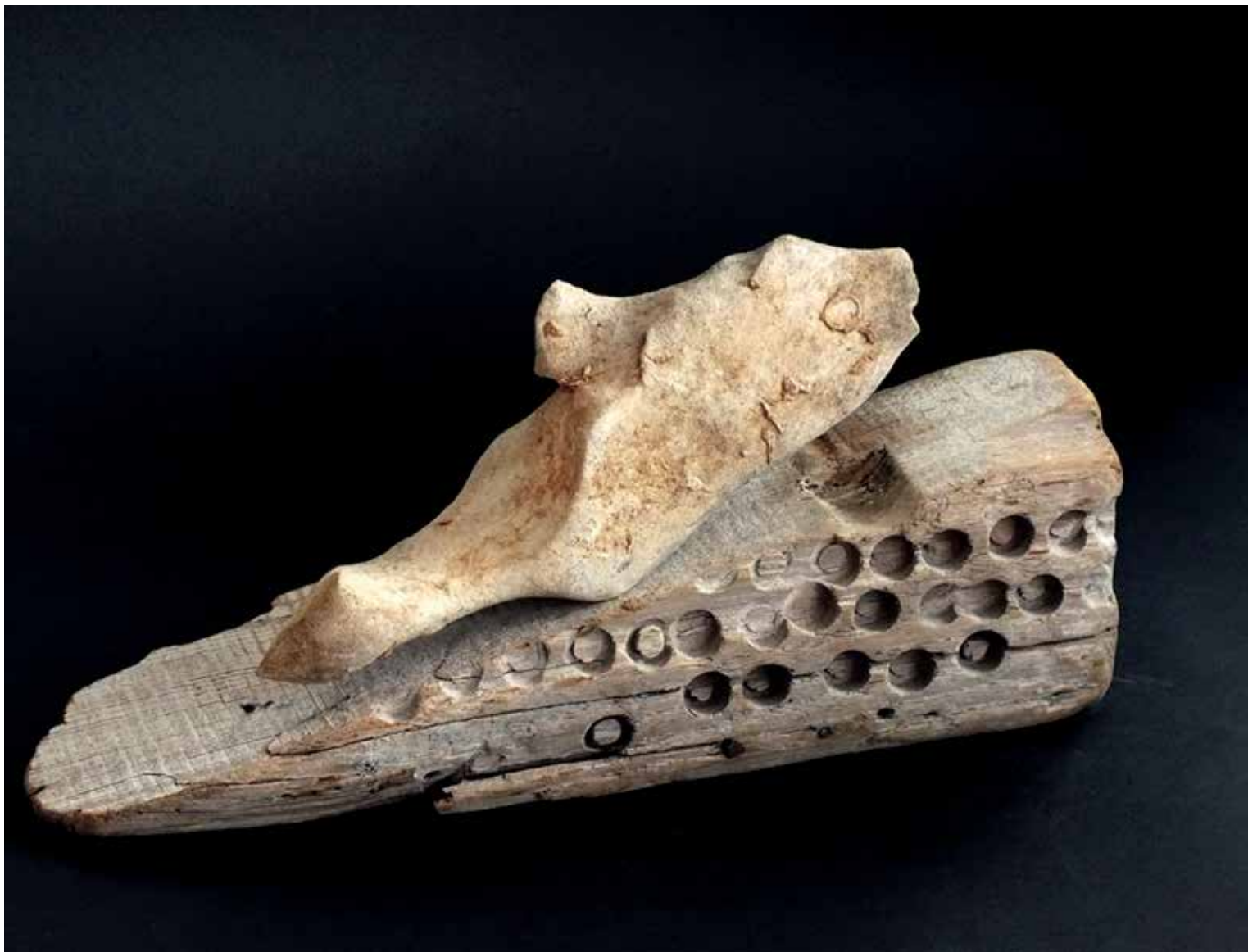
8. Riba, 2023, kamen, les, 18 × 37 × 10 cm (otok Badija)