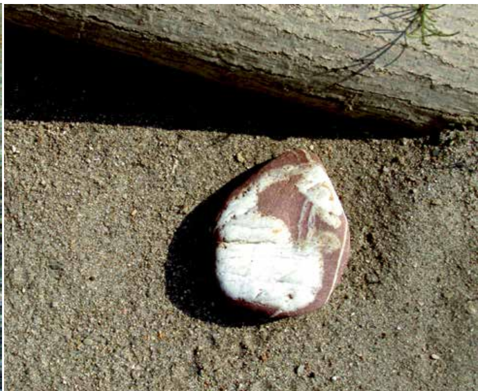
6. Okamenela slika, fotografija, 2010, 30 × 40 cm