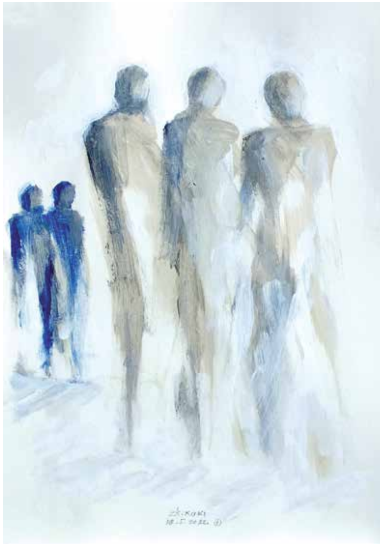
32. Skica, 2023, akril, papir, 30 × 21 cm