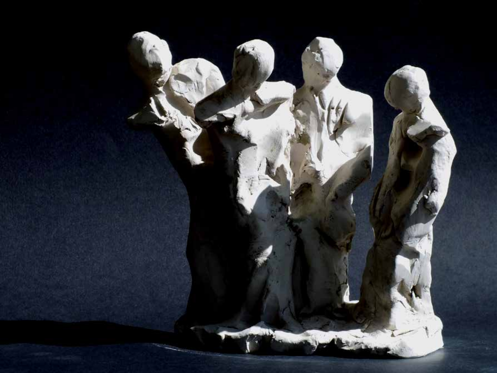
17. Prijatelji, 2023, glina, 18 × 19 × 9,5 cm