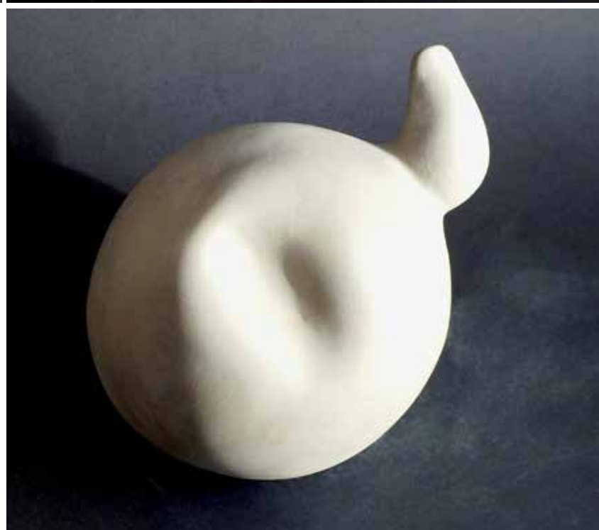
11. Forma, 2023, glina, 11 × 21 × 12 cm