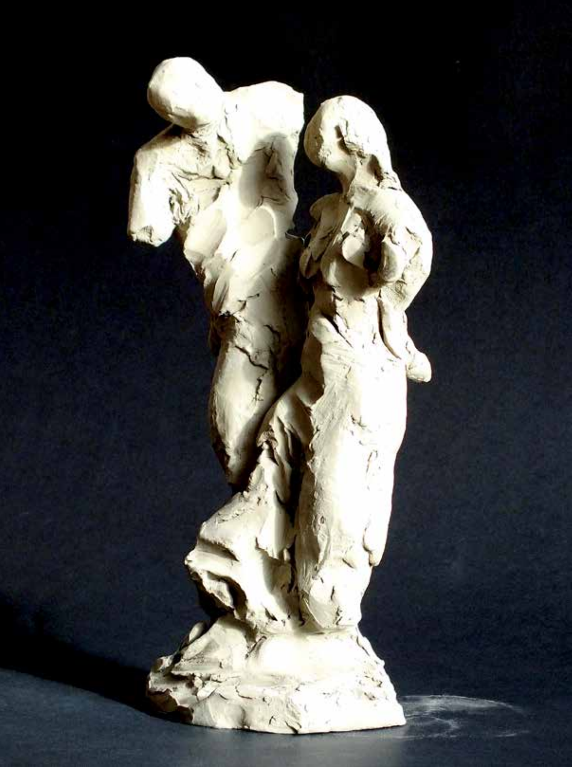
18. Zapeljevanje, 2023, glina, 28 × 14 × 11 cm