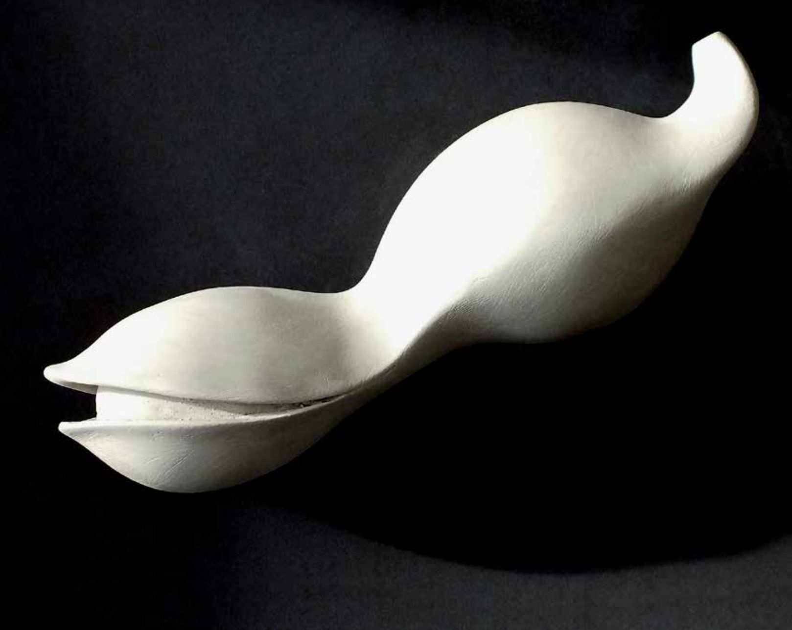
16. Forma, 2023, glina, 10 × 31 × 9,5 cm