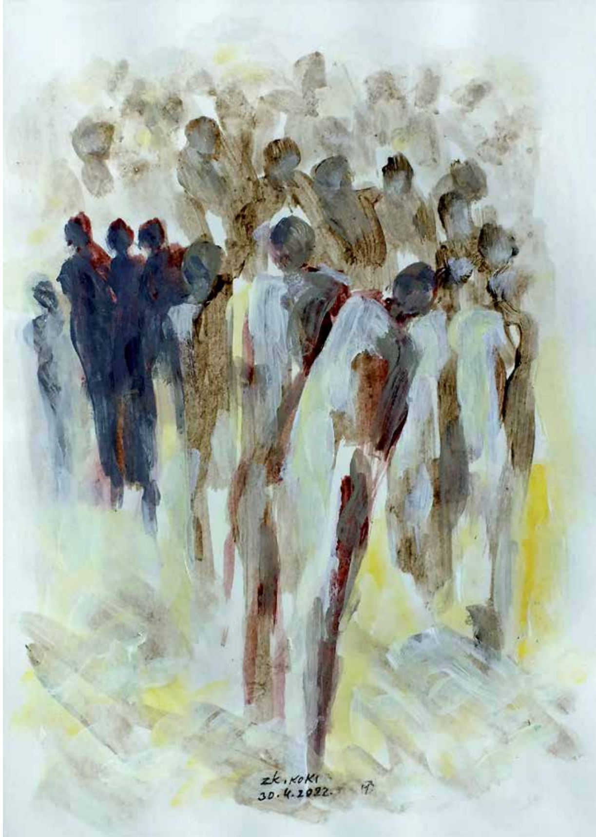
33. Skica, 2023, akril, papir, 30 × 21 cm