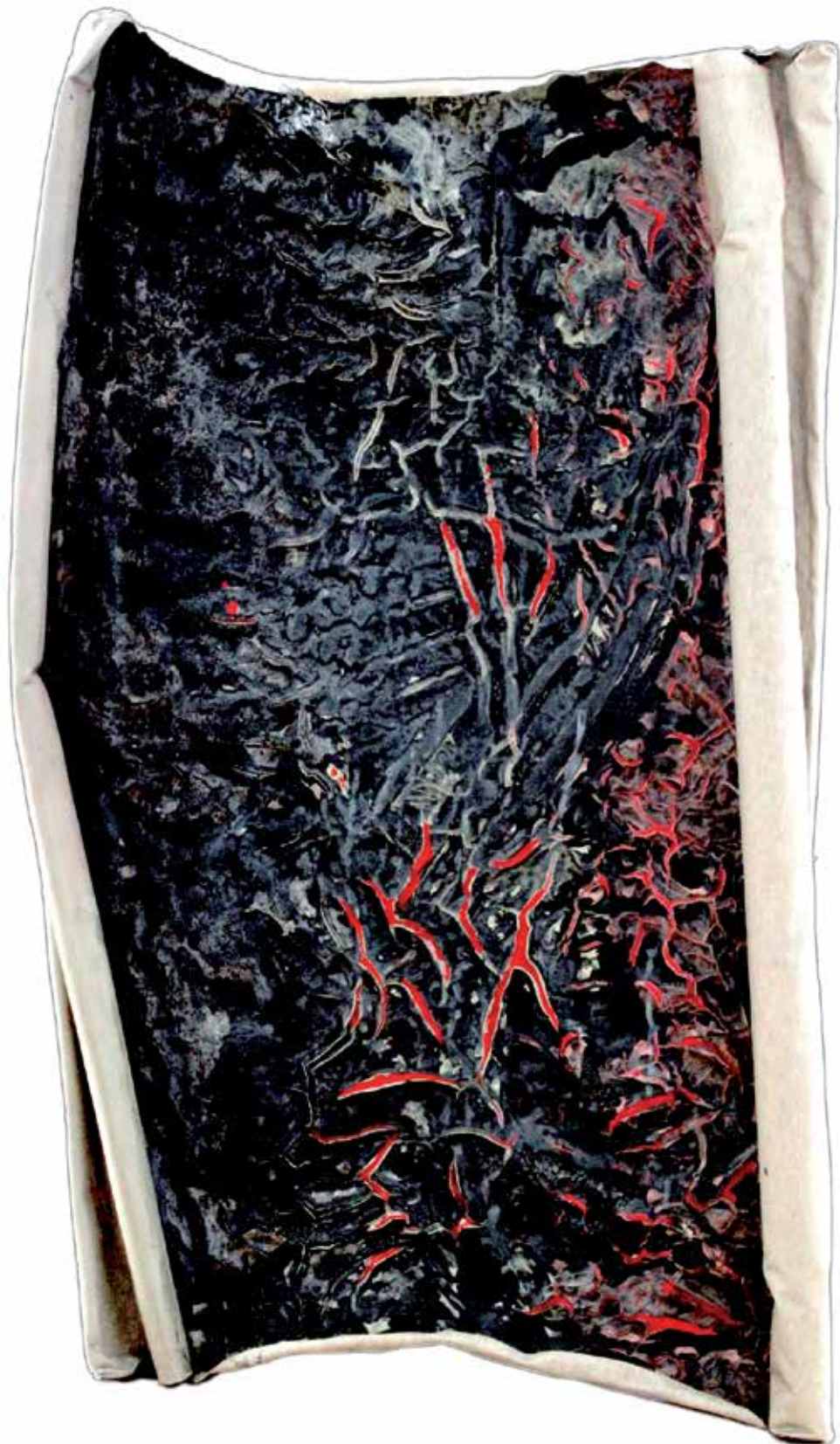
26. Telurska obljava, 2023, mešana tehnika, platno, 100 × 70 cm Zdravko Kokanović – Koki