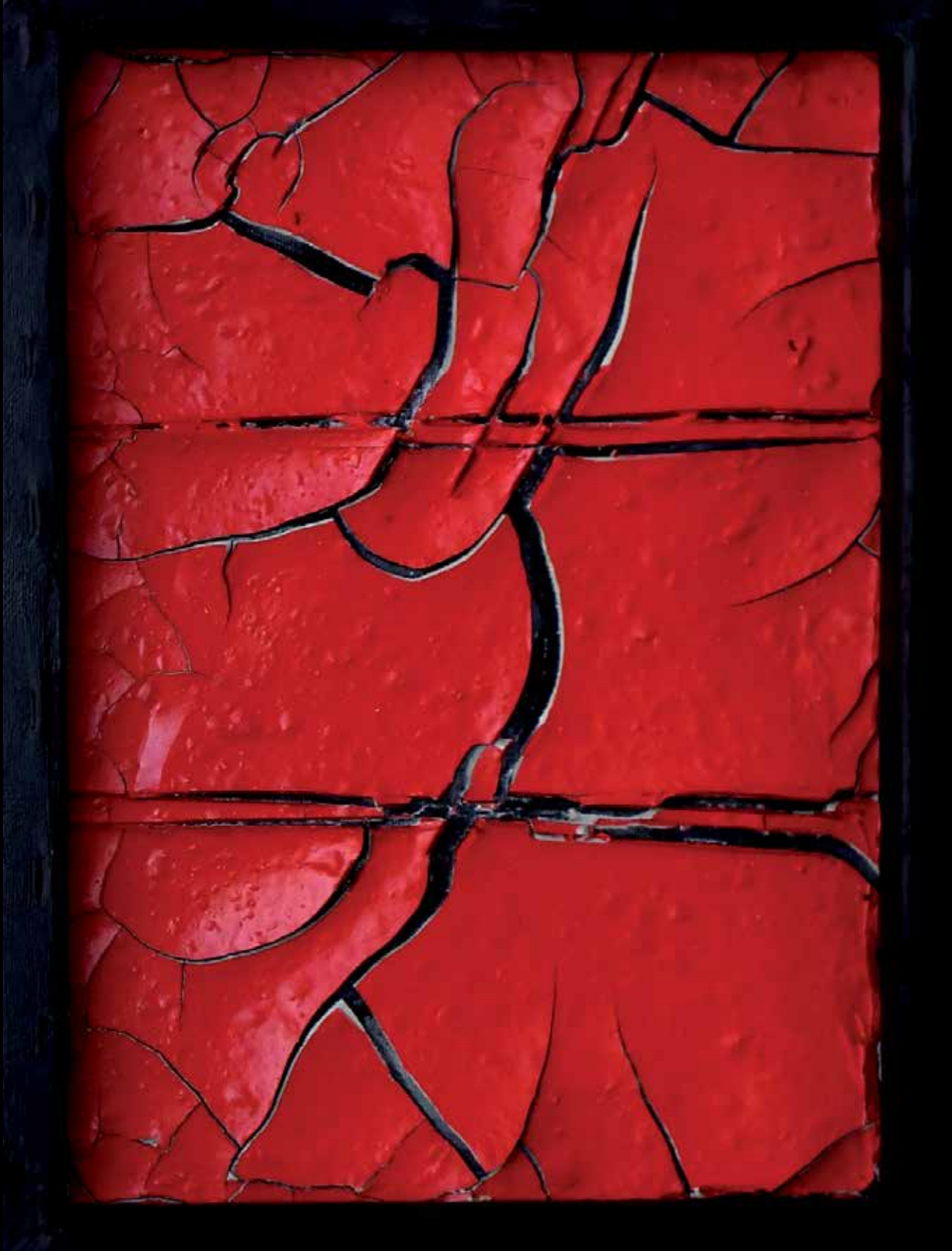
27. Monolog v dvoje / diptih, 2023, mešane tehnike, vsaka 40 × 30 cm