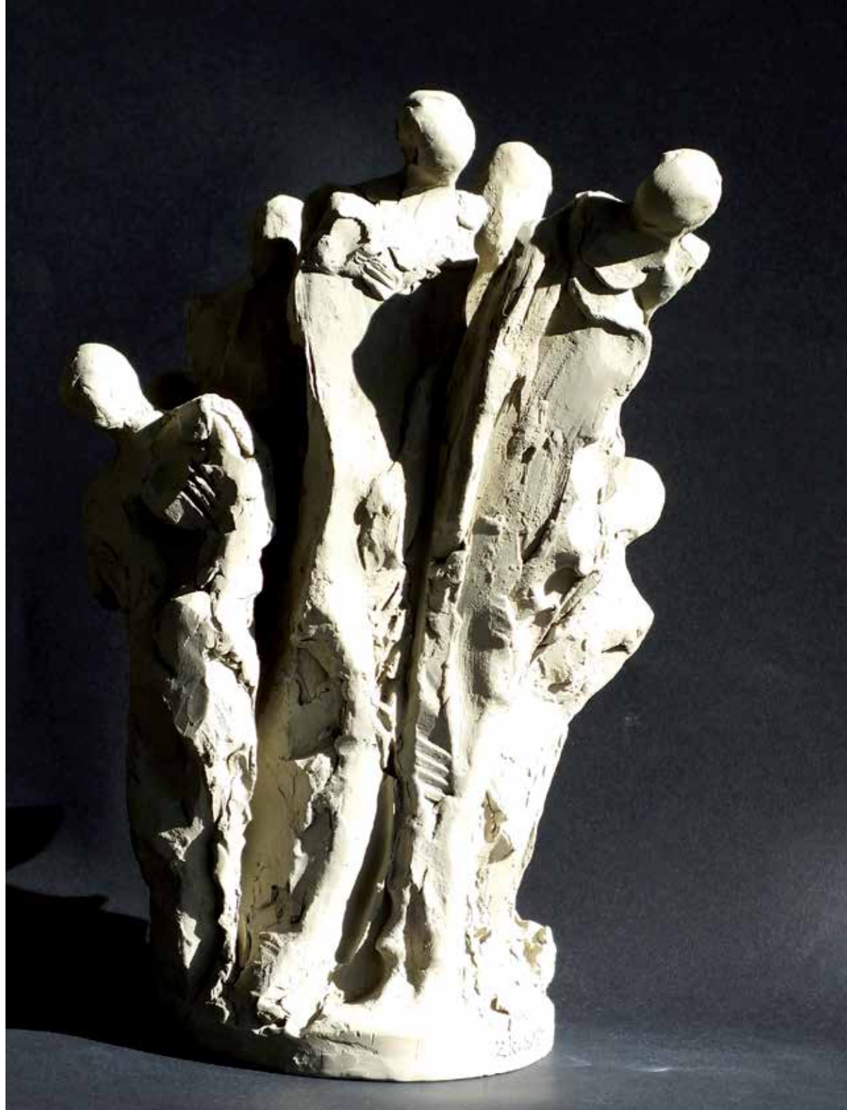
19. Skupina, 2023, glina, 27 × 19 × 14 cm