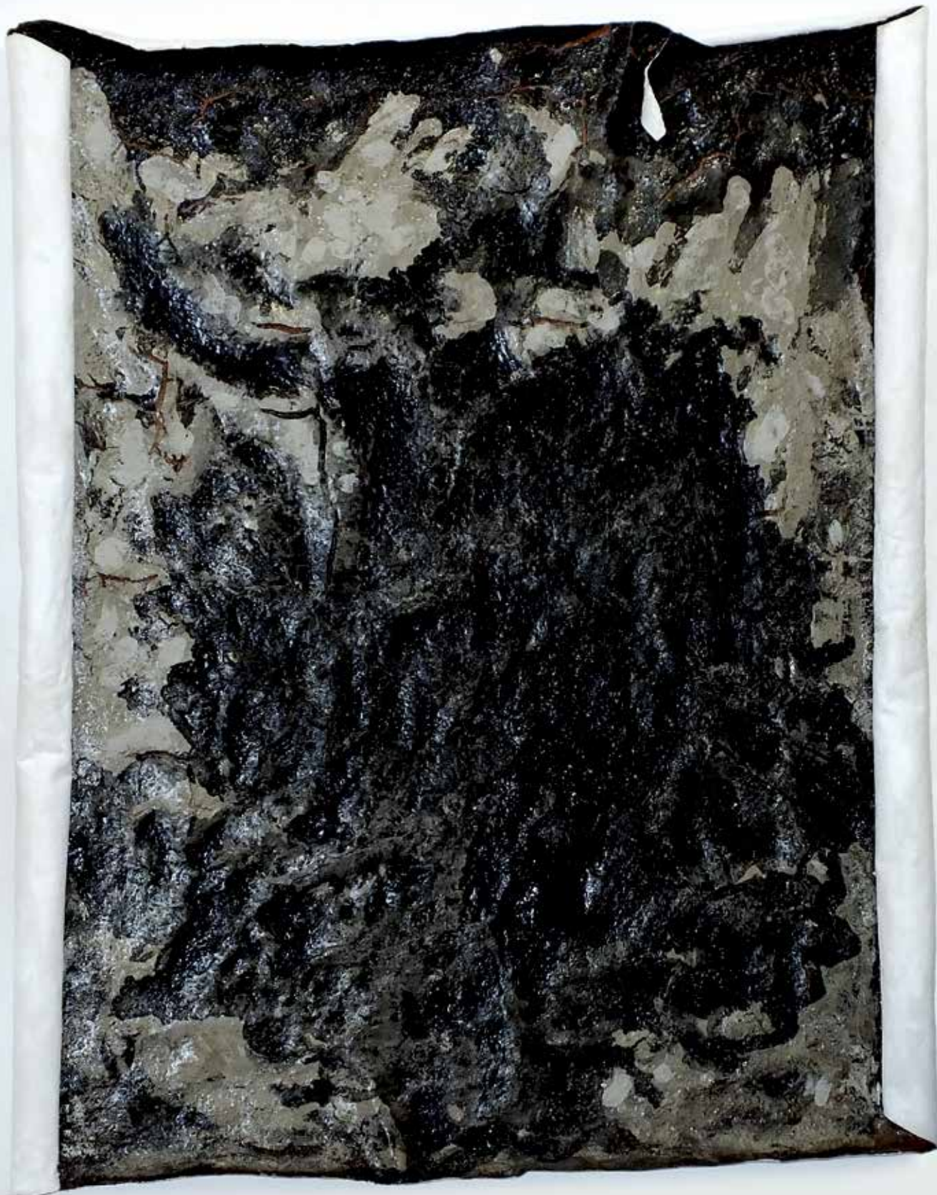
25. Stara platana, 2023, mešana tehnika, platno, 100 × 80 cm