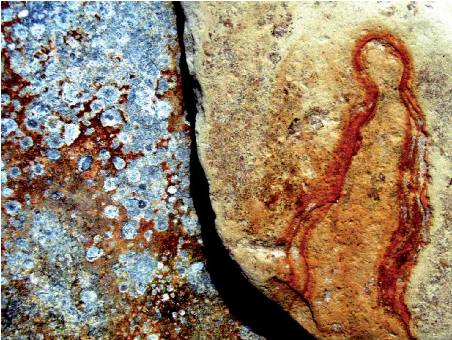
5. Okamenela slika, fotografija, 2010, 30 × 40 cm