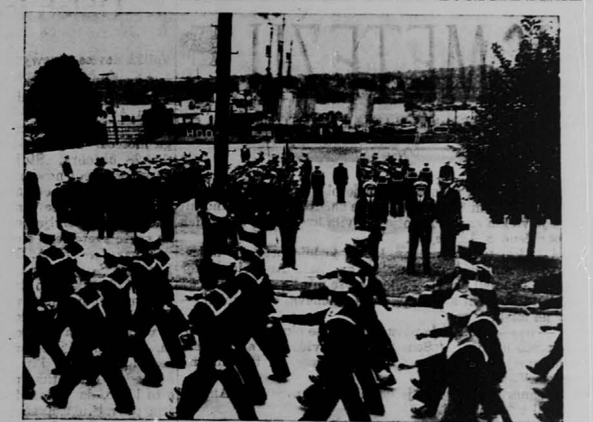
Kanadski mornarji korakajo pred generalnim guvernerjem Kanade earlom Athlone v nekem kanadskem pristanišču. Z guvernerjem so visoki mornariški častniki. — Earl of Athlone je sedaj na obisku pri predsedniku Rooseveltu v Hyde Park, N. Y.