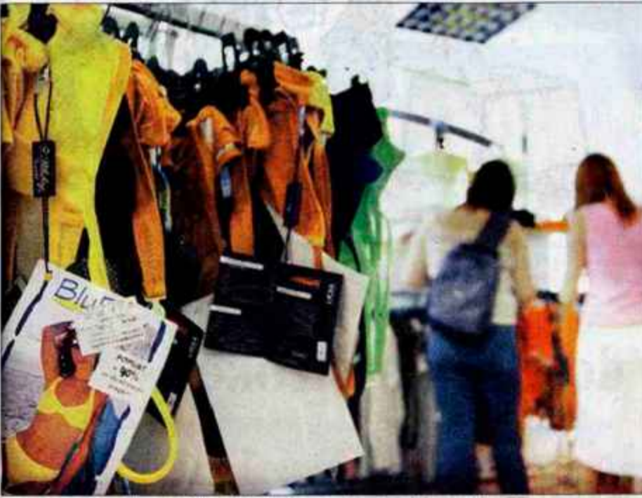
Po evropskem pravilniku na tekstilnih izdelkih niso več obvezne oznake za vzdrževanje.

Na tekstilnih izdelkih niso več obvezne oznake za vzdrževanje. Bo zaradi tega več reklamacij?