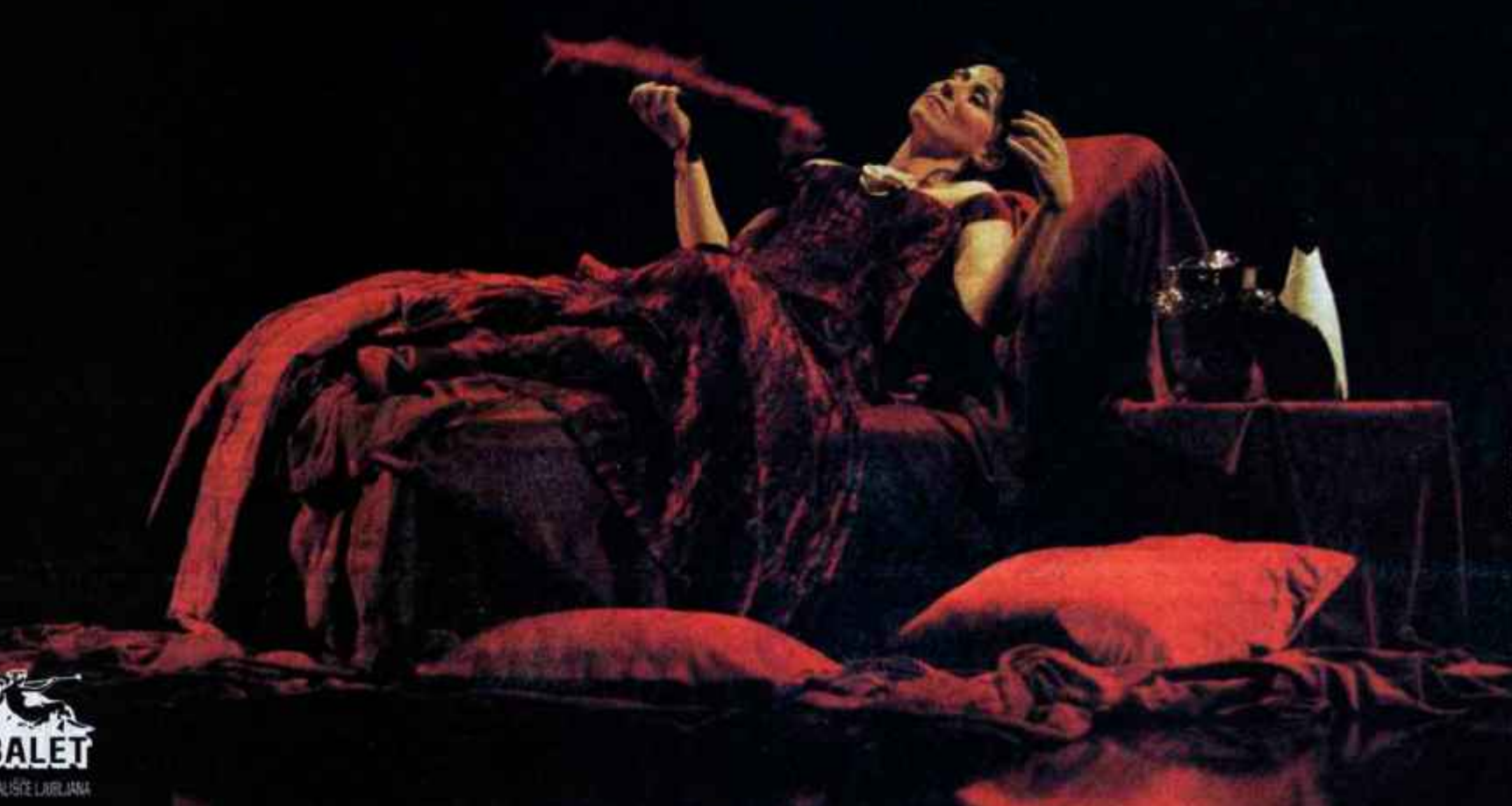
Oglas: Miroslav Štam