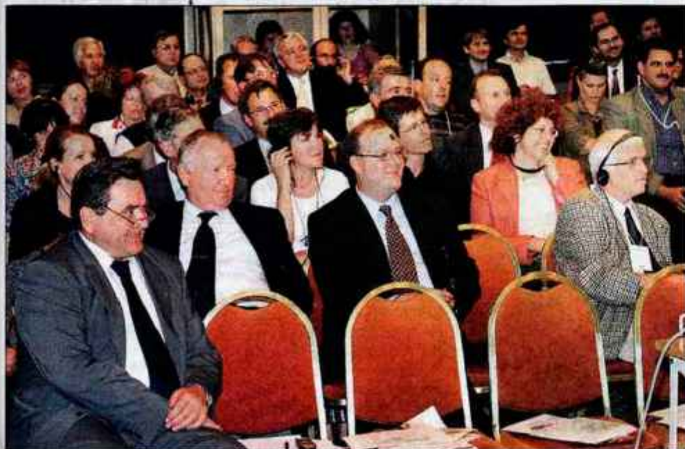
Blejskega foruma se je udeležila dobra stotnja Gorenjskih gospodarstvenikov, predstavnikov blejske občine in turističnih delavcev.

Po drugi strani pa se bomo morali čimprej ovesti, da poleg pravic obstajajo tudi dolžnosti in da ne more vsak odločati prav o vsem. Prisluhniti drug drugemu da, zahtevati strokovno podprte razvojne projekte tudi, potem pa morajo taki projekti dobiti priložnost in pretehtati nad neargumentiranim pljuvanjem kar tako počez. Seveda pa se mora pljuvanje najprej nehati med politiki, ki "navadnim" državljanom s potoki gnojnice in podžiganji k državljanjski nepokorščini niso nikakršen zgled. In če se že res pripelje kakšna slaba rešitev, ni res, da se pravna pot ne splača. Je zahtevnejša kot ulični transparenti in zmerljivke, vendar je civilizacijska in pravičnejša. Deponijo Tenetiše se bo kranjska Komunalna trudila širiti stran od Mlake