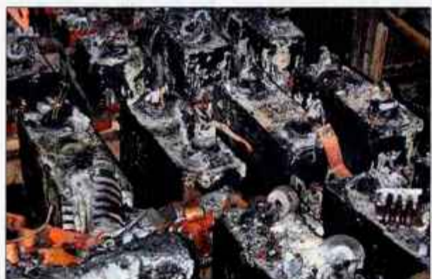
Razdejana transformatorska postaja v Hladni valjarni.

Na petkilovoltni razdelilni postaji s kompenzacijsko napravo je po prvi oceni po besedah