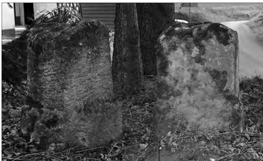
Slika 6: Mejni kamen med Štajersko in Ogrsko, domnevno postavljen leta 1754, ki danes stoji na meji med občinama Ljutomer in Razkrižje (oziroma med KO Globoka in Veščica) vzhodno od naselja Stročja vas (ob hiši z naslovom Veščica 33) – levo: ploskev mejnega kamna, obrnjena proti Občini Ljutomer (KO Globoka), desno: ploskev mejnega kamna, obrnjena proti Občini Razkrižje (KO Veščica).