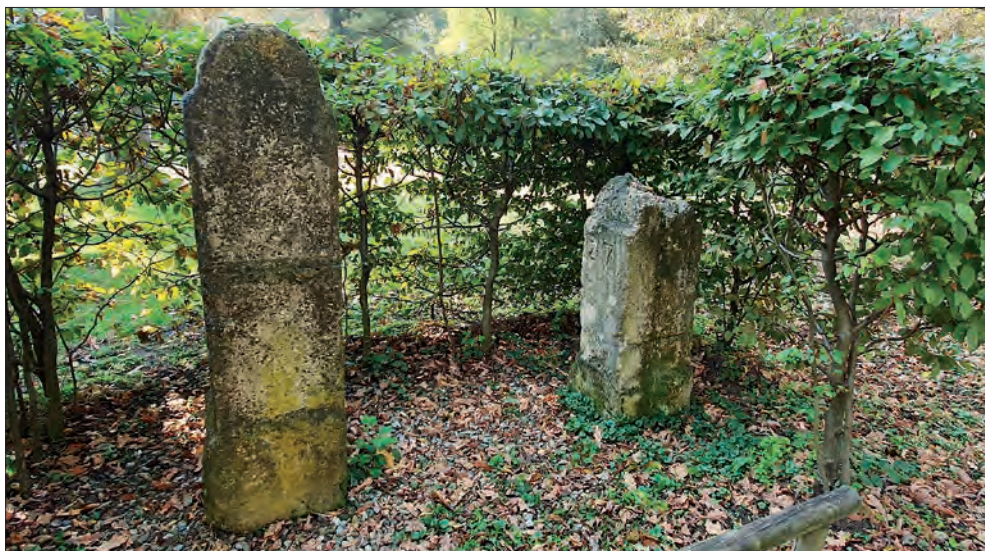
Slika 7: Mejna kamna med Štajersko in Ogrsko z letnico 1754, ki danes stojita v parku pri gradu v Beltincih. Prvotna lokacija mejnih kamnov ni znana, pred grajsko stavbo pa naj bi bila postavljena leta 1994. 49 Levi mejni kamen je visok približno dva metra, od tega ga je bilo več kot polovica zakopanega v tla. Pri desnem mejnem kamnu je na stranski ploskvi vidna številna oznaka 27, levi mejni kamen pa ima na stranski ploskvi številsko oznako 20.

Avstrije natančnejši in z več podrobnostmi. 50 Razlikujeta se tudi izrisa mejne črte. Na sliki 2 vidimo, da je deželna meja, ki danes predstavlja mejo med občinama Ljutomer in Razkrižje, v okviru izmere Kraljevine Ogrske izrisana zelo premočrtno, medtem ko v okviru izmere dežel Notranje Avstrije sledi reliefnim značilnostim potoka, ki je predstavljal mejo; posledično se slednja veliko bolj ujema s sodobno občinsko (in tudi katastrsko) mejo. Ob potoku so ohranjeni mejni kamni z letnico 1754 (slika 2), torej iz obdobja, ko so prvič natančneje »zakoličili« mejo, ter mejni kamni z letnico 1912, ko je bila tudi izvedena izmera meje 51 (slika 8).