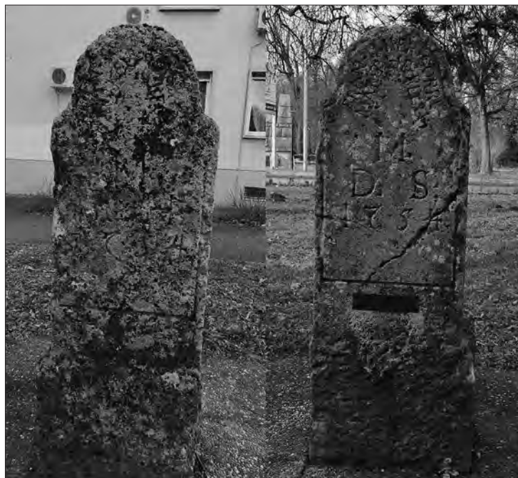
Slika 5: Mejni kamen med Štajersko in Ogrsko z letnico 1754, ki danes stoji v Ljutomeru pred poslopjem okrajnega sodišča. Prvotno je stal v bližini naselja Mota, 46 na današnje mesto pa je bil postavljen leta 2002 47 – levo: ploskev mejnega kamna, ki je bila obrnjena proti nekdanji Ogrski, desno: ploskev mejnega kamna, ki je obrnjena proti nekdanji Štajerski. Na ploskvi, obrnjeni proti Štajerski, so nad letnico zapisane črke M. D. S. (Meta Ducatus Styriae 48 oz. konec Vojvodine Štajerske).