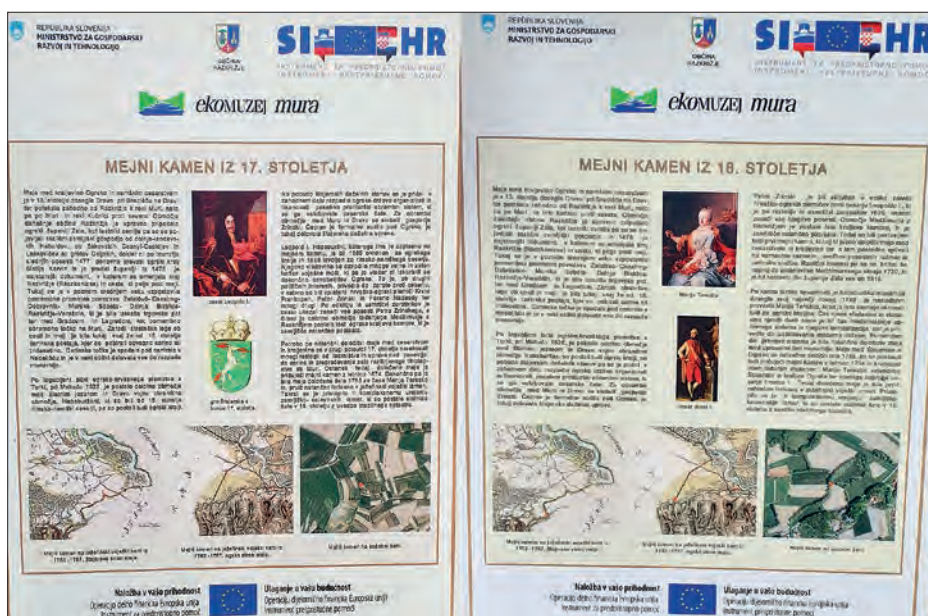
Slika 9: Razlagalni tabli ob mejnikih na nekdanji štajersko-ogrski meji – levo: razlagalna tabla za mejnik na sliki 3, desno: razlagalna tabla za mejnik na sliki 4 (foto: Matija Zorn).

Danes mejna linija na tem odseku ostaja državna meja med republikama Slovenijo in Hrvaško, ki pa zaradi še vedno nedorečene meje med državama 56 še ni »dobila« mejnih kamnov. Na tem odseku so bili tako mejni kamni, ki so razmejevali Štajersko in Ogrsko, do nedavne postavitve žičnih ograj 57 edine mejne oznake med državama.