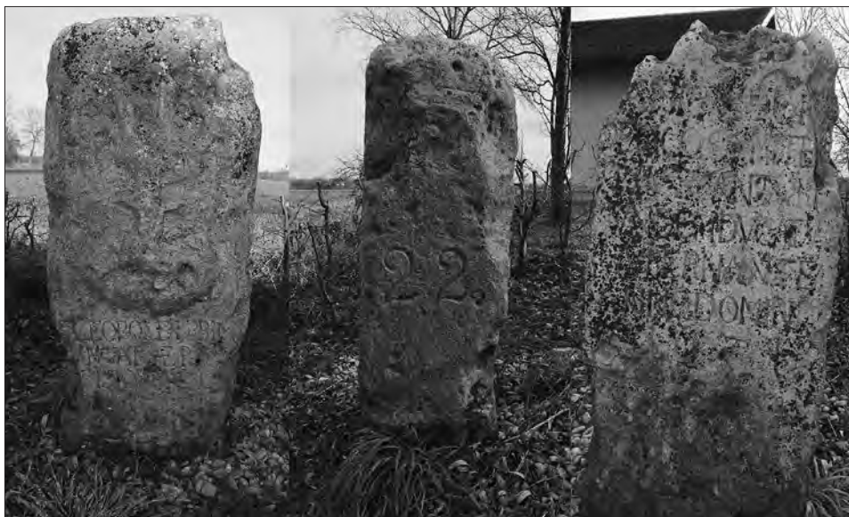
Slika 3: Mejni kamen med Štajersko in Ogrsko z letnico 1674, ki danes stoji na meji med občinama Ljutomer in Razkrižje (oziroma med KO Pristava in Veščica) severovzhodno od naselja Pristava (pri hiši z naslovom Veščica 39) – levo: ploskev mejnega kamna, obrnjena proti nekdanji Ogrski oziroma danes Občini Razkrižje (KO Veščica), sredina: na stranski ploskvi mejnega kamna je lepo vidna številka 22, desno: ploskev mejnega kamna, obrnjena proti nekdanji Štajerski oziroma danes Občini Ljutomer (KO Pristava). Mejni kamen je visok 120 cm, širok po daljši stranici 45 cm in krajši stranici 30 cm. 42 Mejnik je vpisan v Register kulturne dediščine pod evidenčno številko 20001.