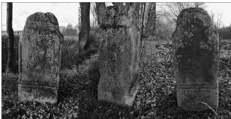
Slika 4: Mejni kamen med Štajersko in Ogrsko z letnico 1754, ki danes stoji na meji med občinama Ljutomer in Razkrižje (oziroma med KO Stročja vas in Veščica) vzhodno od naselja Stročja vas (severno od hiše z naslovom Veščica 33b) – levo: ploskev mejnega kamna, obrnjena proti nekdanji Ogrski oziroma danes Občini Razkrižje (KO Veščica), sredina: na stranski ploskvi mejnega kamna je lepo vidna številka 5, desno: ploskev mejnega kamna, obrnjena proti nekdanji Štajerski oziroma danes Občini Ljutomer (KO Stročja vas). Mejni kamen je visok 88 cm, 43 širok po daljši stranici 44 cm in krajši stranici 32 cm. 44 Na ploskvi, obrnjeni proti Ogrski, so nad letnico zapisane črke M. R. H. (Meta Regni Hungariae 45 oz. konec Kraljevine Ogrske). Mejnik je vpisan v Register kulturne dediščine pod evidenčno številko 20002.