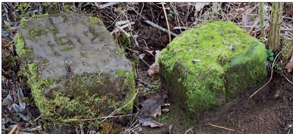
Slika 8: Mejna kamna med Štajersko in Ogrsko z letnico 1912, ki danes stojita na meji med občinama Ljutomer in Razkrižje (oziroma med KO Pristava in Veščica) jugovzhodno od naselja Pristava.