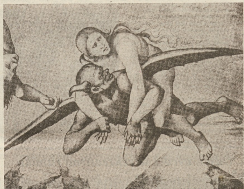
Luca Signorelli: Hudič in nesrečnica. S freske v katedrali v Orvietu

Hudiči se nam smejejo s stenskih slik in platen v številnih cerkvah. Nahajamo ga na Michelangelovi Vesoljski sodbi in Sikstinski kapeli in sliki svetega Mihaela, ki je stopil na vrat zli hudu; delo slikarja Guida Renija je na ogled v kapucinski cerkvi.