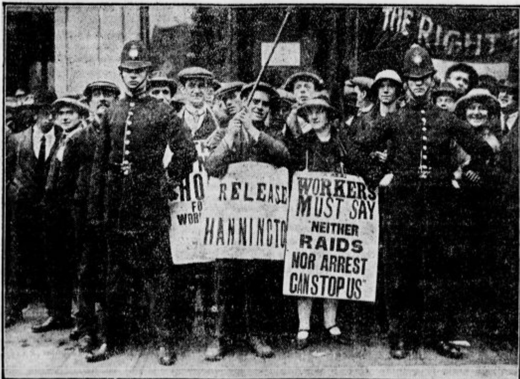
Komunistična demonstracija v Londonu.

Carinski dohodki. V prvi desetini meseca oktobra so znašali dohodki glavnih carinarnic 75.602.581 dinarjev.