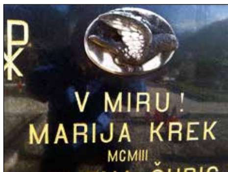
Nagrobni spomenik materi Mariji Krek na selškem pokopališču na vzhodni strani obzidja.

Ljubi sveti Miklavž, smrtnega sila viharja burno ob čolnič udarja – bodi mi ti za krmarja, v pristan ga vodi zvesto!