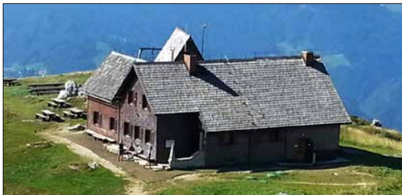
Ratitovec, Krekova koča.

jevoljno godrnjal: 'No tako, sedaj pa imaš! Kako pa sedaj naprej, kako bova našla izhod?' Krek je mirno počepnil na skali, vzel cigaro, jo svečano prirezal in prižgal ter brezskrbno izjavil: 'O, ga bova že našla! Oziroma ti ga boš našel, preden bom jaz to cigareto pokadil. Le kar išči, saj veš, kdor išče, ta najde.' Kaj mi je preostalo drugega, kot da sem našel izhod."