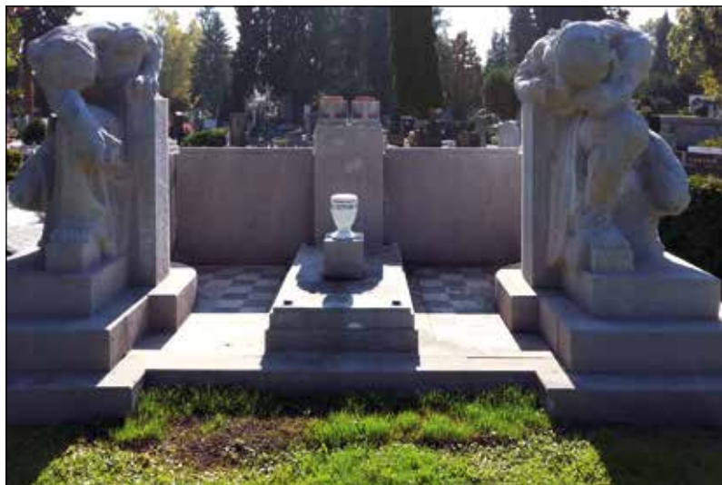
Grob dr. Janeza Evangelista Kreka na Žalah v Ljubljani.

Ta črni praznik, ki nam je dal dovolj solza bridkosti in očiščenja, nam je obenem dodelil posebno dragocen dar: vrnil nam je spoznanje, ki nam je bilo v teh časih že skoraj izgubljeno, da more obroditi sočen sad le tisto delo, ki je bilo spočeto in izvršeno v čisti poštenosti. Vsako delo, ki je vzklilo iz kalne misli, je ob rojstvu mrtvo. Krek je dokazal z vsem svojim življenjem, da je laž tista beseda o dvojni morali, temveč da je morala povsod in vselej samo ena, doma za pečjo, na očitni cesti, na razburkanem shodu, na zaupnem sestanku in v državnem zboru. Dokazal je, da poštenost ni sukinja, ki se jo v prednji sobi da zamenjati za svetli frak sebičnosti. Narod je kakor otrok: brez dolgega premišljevanja in brez omahovanja sprevidi bistvo, občuti brž, kdo mu daje in kdo mu jemlje. Zato so vroče, naravnost iz srca privrele solze ob grobu moža, ki je dal svojemu narodu vse in edino, kar je imel: svoje življenje.