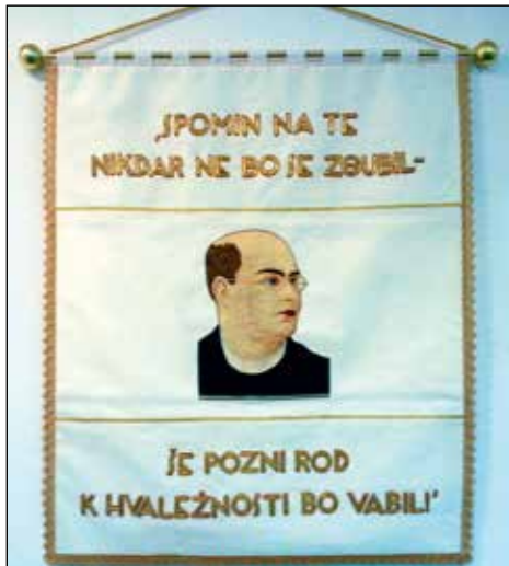
Bandera selških fantov, posvečena Kreku, narejena v tridesetih letih 20. stoletja.