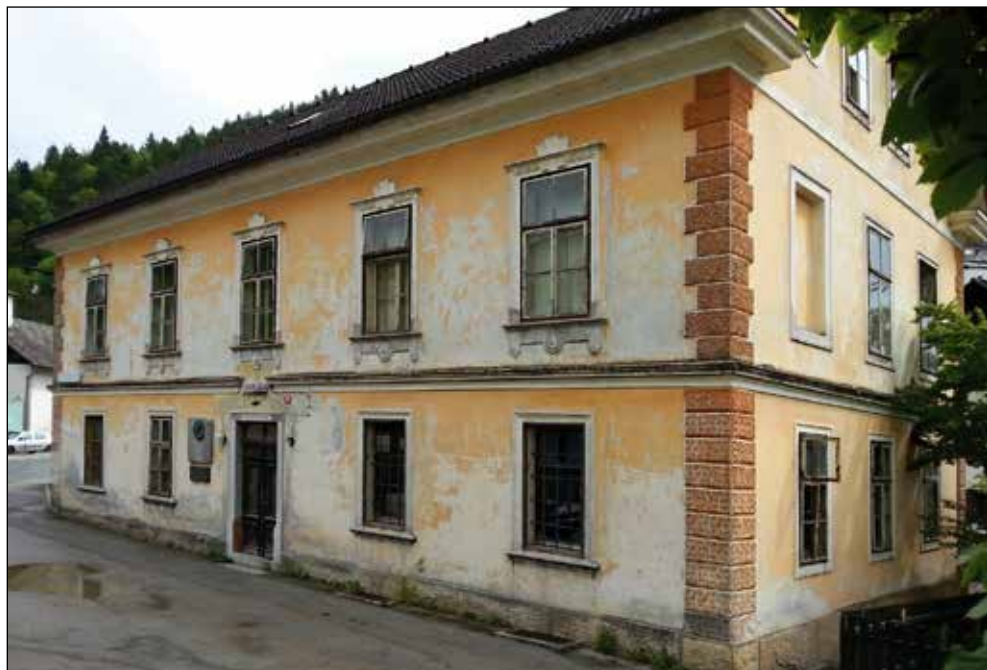
Krekov dom v Selčih, ki stoji na istem mestu, kjer je stala hiša v Štoku. Od ustanovitve leta 1908 do 1922 je bil Selški dom, nato do konca druge svetovne vojne Krekov dom. Po vojni se je preimenoval v Mladinski dom do leta 1979, nato pa je spet Krekov dom.