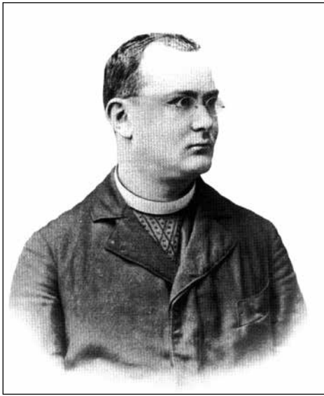
Dr. Janez Evangelist Krek, fotografija iz leta 1895.

vse naše hribe in se družil z domačini ter dnevno maševal v domači cerkvi svetega Petra ali pa tudi na kaki podružnici.