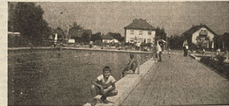
Odprto kopališče v Radencih

Prekmurje partizani in Prekmurci vstopajo v Lackov odred. Razvijajo se boji tudi v Prekmurju, ki trajajo ves čas do osvoboditve. Okupator je zapiral