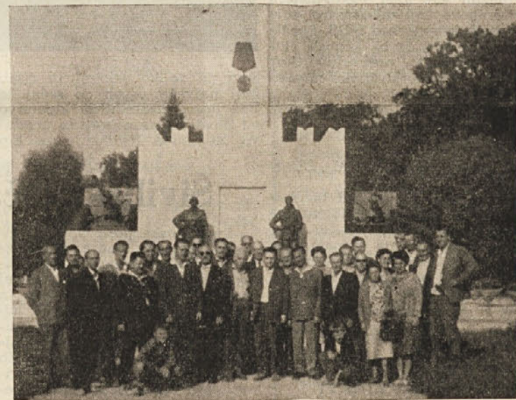
Udeleženci izleta pred spomenikom svobode v Soboti

6. aprila 1941 so Nemci napadli in Prekmurje je padlo brez boja. Nemci so po Prekmurju pobrali vse materialne dobrine in ga 16. aprila prepustili Madžarom, ki so bili zelo hladno sprejeti. 15. maja 1941 je bil zgodovinski sestanek članov okrožnega komiteja KPS, na katerem so bili prisotni Stefan Kovač, Miško Kranjec in Rudi Čičinovič, na katerem so odbili zahtevo Hartnerja o sodelovanju ali nevtralnosti Partije v Prekmurju. Meseca junija 1941 je bil sestanek članov KPS, na katerem so si razdelili delo za organiziranje OF. 22. julija so Madžari aretirali prve aktiviste OF v Murski Soboti in po Prekmurju. Skupno so Madžari obtožili 91 ljudi. Julija so se začele sabotažne akcije na prometnih zvezah in požiganje žita Madžarom. Septembra so bile spet aretacije aktivistov OF v Soboti, Rankovcih in Gornjih Petrovcih, oktobra pa je bil usodni sestanek PK KPS za Prekmurje, padel je sekretar Stefan Kovač,