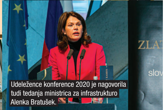
Udeležence konference 2020 je nagovorila tudi tedanja ministrica za infrastrukturo Alenka Bratušek.