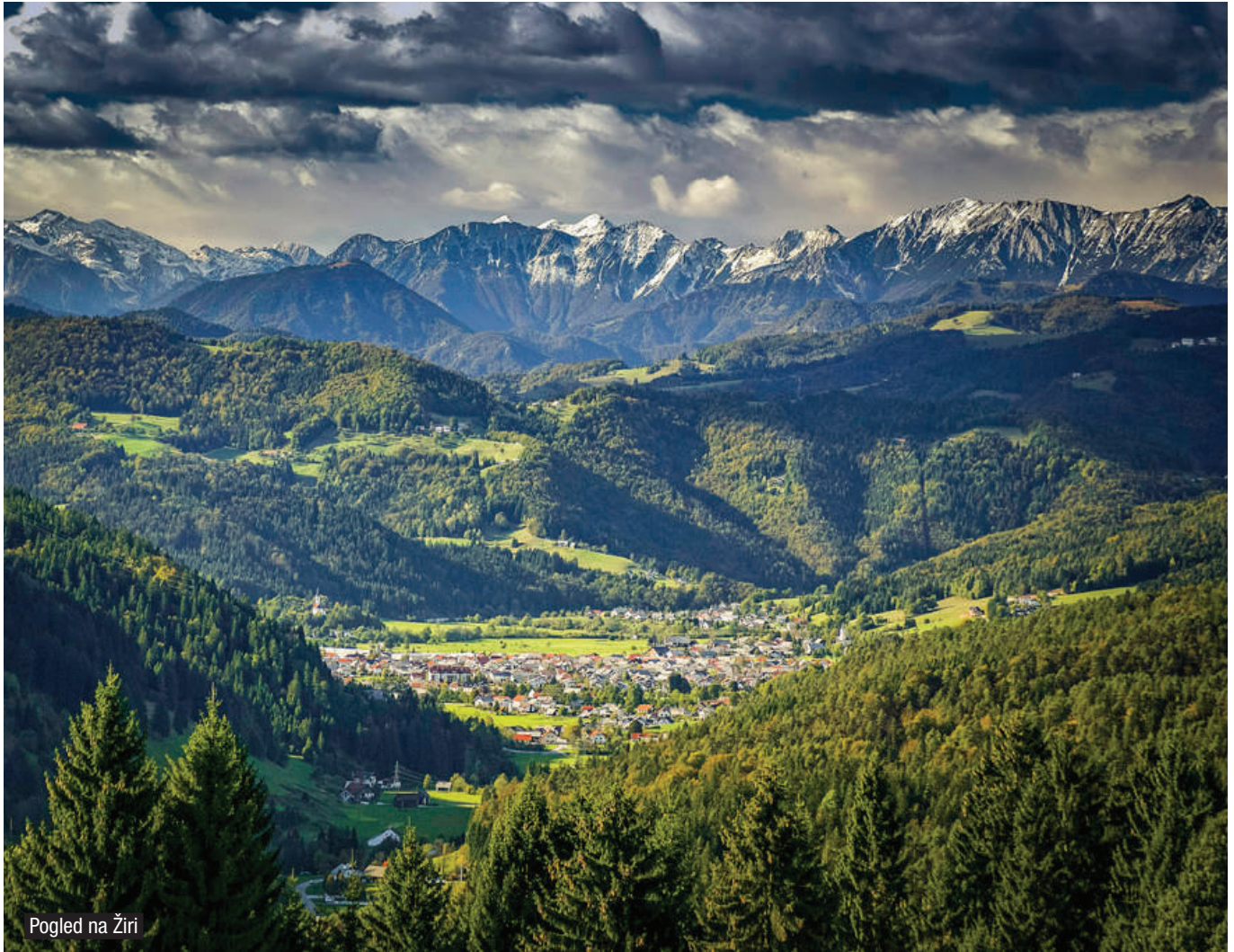
Pogled na Žiri

Verjetno se nismo zmotili preveč, če sklepamo, da so dobre (in izboljšujoče se) vrednosti zdravstvenih kazalnikov tudi rezultat sistematičnih prizadevanj za zdrav način življenja v kraju. Ob tem je spekter aktivnosti (širše ali ožje) povezanih z zdravstvom v Žireh dovolj širok, pri tem pa ne pozabljajo posebej ranljivih skupin.