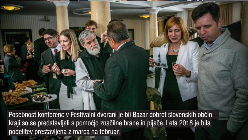
Posebnost konferenc v Festivalni dvorani je bil Bazar dobrot slovenskih občin – kraji so se predstavljali s pomočjo značilne hrane in pijače. Leta 2018 je bila podelitev prestavljena z marca na februar.