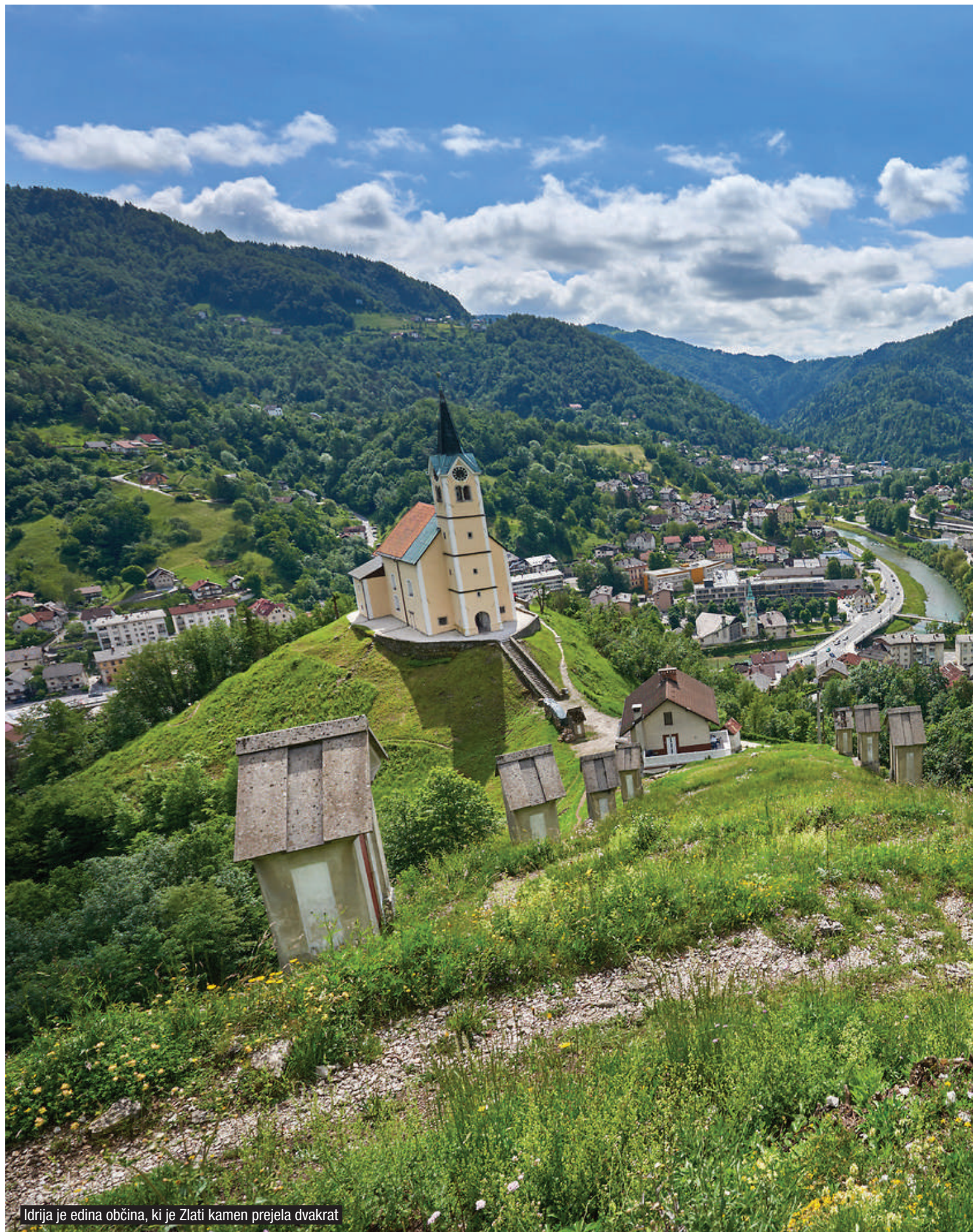
Idrija je edina občina, ki je Zlati kamen prejela dvakrat