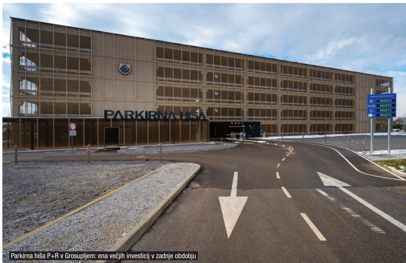
Parkirna hiša P+R v Grosupljem: ena večjih investicij v zadnje obdobju