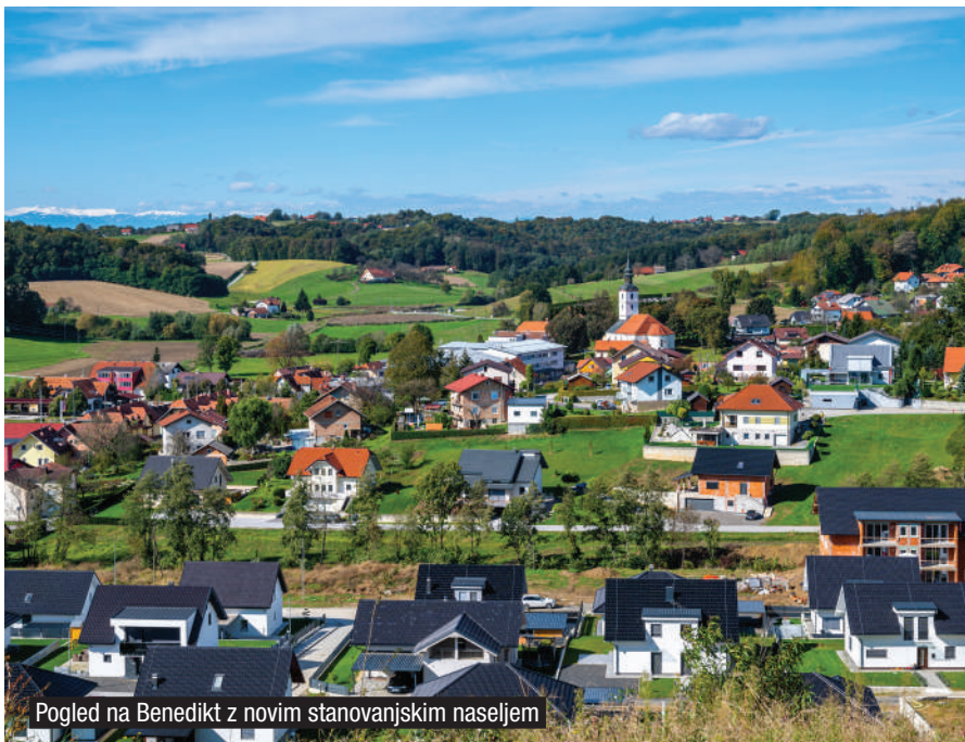
Pogled na Benedikt z novim stanovanjskim naseljem

Zakaj občina Benedikt? Zaradi svojega razvojnega modela je Benedikt postal kraj, ki ima eno od najboljših demografskih situacij v Sloveniji. Ta razvojni model, ki izrazito poudarja kakovost bivanja, vključno z elementi kot sta skrb za okolje in socialno kohezijo je pripeljal do merljivih uspehov. V petih letih je Benedikt glede na sestavljeni indeks ISSO napredoval za kar 94 mest. V zadnjem obdobju so model uspešno začeli posnemati tudi v sosednjih krajih (Sveta Trojica in Sveta Ana). Ena od prvin uspeha občine Benedikt je tudi močna usmerjenost v povezovanje. Pri tem se v občini skušajo dosledno ravnati kor pravi evropski državljani.