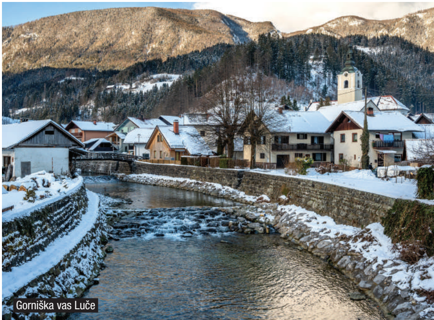
Gornjska vas Luče

Luče so postale prva energetska (vsaj občasno) samooskrbna skupnost v Sloveniji. S tem Luče dosledno sledijo usmeritvi v smeri trajnostnega, zelenega turizma. Kot druga občina v Sloveniji so se Luče vključile v omrežje gornjskih vasi, ki so zavezane k ohranjanju naravne in kulturne dediščine in usmerjene v butični turizem. So primer manjše občine, ki zna svoje omejene danosti preobrniti v razvojne priložnosti in se razvija celovito in kakovostno.