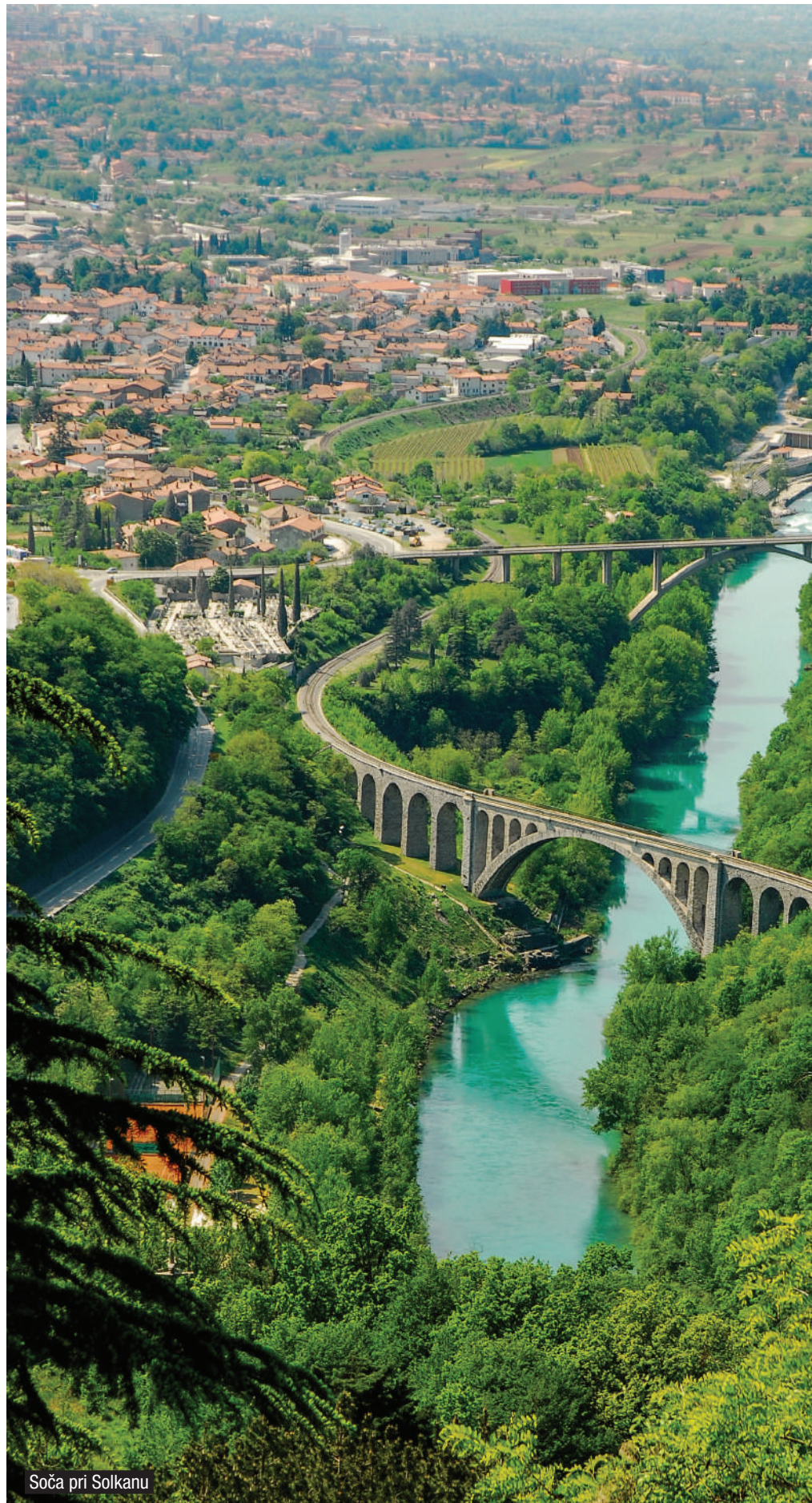
Soča pri Solkanu

Že ob prejšnji kandidaturi smo omenili čezmejni potniški promet, ki povezuje tri mesta v EZTS GO. Omenili smo tudi trg Evropa, ki so ga po letu 2016 dokončno uredili. Trg Evropa je postal iz »nič« turistična atrakcija. Obiskovalci iz cele Italije, iz zahodnega Balkana in celo iz drugih celin prihajajo na trg pred staro železniško postajo, da bi videli »odsotnost meje«. (najmanj smo nad to »odsotnostjo« na trgu Evropa fascinirani prav Slovenci – na trgu je najmanj obiskovalcev prav iz Slovenije). Simbolni pomen trga