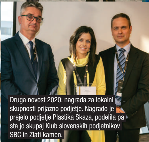
Druga novost 2020: nagrada za lokalni skupnosti prijazno podjetje. Nagrado je prejelo podjetje Plastika Skaza, podelila pa sta jo skupaj Klub slovenskih podjetnikov SBC in Zlati kamen.