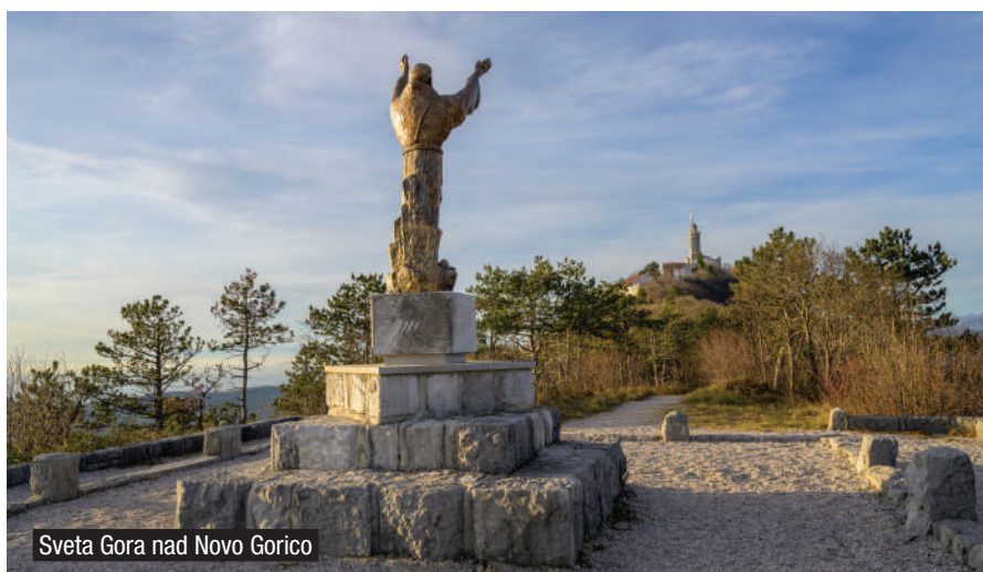
Sveta Gora nad Novo Gorico

presega okvire sodelovanja med Slovenijo in Italijo in ima vseevropski pomen.