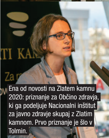
Ena od novosti na Zlatem kamnu 2020: priznanje za Občino zdravja, ki ga podeljuje Nacionalni inštitut za javno zdravje skupaj z Zlatim kamnom. Prvo priznanje je šlo v Tolmin.