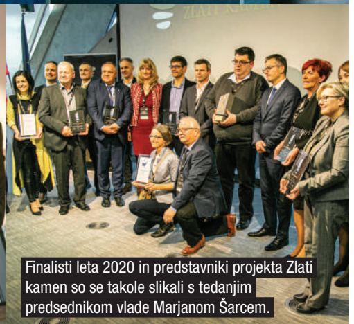
Finalisti leta 2020 in predstavniki projekta Zlati kamen so se takole slikali s tedanjim predsednikom vlade Marjanom Šarcem.