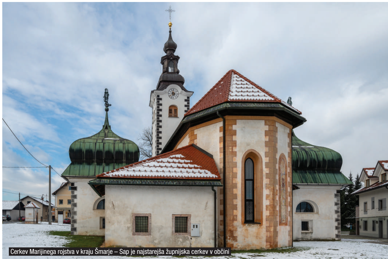
Cerkev Marijinega rojstva v kraju Šmarje – Sap je najstarejša župnijska cerkev v občini