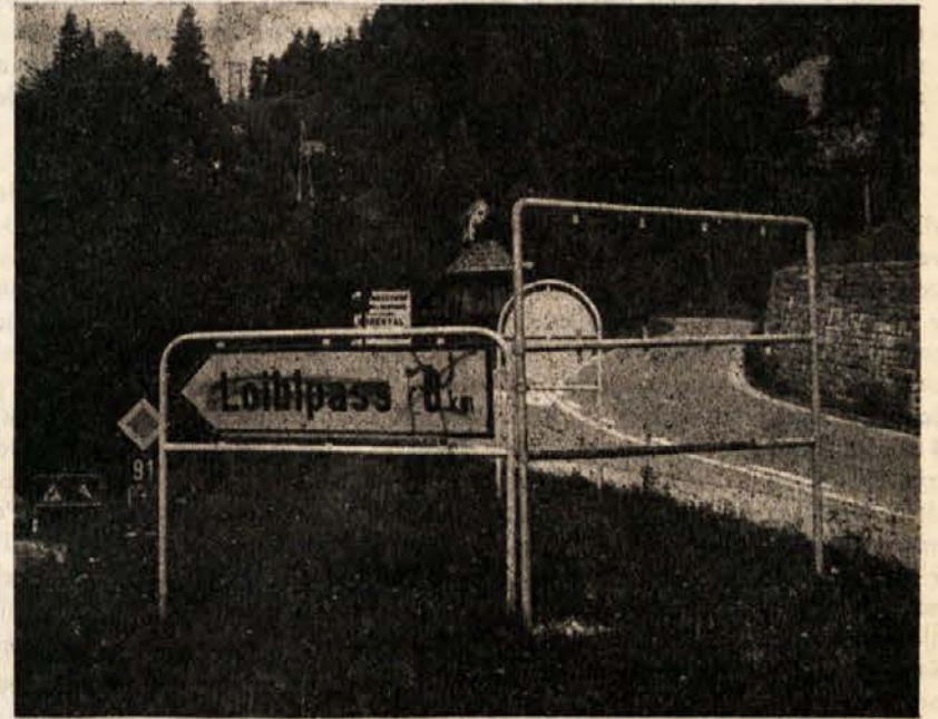
Prečrtan kalipot na Sabotnici na ljubeljki cesti

Resolucija bo prav gotovo vsebovala obsodbo izraelskih terorističnih metod in ker ni pričakovati, da bi bile zahtevane v njej sankcije proti Izraelu, računajo s tem, da bo resolucija podprla tudi zastopnik ZDA. Predstavniki arabskih držav pa slej ko prej zahtevajo učinkovite sankcije proti Izraelu.