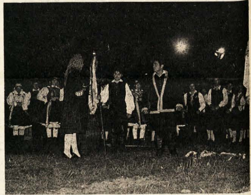
Prizori z Miklovo Zale na zgodovinskih tleh v Svatnah

Slovensko prosvetno društvo „Bjžernica“ v Celovcu vabi na