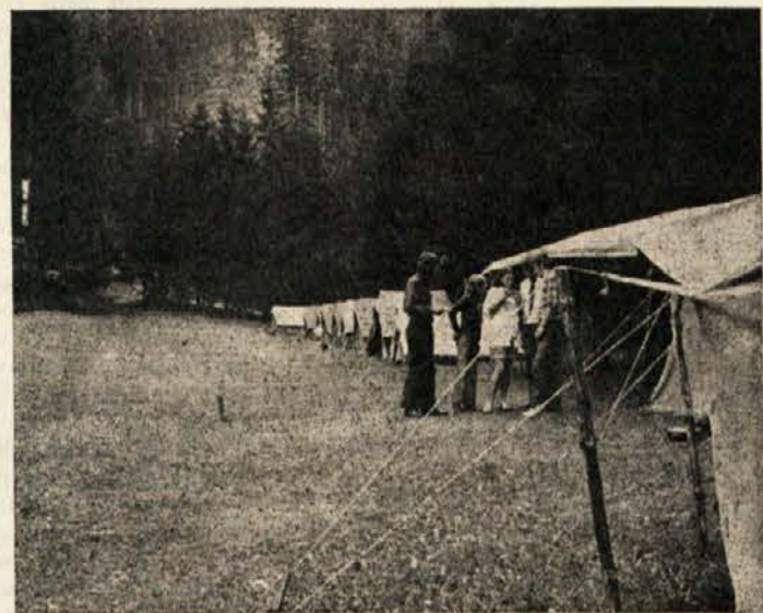
Zveza koroških partizanov vabi na

Mlade slovenske tabornike v Globasnici je na njihovo povabilo obiskal sodelavec našega lista in se z njimi pogovarjal o raznih narodno-političnih vprašanih koroških Slovencev.