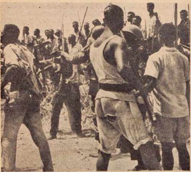
Nemiri med plemeni v Kongu. Kdaj bo konec takih prizorov?

Zaradi izredno zamotanega položaja v Kongu in neenotnosti med članicami Varnostnega sveta, ki so skušale konec prejšnjega tedna na novi seji najti izhod iz zagate, so sklicali za nedeljo izredno zasedanje Generalne skupščine OZN. In to je po burnih nočnih sejah, ki so jih zaključili v ponedeljek ob pol dveh zjutraj (po našem času), sprejelo resolucijo s štiri glavnimi priporočili, po katerih naj potekajo v prihodnje vse akcije OZN v Kongu.