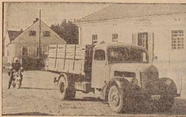
Auto sredi ceste. Kje je voznik? Odgovor: voznikov namestnik amater v gostilni, poklicni šofer pa na lovu

Ob koncu spet spokojniški kršiteljev glas: »Ni mi žal, če me boste kaznovali. Morda me bodo na kazni enkrat vendarle izučile.«