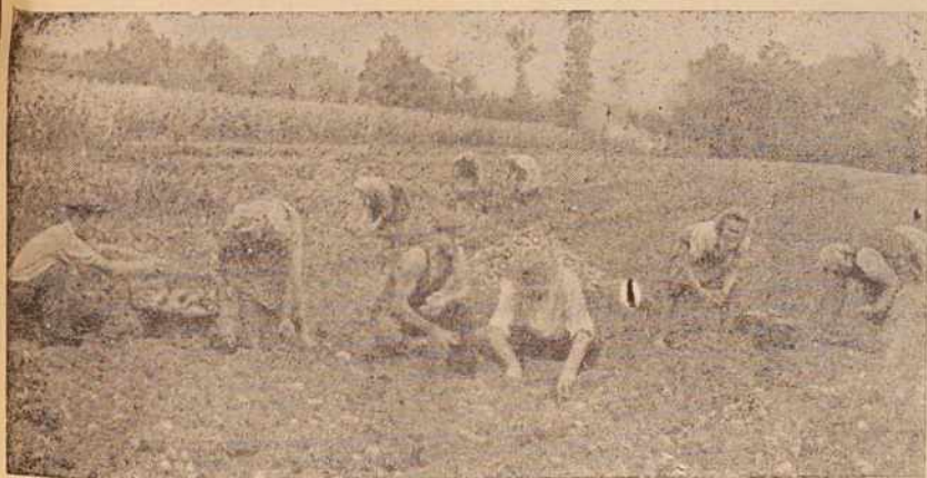
Krompir je letos obilno obradil