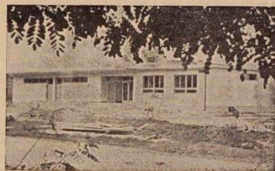
Zadnja dela pri novem obratu v Prosenjakovcih

Pletiljstvo v Prosenjakovcih bo v glavnem izdelovalo cenejše volnene pletenine, za katere je veliko povpraševanje na trgu, kar pokaže tudi dejstvo,