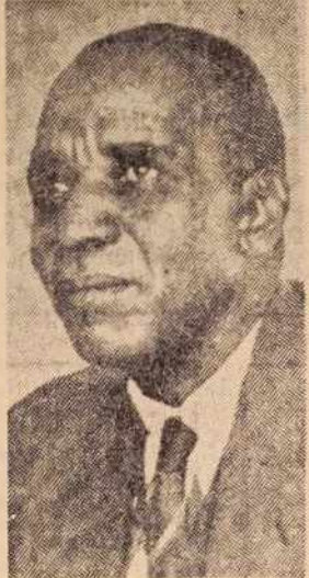
Banda — neodvisnost nad vse

BANDA: »Nikoli. Kolonialne oblasti bi nikoli ne smele imeti kakršnih koli nadzorov