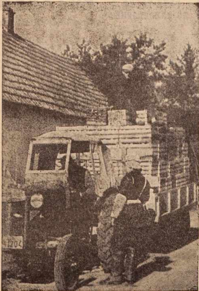
Opomin na petanjskem ovinku: vzvratno ogledalo na nepravem mestu, levi smerokaz na priklopi ne deluje