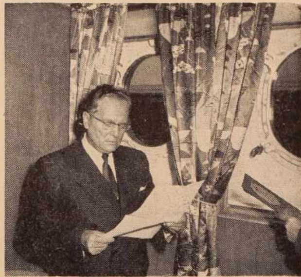
Predsednik Tito v salonu med potovanjem na ladji »Queen Elisabeth«.

Predsednik Tito se je v torek opoldne po jugoslovanskem času izkrcal v New Yorku in sicer kot prvi potnik s transatlantske ladje »Queen