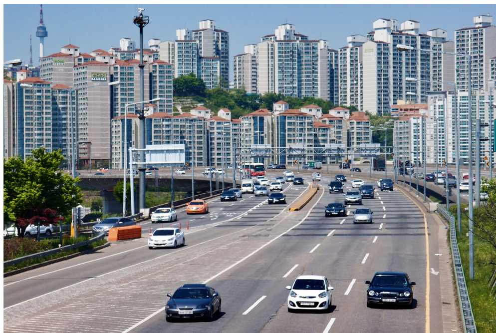
Slika 1. Blokovsko naselje v soseski Geumho 4ga-dong v Seulu

Država je s spodbujanjem samopomoči in skupnostnega povezovanja na začetku sicer skušala izboljšati razmere v revnih soseskah, a se je kmalu osredotočila na njihovo rušenje in gradnjo novih blokovskih naselij (Chang, Nam in Lee 2018). Vendar ne eno ne drugo ni pomembneje pripomoglo k zmanjšanju njihovega števila niti ni izboljšalo dostopnosti stanovanj v mestu (Park 1998). Od konca sedemdesetih let je država pobudo pri zagotavljanju stanovanj zato prepustila trgu, s čimer