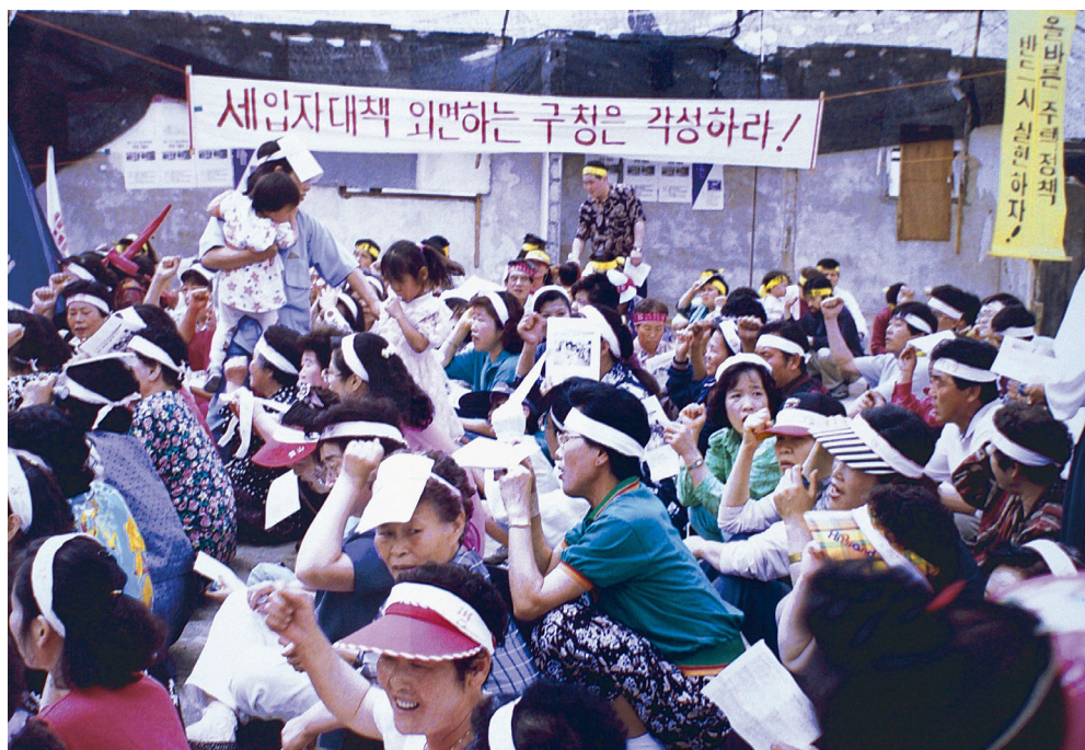
Slika 3. Boj proti nasilnim deložacijam v soseski Haengdang-dong