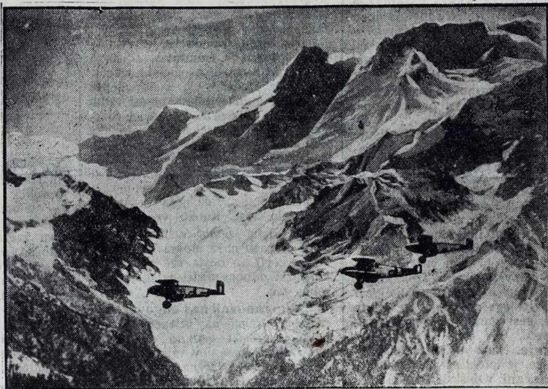
Nemška znanstvena ekspedicija raziskavle najvišišo goro sveta 8884 m visiki Mont Everest v Aziji.

Čehoslovaško republiko sestavljajo različni deli, ki so bili prle pod Austrovogrskov monarhijov. To so: Češka, Moravska, deo Šlezije, slovaški deli Vogrske i Karpatska Rusija. Meri 140.000 km 2 , ma pa blüzi 14 milijonov ljudi, tak da pride na en kvadratni kilometer približno 97 ljudi. Čehoslovaška je med vsemi slovanskimi državami najbole gosto naseljena, ar ma jako razvito industrijo. Glavno mesto Praga se naglo razvija i bo skoro postala milijonsko mesto. Praga je ne samo sedež predsednika republike i vlade, liki je tudi kulturno središče češkoslovaškoga naroda. Prago najbole diči staroslavna univerza, na šteroj predavajo najboši sodobni vučenjaki, tak da je v zadnjem časi praška univerza postanola edna od najboših univerz v Evropi. Češkoslovaška je bogata na rüdaj, zato je tak mogočno razvita industrija, posebno tekstilna industrija; češko blago je znano tudi pri nas, kak jako lepo i trpežno. Tudi polodelstvo je dobro razvito, češki kmet pozna umetno