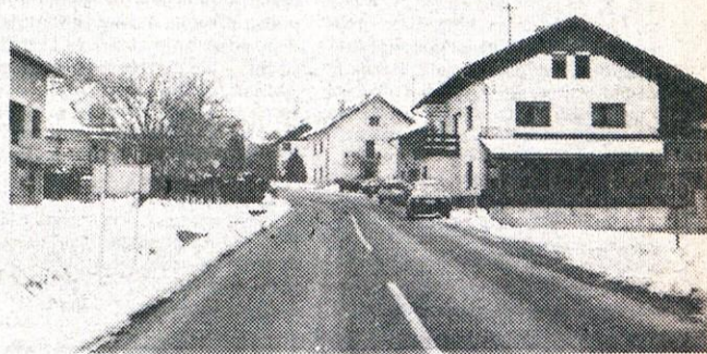
Laze v Tuhinju postajajo središče Tuhinjske doline

za etnološko ustrezno oblikovanje izdelkov in seveda zagotoviti tudi pomoč pri prodaji teh izdelkov.