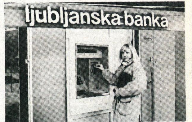
Poslovanje z bančnim avtomatom je preprosto, imetniki tekočih računov so novost z veseljem sprejeli.