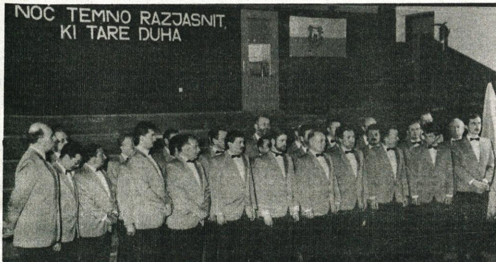
Prvo slovensko pevsko društvo Lira iz Kamnika praznuje letos 110. obletnico obstoja.

Toliko pisanja in besed, kot jih v zadnjem času namenjamu pojmu DEMOKRACIJA, mislim, da ne namenjamu nobeni drugi besedi ali stvari. Čeprav je prav ta demokracija za nas velikega pomena, osebno smatram, da se mora odražati predvsem v našem življenju in ne le v besedah in na papirju. Na pojem demokracija bi stavili vse in vsi izmed nas. Vsi se tudi razglašamo za demokrate. Celotno tisti, ki razen to, da držijo v zrak dva prsta, vedo o tem kaj malo.