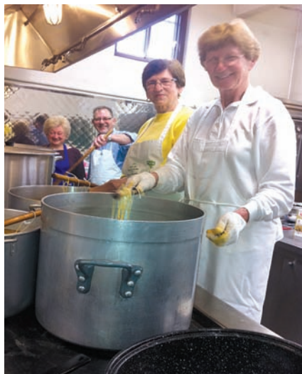
Bujta repa in še marsikaj na kolinah v Montrealu

Rezanci • Kmalu po kolinah, v soboto 23. novembra, smo se spet zbrali v dvorani k skupnemu delu, ki