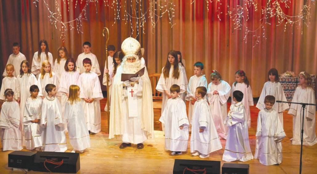
Soeti Miklavž je obiskal otroke tudi v Hamiltonu

v soboto, 16. nov. je bil Lovski banket pri društvu Sava-Breslav in tudi pri društvu Bled-Planica v Beamsville; v nedeljo, 17. nov. je bila sv. maša in kosilo pri društvu Triglav-London ter nato tekmovanje v balinanju; v nedeljo, 24. nov. je bilo objavljeno pismo škofa ob zaključku 'Leta vere', isto nedeljo sta bila sv. maša in kosilo pri društvu Sava-Breslav; v ponedeljek, 25. nov. je bila posebna maša v spomin na pokojne članice Slomšk. oltarnega društva; v nedeljo, 1. dec. je bilo Miklavževanje pri društvu Lipa Park; v sredo, 4. dec. je bilo božično srečanje KŽZ ali CWL; v nedeljo, 8. dec. sta bila kosilo in Miklavževanje v župnijski dvorani; v nedeljo, 15. dec. so pripravili Miklavževanje pri društvu Bled-Beamsville; v torek 17. dec. je bila božičnica društva Sv. Jožefa. Dogajanj je zelo veliko in mnogo še zanimivejšega ni mogoče zapisati, kar ostaja v srcih dobrih ljudi in dobrega Boga.