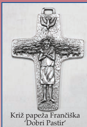
Križ papeža Frančiška 'Dobri Pastir'