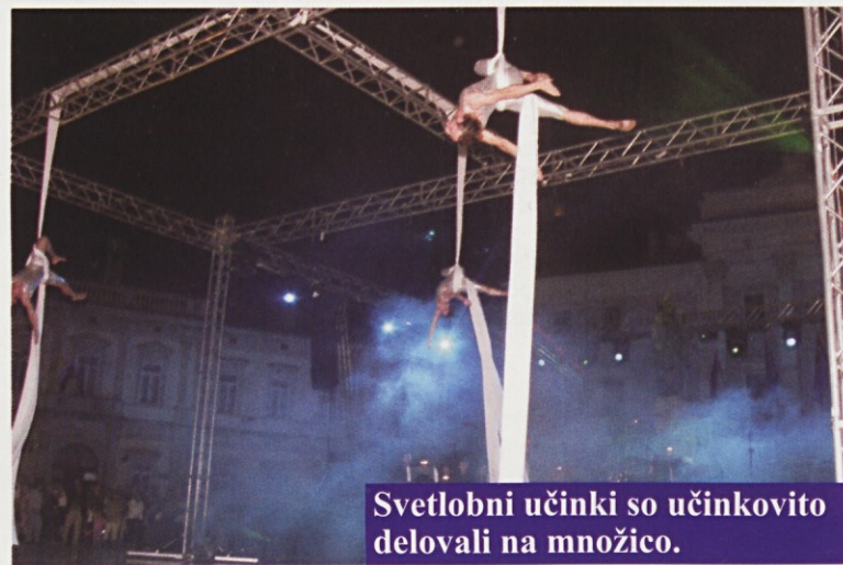
Svetlobni učinki so učinkovito delovali na množico.