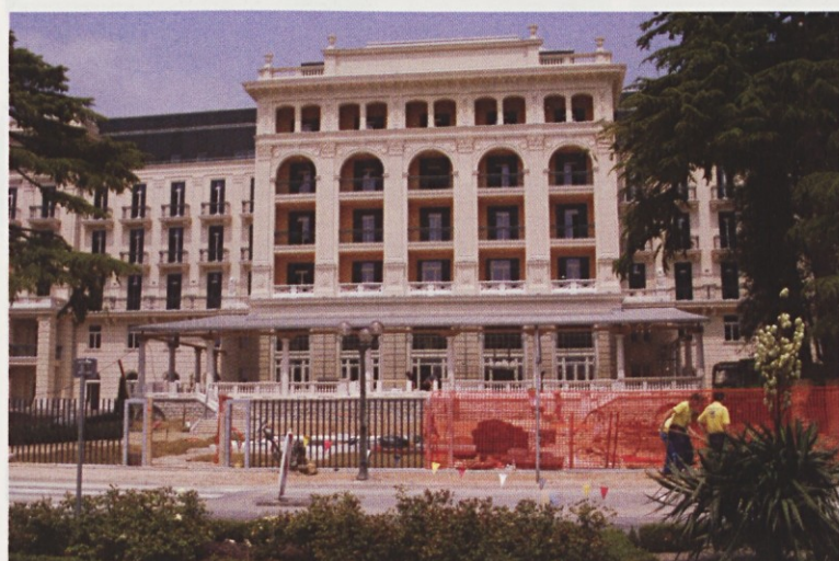
Palace hotel je sedaj v izključni lasti Istrabenza.