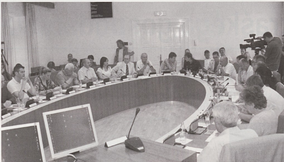
Zadnja seja občinskega sveta v Izoli pred samorazpustom oziroma prenehanjem mandata, 30. 6. 2008. Kot na pogrebu, poslavljanje je bilo dolgo in težko.