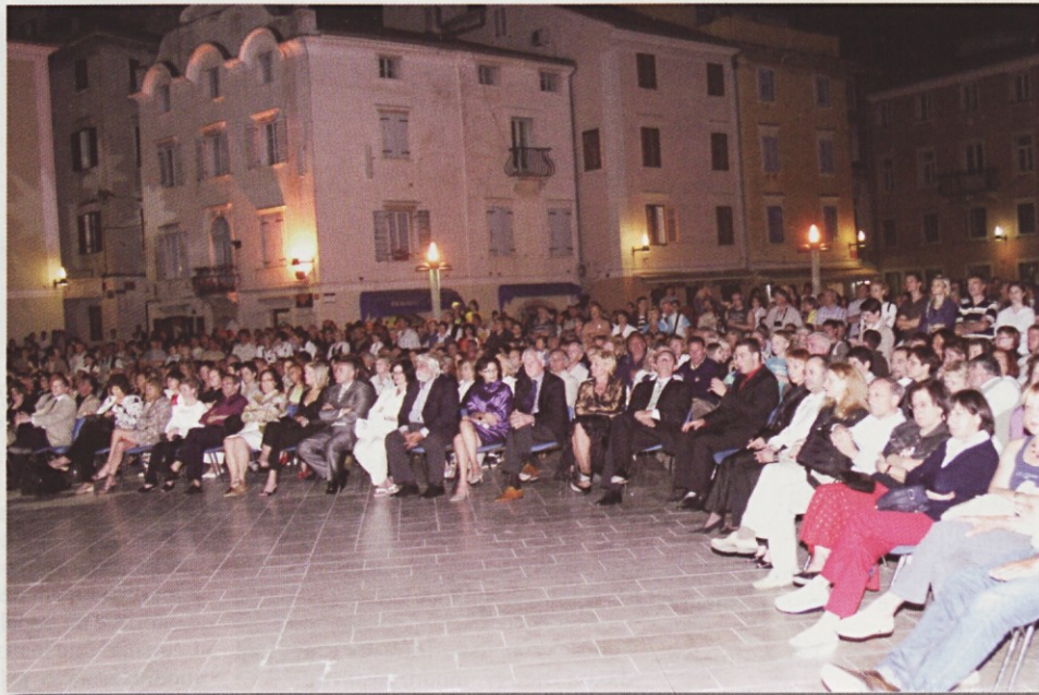
Svečanega odprtja prenovljenega trga se je udeležilo okoli 2000 ljudi.

Projekt prenove je pred 23. leti izdelal prof. Boris Podrecca. Del trga so prenovili že leta 1987, nato so leta 1992 sredi trga uredili elipso in otvoritev proslavili v okviru 300 - letnice rojstva znamenitega violinista Giuseppa Tartinija. Po burnih razpravah, v katere se je vključila tudi piranska civilna iniciativa, so leta 2007 pričeli s prenovo komunalne infrastrukture in tlakovanjem trga, dela pa so zaključili konec aprila 2008.