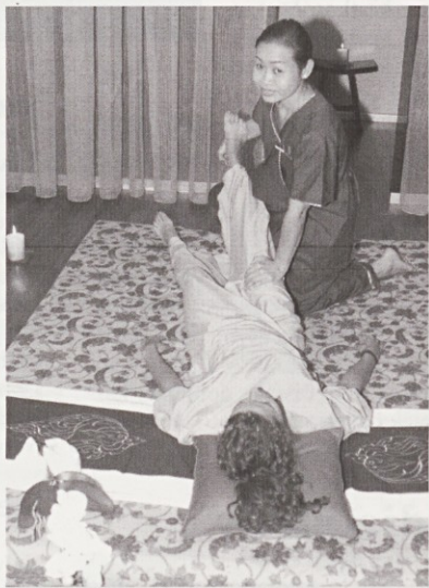
Tajska masaža in tajski pozdrav gostom.