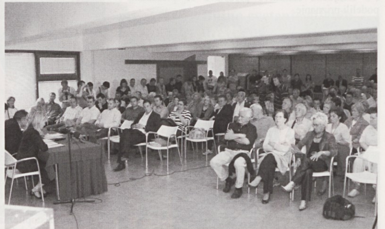
Zbor krajanov v Ankaranu. Sprva precej vroče, nato umiritev.

Dejali so, da je koprška občina krajevno skupnost Ankaran dolga leta zanemarjala, zato je kraj nezadržno propadal, namesto, da bi se s svojim potencialom razvijal. Priznajo, da jim