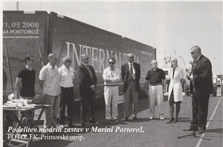
Podelitev modrih zastav v Marini Portorož.