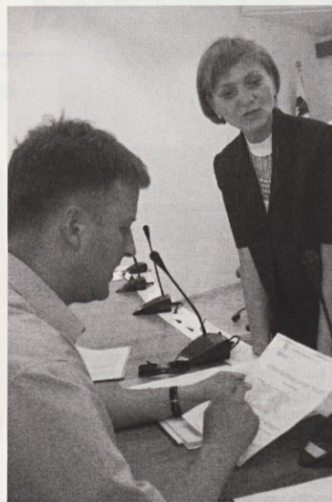
Direktorica občinske uprave in novi odvetnik Občine Izola.