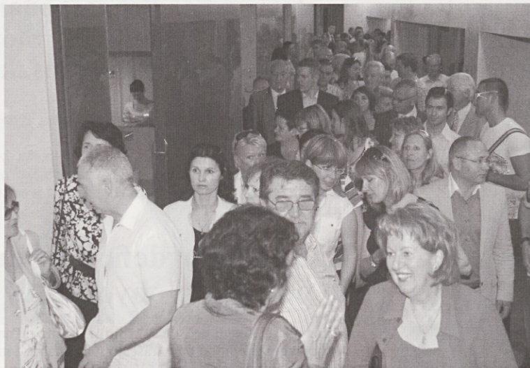
Otvoritve se je udeležilo okoli 300 povabljenih gostov.