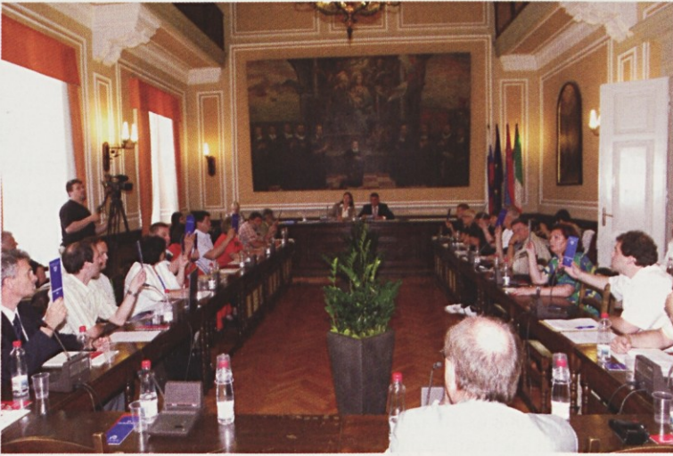
Občinski svet Piran je glasoval za prodajo.