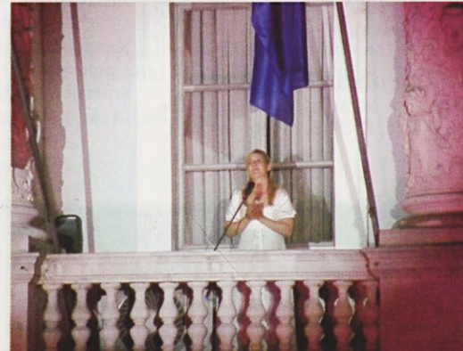
Odmevi arije z balkona občinske stavbe.