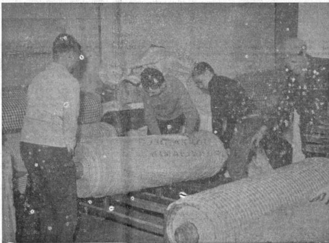
Ho-ruk... in težki zvitki blaga so že na svojem mestu

KOMUNALNA BANKA CELJE SPOROČA VSEM SVOJIM KOMITENTOM, DA V DNEH 3. IN 4. JANUARJA 1962 ZARADI ZAKLJUČNIH DEL NE BO POSLOVALA ZA STRANKE