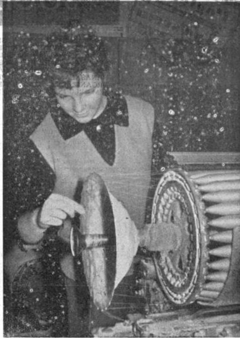
Kot da bi že dolgo delala na tem stroju

Po malici, ki so jo bili deležni tudi najmlajši »tekstilni delavci« tistega dne, pa se je začelo za res. Porazdelili so jih v manjše skupine in jih poslali na delo v obrate, pisarne in podobno. Tu zdaj ni bilo časa za odkevjanje, še manj pa za dolge razgovore.