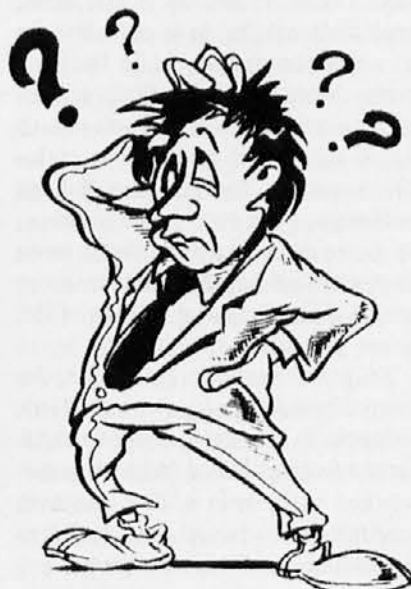
Koga sem volil!?!?

Katoliški glas izide še prihodnji četrtek, 11. avgusta. Zaradi poletnega dopusta ne bo izšel do 1. septembra.