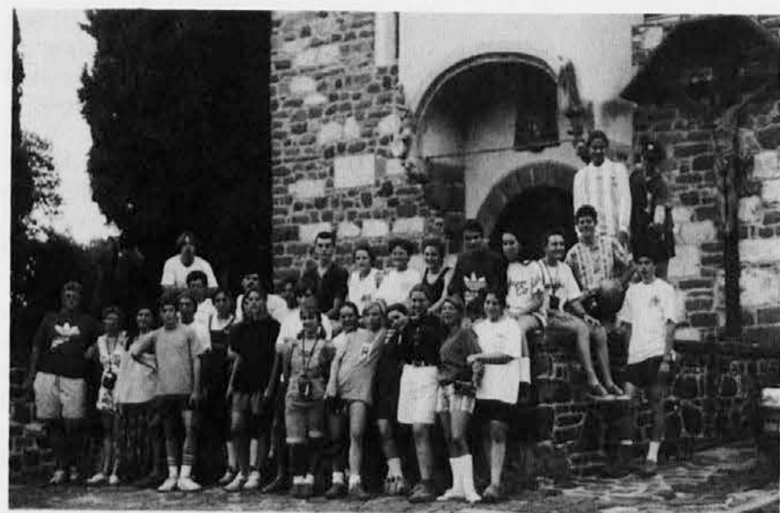
Maturantje iz Argentine pred cerkvico Sv. Duha na goriškem gradu

Zadnje dni meseca julija se je mudila na Primorskem tridesetčlanska skupina slovenskih maturantov iz Argentine, ki si je ogledala razne značilnosti naših krajev na Tržaškem, Goriškem in v videmski pokrajini. Želeli so si tudi na Sv. Višarje, kar jim pa ni uspelo, ker je žičnica prezgodaj zaprla.