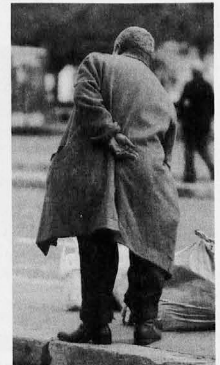
V poletnem času ne pozabimo na ostarele in osamljene!