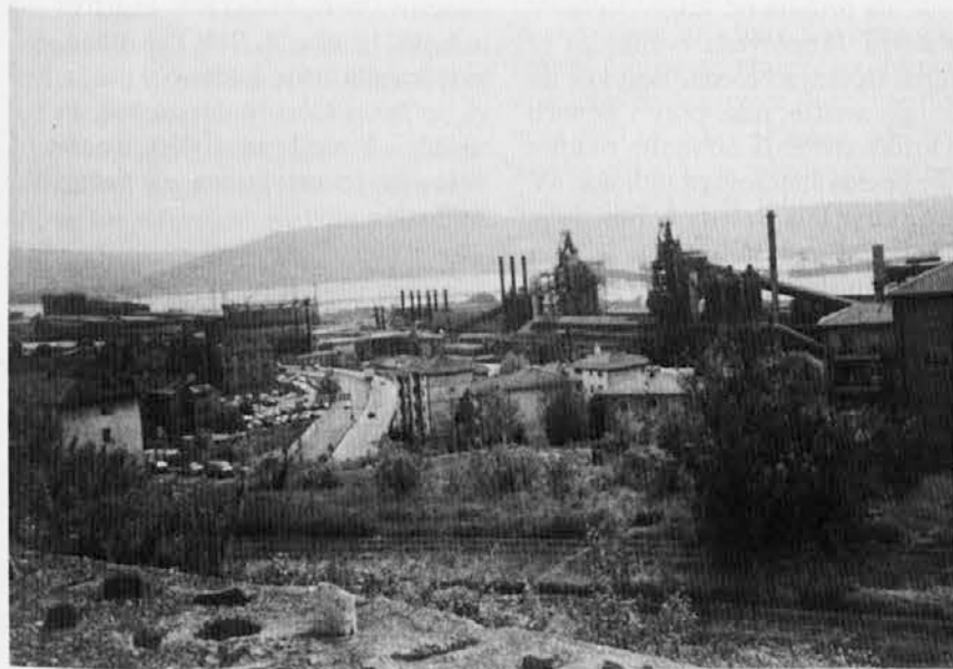
V trenutku, ko to številko tiskamo, ni še znano, katera bo usoda škedenjske železarne