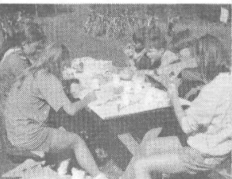
Ustvarjalne delavnice na stegu so spodbujale tudi likovno domiselnost