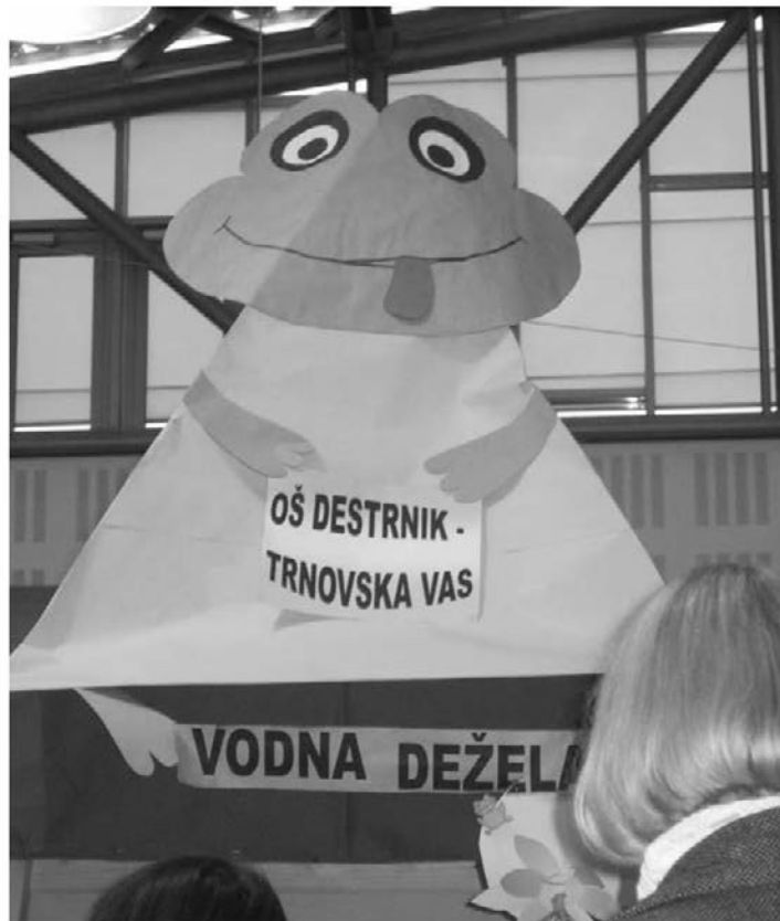
Maskota vodne dežele: Žaba Treza