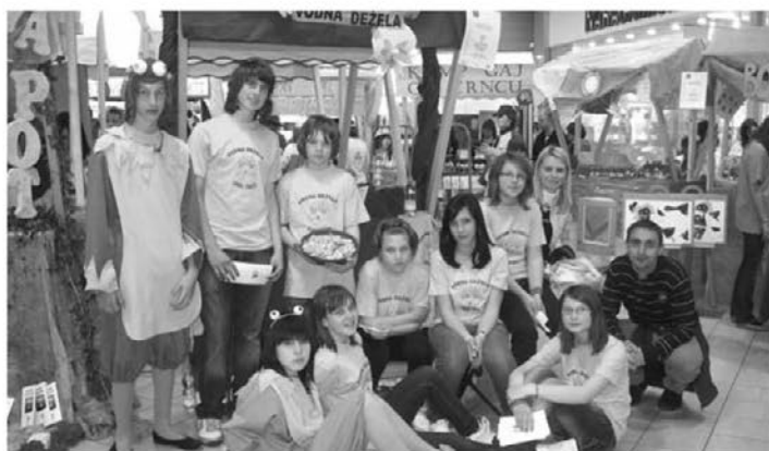
Najboljši v letu 2009 OŠ Destrnik-Trnovska vas.

Ob tem bi se radi zahvalili tudi vsem staršem, učiteljem, znancem in prijateljem, ki so si vzeli čas in nas prišli obiskat na Ptuj, ter tudi tako pripomogli k našemu velikemu uspehu.