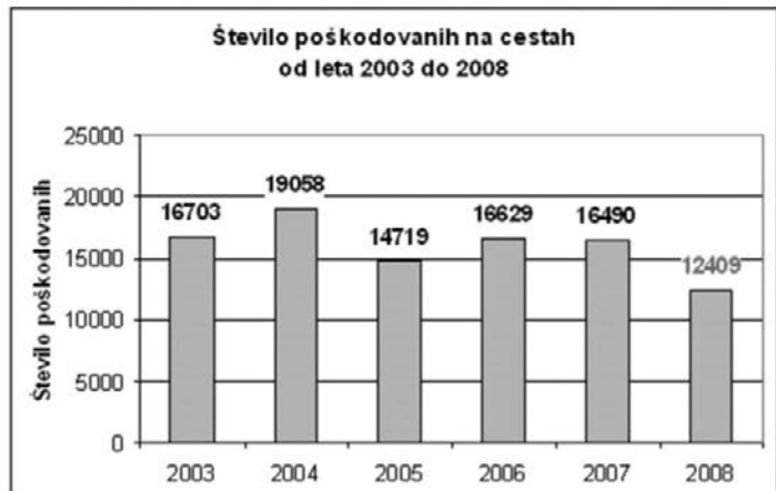
Graf 1: Število poškodovanih na cestah od leta 2003 do 2008