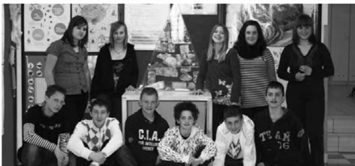
Otroci v jedilnici pri razdeljevanju hrane