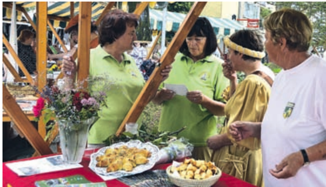
Na Cankarjevi je bilo zanimivo. Dobrote so hitro izginjale.

prepoznavno kot objezersko mesto. Soglašal je tudi s tem, da bi bilo v tem okolju dobro znova prebuditi prireditev Noč ob jezeru. Misja je tudi poudaril, kako velik prispevek k turistični ponudbi Slovenije predstavljajo turistična društva, in izrazil upanje, da bo »država« to čim prej spoznala in jih tudi bolj finančno podprla. V turističnih društvih bodo znali vsak evro dobro oplemeniti, dodaja. Sicer pa so v turistični zvezi zelo aktivni, v zadnjih dneh so se zvrstila še druga srečanja, med drugim turističnih društev objezerskih mest ter društev, ki so stara že več kot 110 let. Presenetljivo več kot 30 jih je. Na vseh srečanjih so govorili predvsem o tem, kako se izboljšati prepoznavnost posameznih slovenskih krajev, jih vključiti v skupno ponudbo Slovenije in jih povezati v enoten turistični produkt.