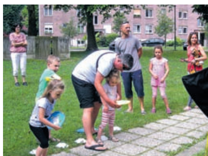
Ta veseli dan so tokrat športno obarvali. V okolici vile Mojca so v toplem sobotnem dopoldnevu pripravili pravo mini olimpijado.

Danes ob 17. uri vas MZPM Velenje, ki je pred kratkim uspešno zaključil letošnjo bralno značko, vabi na velenjsko promenado na priredi-