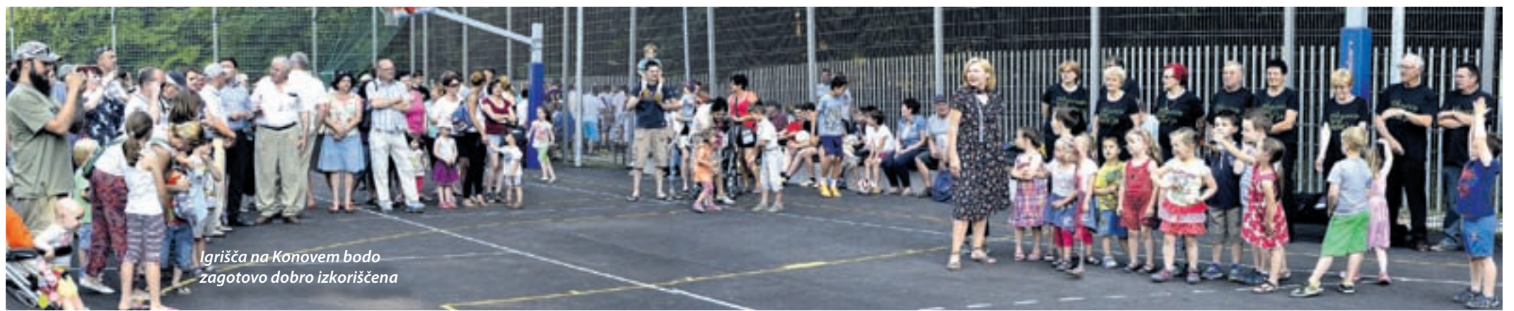
Igrišča na Konovem bodo zagotovo dobro izkoriščena