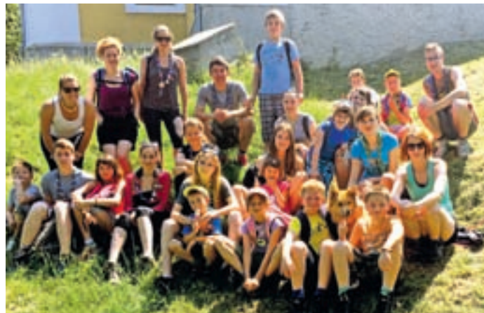
Bilo je naporno, a vsi smo bili navdušeni.

Izpred šole smo krenili proti najvišjemu vrhu v Šmartnem ob Paki. Kljub vročini in strmimi smo z nekaj postanki na vrh prišli vsi. Na Gori Oljki smo se pod krošnjami dreves okrepčali, se malo odpočili in si privoščili sladoled. Polni energije smo se preizkusili v lokostrelstvu. Izde-