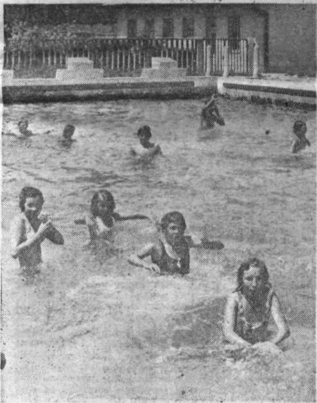
S plavalnega tečaja v bazenu Belinke, ki ga je priredilo šolsko športno društvo iz Dola.