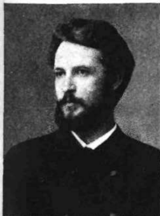
Rihard Jakopič 1880