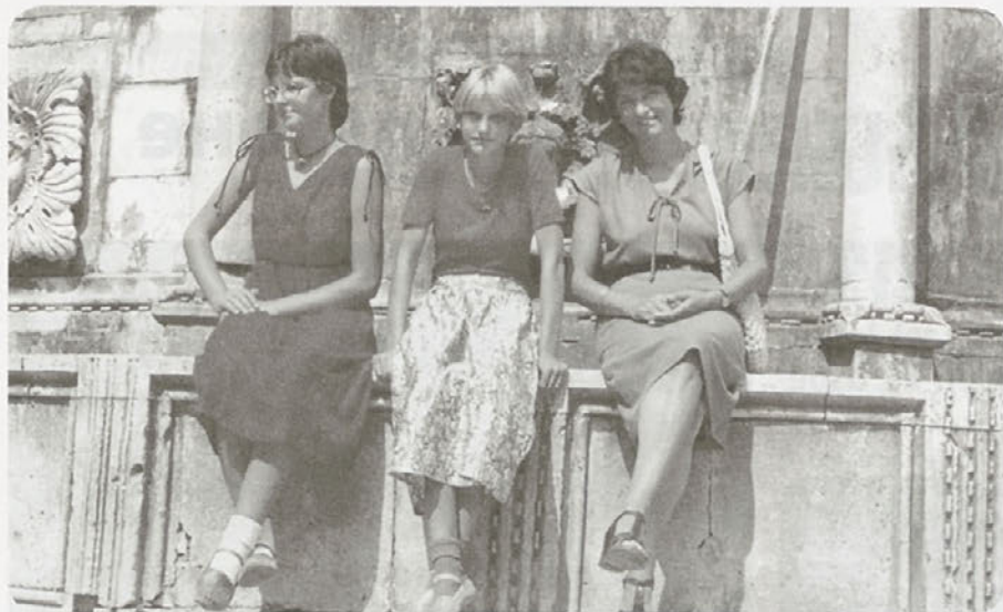
Dubrovnik s hčerkama v letu 1980

prva punčka, ki so mi jo po urah porodnih muk dali v roke. To je bila velika sreča, ki je ne bom pozabila nikoli.