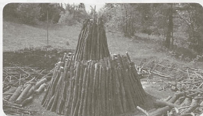
Sestavljanje kope (danes)

Okoli 13 km dolga pot je pohodnike vodila iz starta pri Lovskem domu do oglarskih vasi Suhadole in Slavina. Tu so oglarji oglarskih domačij Medved, Brinovec, Koletič, Medvešček in Odlazek postavili na ogled gorečo kopo in prikazali pripravo lesa za kopo nekdanj (pripravo drv ročno) in danes (strojno) ter zlaganje kope. V Reki so tesači spravljali les iz gozda s konji in tesali »švelerje« (železniške pragove), ki so jih najdlje delali prav v Oglarski deželi. Od tu pa je sledil spust do najnižje višinske točke pohoda, prečudovitega 8 m visokega slapa na reki Beni in takoj nato vzpon do najvišje višinske točke turistične kmetije Pr' Krjan. Tam oglarska pot počasi zaokroži po asfaltu proti cilju, na kateri pohodnike čaka še ogled Valvasorjevega lovskega dvorca na Zavrhu. Dvorec je iz 17. stoletja. Njegov gospodar je bil nekaj časa Janez Vajkard Valvasor, avtor Slave vojvodine Kranjske, ki je med leti 1672 in 1692 živel in ustvarjal na gradu