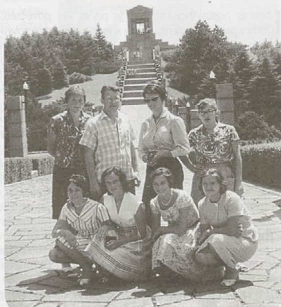
Maturantski Beograd 1961

Osnovna šola, nižja gimnazija, zdaj je to devetletka, nato ekonomska srednja šola, ki je na srečo odprla svoja vrata eno leto pred mojim vpisom. Po uspešno zaključeni ekonomski srednji šoli sem se vpisala na Ekonomsko fakulteto - smer bančništvo, ker sem imela štipendijo v Službi družbenega knjigovodstva. Po dveh letih sem zaključila prvo stopnjo študija in se pri štipenditorju zaposlila v kontroli. Po enaindvajsetih letih dela na različnih delovnih mestih sem delo dobila v Ljubljanski banki. Tam sem bila vodja oddelka za poslovanje z občani. Ker