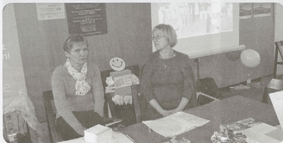
Sodelovalo je okoli 20 delodajlcev in 15 drugih ustanov