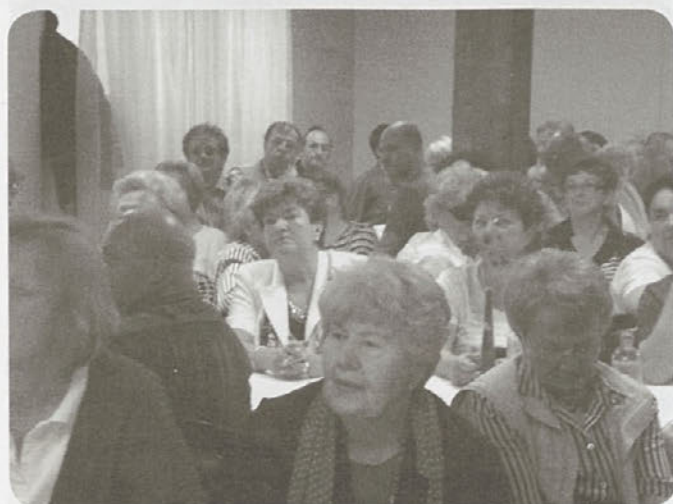
Člani so pozorno prisluhnili

Predsednica društva, ki so ji na srečanju rekli kar »mami dekanja«, je pohvalila delo članov in jim tako dala vzpodbudo za v prihodnje. V tem šolskem letu se je članstvo povečalo za več kot polovico. Ustanovili so, poleg že obstoječih, nekaj novih skupin, kjer so se učili italijanščine, digitalne fotografije, o vitalni energiji ... Imeli so zanimiva predavanja, med drugimi o demenci in negi bolnika na domu. Organizirali so plesno skupino, načrtujejo tudi druženja, kjer bodo dobile pomembno mesto družabne igre, ki pomagajo k dobremu pomenu.