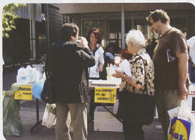
Ne bodi limona! Spij eno limonado!

V sredo, 25.5., ob 14.00, pa je bila v prostorih MC Zagorje okrogla miza z naslovom »Sistemske ureditve prostovoljskega dela na lokalni/regionalni ravni«.