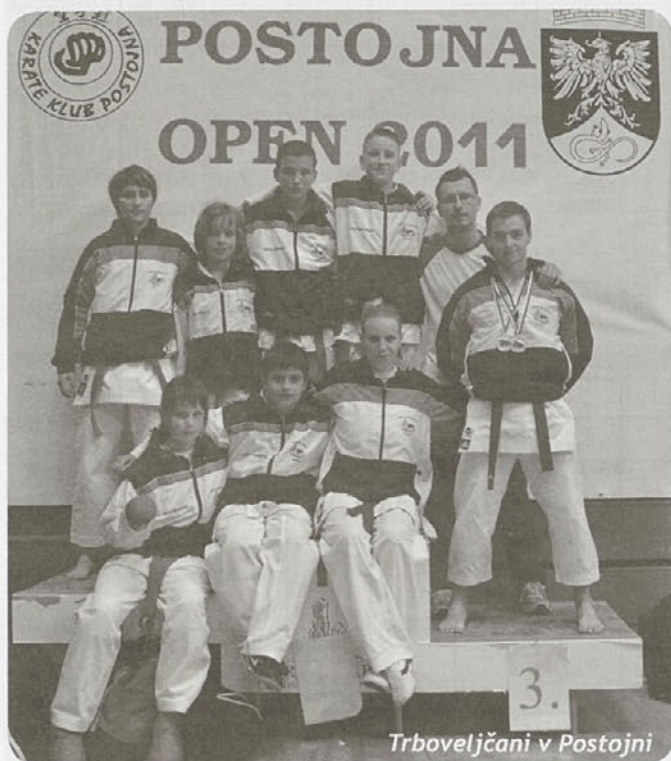
Trboveljčani v Postojni

V soboto, 14. maja 2011, je v športni dvorani Šolskega centra v Postojni potekal 10. Mednarodni karate turnir »POSTOJNA OPEN«. Naslednjo soboto, 21. maja, pa je v športni dvorani Milenij v Oplotnici potekal 6. Pokal Občine Oplotnica.