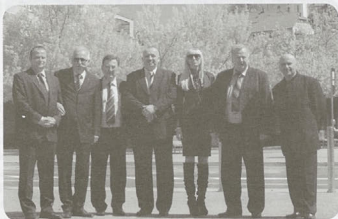
Delegacija iz Doboja v Zagorju - april 2011

ogledali park v Zagorju, ki nosi njegovo ime in kip pokojnega predsednika v njem ter položili venec na njegov grob na zagorskem pokopališču.