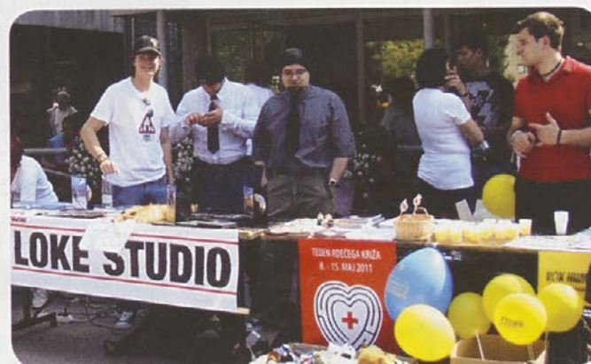
Nikoli ne manjkajo