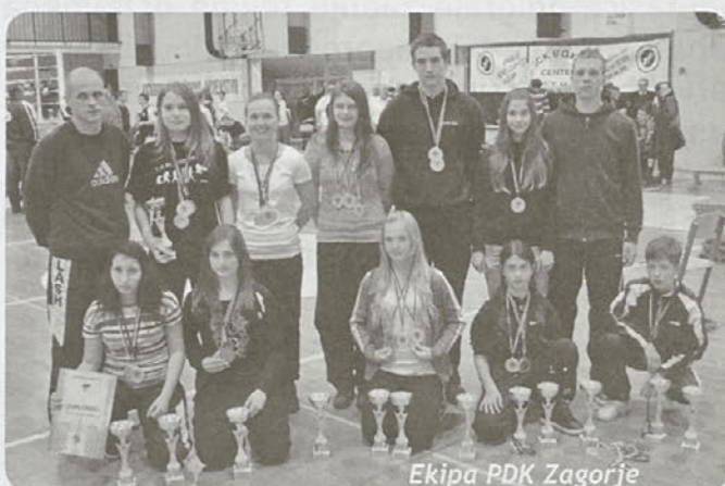
Ekipe PDK Zagorje

Besedilo: Primož Bračič