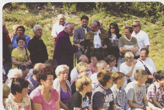
Pozdrav z veljaki zagorskimi