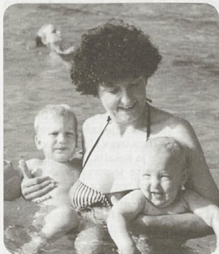
Leto 1995 v znamenju vnukov

Pri mojih letih je lahko vsakdanjik zelo enoličen, saj običajno obsega gospodinjska opravila in delo okrog