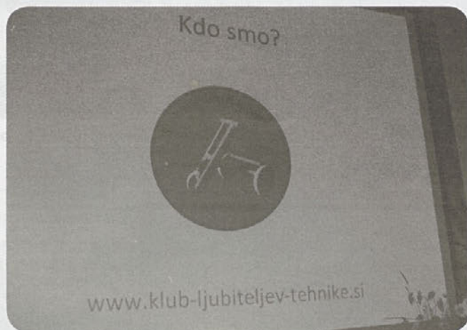
Spletna stran z driterjem, zaščitnim znakom Kluba