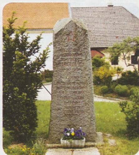
Spomenik padlim borcem Revirskega bataljona postavljen ob 12-letnici ustanovitve le-tega.

Če greste radi v Čeče na kosilo, cesti iz Hrastnika in Trbovelj sta solidni, a hrastniška je ožja, zato previdno, si le pogledajte ostanke iz preteklosti.