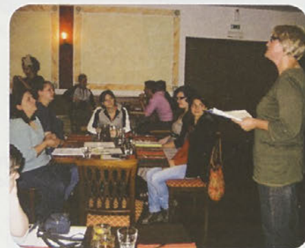
Na uvodnem srečanju

V soboto, 28. maja, se dobijo na stojnici Vse zastoj v okviru festivala Štafeta kulture. O sodelovanju v poletnih počitniških dneh se bodo še dogovorili. Jeseni, 22. septembra 2011, ob zaključku projekta, bodo skupno delo občinskih uslužbencev in prostovoljcev Mladinskega centra Litija tudi ocenili.