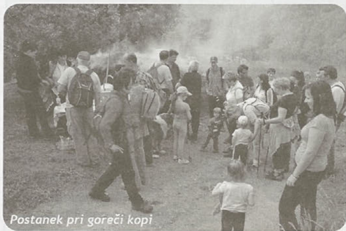
Postanek pri goreči kopi

Na cilju, po približno štirih urah hoje, so utrujene pohodnike čakale dobrote Društva podeželskih žena in deklet Dole pri Litiji. Lovski golaž za vse pohodnike pa so pripravili v lovskem domu.