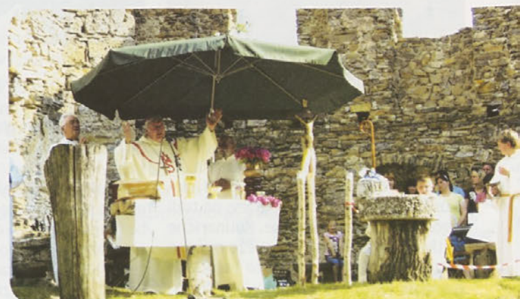
Sv. maša med zidovi gamberškega gradu