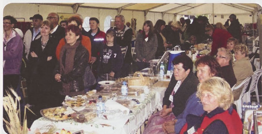
Obiskovalci prireditve ob stojnici Turističnega društva Trbovlje in Društva kmečkih žena in deklet Trbovlje.

žena in deklet Trbovlje, ki so zopet poskrbele za sladke dobrote. Prav tako pa je lepote naših krajev obiskovalcem predstavljalo Turistično društvo Trbovlje. Tržičani so z zanimanjem spremljali naš kulturni program ter občudovali naše običaje. Še posebej jih je navdušil »Skok čez kožo«, ki so ga v rudarskih uniformah prikazali člani moškega pevskega zbora Zarja in nas ob tem nasmejali. Tudi v nedeljo smo še enkrat potrdili to, da so Trbovlje mesto z bogatim kulturnim dogajanjem.