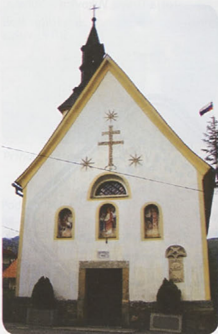
Pogled na vhod

Cerkev sv. Katarine v Čečah se prvič omenja leta 1545 v časih turških vpadov in »nove vere«. Pravijo, da je ostanek tega poznogotsko krogovičje (verjetno ostanek gornjega dela gotskega okna) vzidan na vhodni zunanji strani današnje cerkve. Zanimiv je tudi rimski nagrobnik, ki je vzidan pod njim. Izročilo, zapisano v župnijski kroniki, pravi, da so Čeče stara rimska naselbina. Cerkev stoji na kraju, kjer naj bi bil po legendi rimski žrtvenik. Druga zgodba pravi, da je na posestvu Gornjega Nemivška v Zgornjih Čečah stalo pogansko svetišče ali žrtvenik, zato se še danes ravnica imenuje Sveta ravna. Na tem mestu so hoteli zidati cerkvico, vendar lastnik zemljišča ni dovolil, zato ga je Bog kaznoval z nemostjo (od tod ime Nemivšek). Nekateri trdijo, da je bilo na kraju današnje cerkve rimsko pokopališče (Rimljani so vselej pokopavali ob prometnicah), zato so se ohranili trije nagrobniki (na cerkvi ter dva pri sosedih).