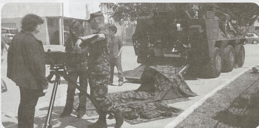
Slovenska vojska pred športno dvorano