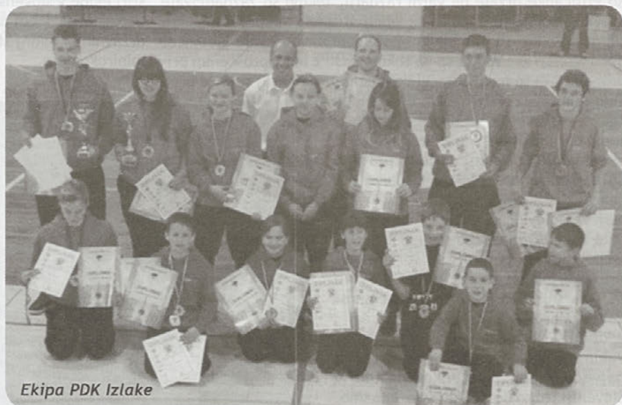
Ekipe PDK Izlake

Besedilo: PDK Izlake, Maruša