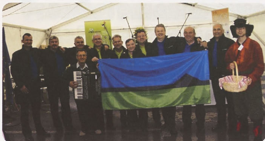
Moška vokalna zasedba Un' Trboul v družbi Perkmandeljca.