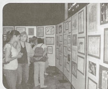
Risbice govorijo o njihovih malih avtorjih