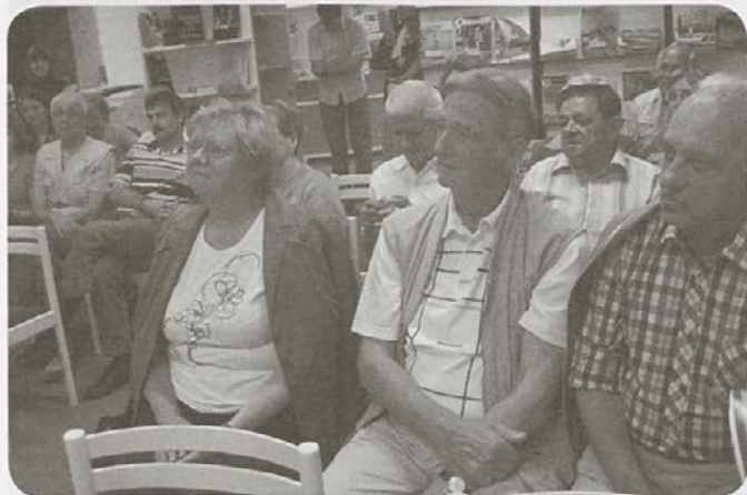
Obiskovalci in člani KLTT