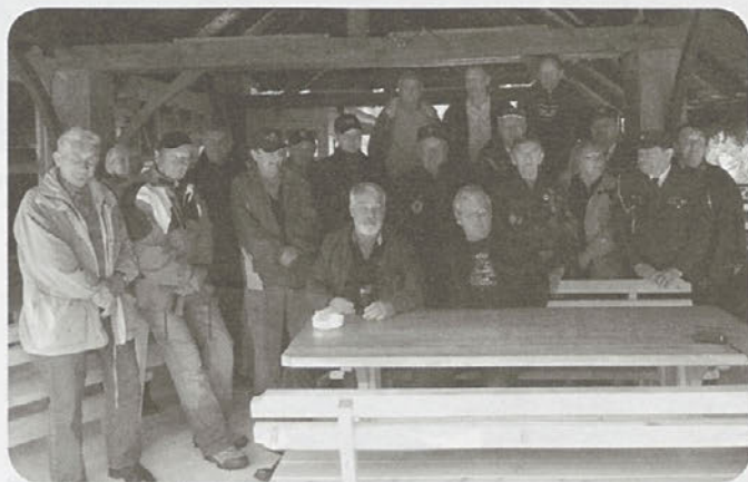
Udeleženci proslave ob Dnevu SV iz Zasavja