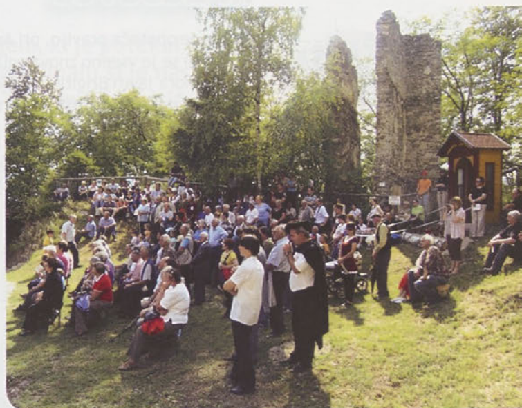
'Tlačani' v pričakovanju - v ozadju ostanke stare kapele in nova začasna kapelica

Na gradu Gamberku grof je živel, prelepo grofico za ženo imel, sinov mu je dala, tudi hčerko je imel, po lepoti te hčerke Čemšenik je slovel.