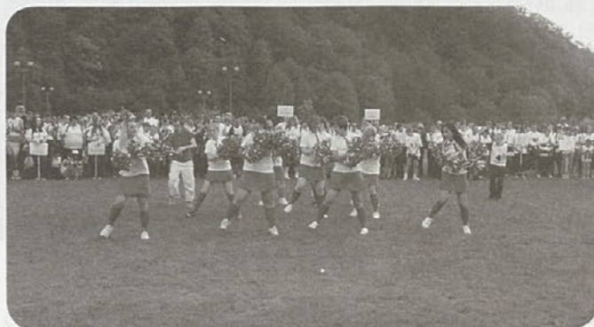
Nastop VDC navijačic na stadionu v Hrastniku

Ob odhodu so se poslovili, si izmenjali vtise, mnenja in si oddahnili. Vreme je bilo udeležencem naklonjeno, kljub slabi napovedi in petku, trinajstem. Gotovo je njihov zanos pripomogel, da je vse teklo gladko.