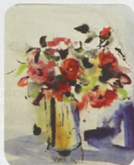
Od različnega akvarela... ..do abstrakcije