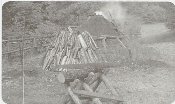
Sestavljanje kope (nekoč)

Ob poti so pohodnikom oglarji, društva in domačini Dol pripravili zanimivo zgodbo o lesu, ki kroji vsakodnevno življenje, iz leta v leto manjšemu številu ljudi v Oglarski deželi.