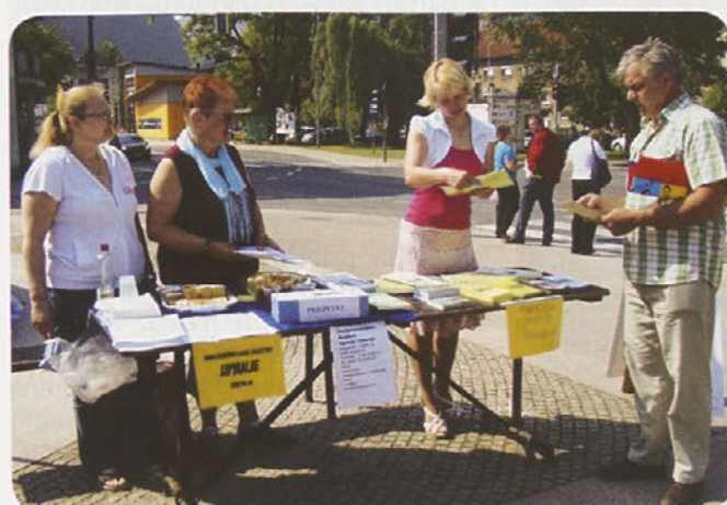
Medgeneracijsko društvo Upanje iz Trbovelj in TD Čemšenik