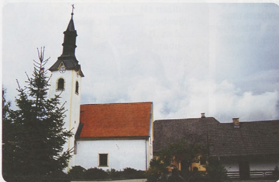
Cerkev sv. Katarine v Čečah

Zelo prijazna vasica, ki so ji pred vojno po farni zavetnici pravili Sv. Katarina nad Trbovljami , zdaj pa Čeče , se lahko pohvali s prijazno cerkvico, ki vsako leto ob Rokovem (16. avgusta) privabi lepo število častilcev tega priprošnjika zoper kužne bolezni in v druge življenjske stiske.