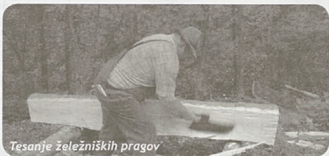
Tesanje železniških pragov