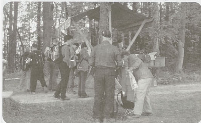
Start pohoda Po oglarski poti

Eno najlepših krajevnih skupnosti v litijski občini, KS Dole pri Litiji, je 14. maja obiskalo rekordno število pohodnikov, željnih lepe, neokrnjene narave in vonja po dimu iz oglarskih kop.