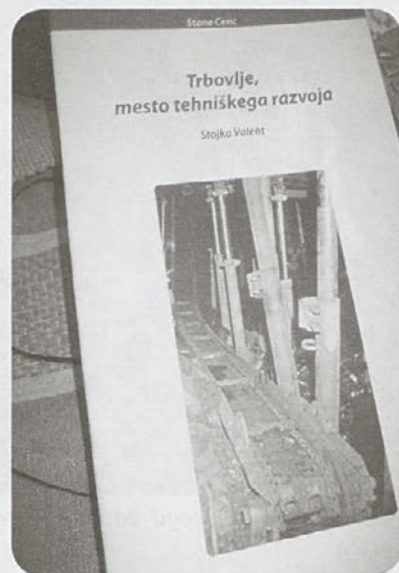
Brošuri o jamski stojki bodo sledile še druge