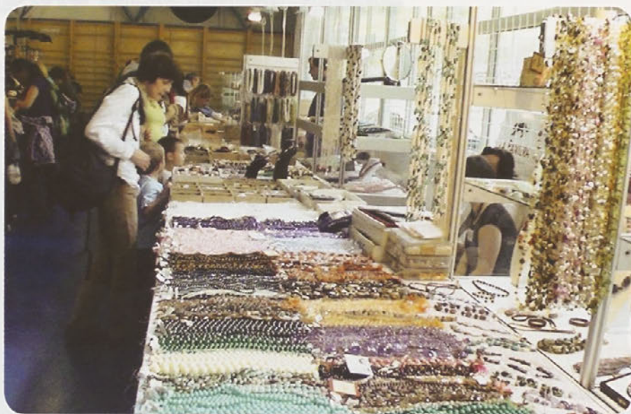
Stojnice polne dragih, poldragih kamnov, mineralov in fosilov.