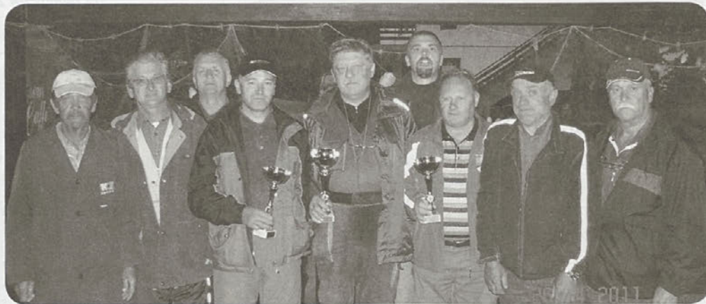
Člani ribiške sekcije Društva invalidov Zagorje