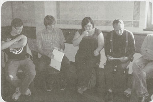
Udeleženci okrogle mize

Tokrat so predstavili problematiko, ki jo mladi v Litiji smatrajo za pomembno v lokalnem okolju in se dotaknili aktivne participacije mladih ter možnosti sodelovanja pri procesih lokalnega soodločanja. Predstavnike občine Litija so opozorili na pomanjkljivost občinskega razpisa za izvajanje projektov za mlade, ki omogoča pridobitev sredstev le 10 izvajalcem, ki so prijavi projekta ali akcije, za samo delovanje društev pa ta niso namenjena. Okroglo mizo so zaključili s sklepom, da bo Mladinski svet občine Litija kot krovna organizacija poskrbel za lažjo in učinkovitejšo komunikacijo z občino in županom.