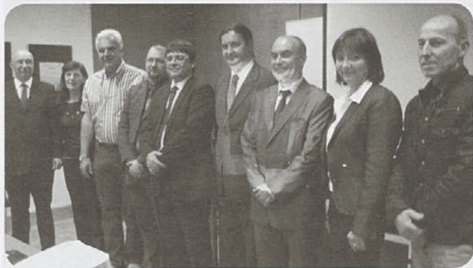
Partnerji pred podpisom pogodbe

Vtorek, 10. maja 2011, so se v prostorih RCR v Hrastniku zbrali partnerji, da predstavijo svoj projekt in ga slovesno podpišejo.