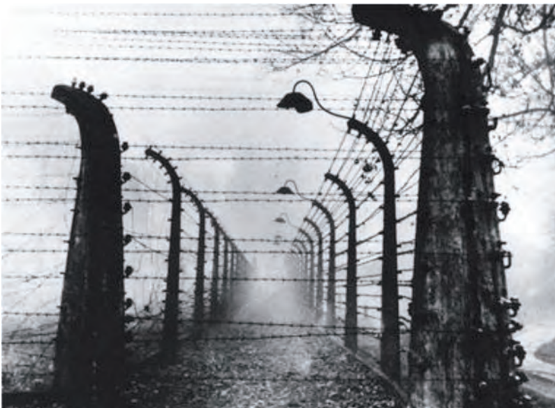
Nemško taborišče, kjer so nacisti izvajali genocid Judov.

Zaradi grozovitih hudodelstev v drugi svetovni vojni je imela evtanazija še dolgo negativni prizvok. Ostala je prepovedana tema. K temu je v veliki meri pripomogla