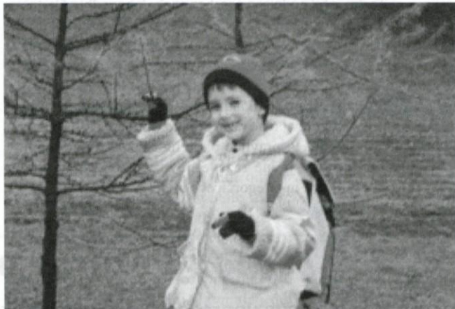
Veselo nad smeti in odpadke.