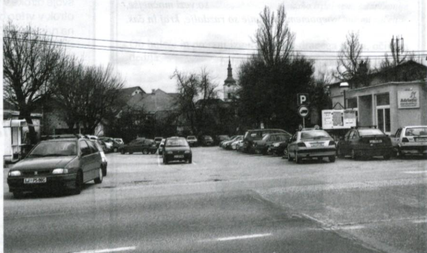
Besedilo in foto: F. Brus

Po drugi strani prihaja do preplavljanja parkirišč tudi zaradi odpiranja novih gostinskih in trgovskih lokalov sredi naselja, koder za nove parkirne površine zmanjkuje prostora. Veliki izjemi sta trgovski podjetji Mercator in TUŠ, ki sta poskrbela za dovolj parkirišč.