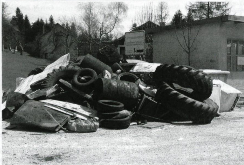
Zgovoren kup odpadkov

V zadovoljsvo vseh je akcija TKŠD Grčarevec lepo uspela. Vendar: Zemlja naj bi bila čista vse dni v letu in ne le ob dnevu Zemlje.