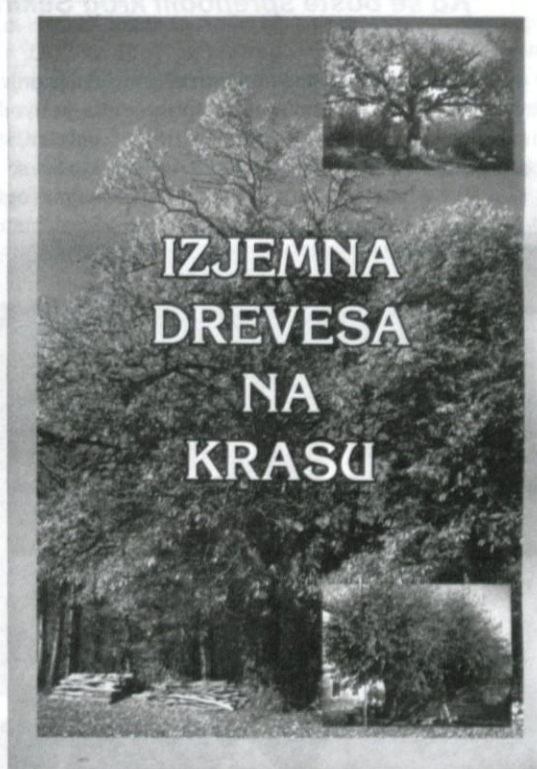
Vredno si je ogledati kako izjemno drevo na Krasu.