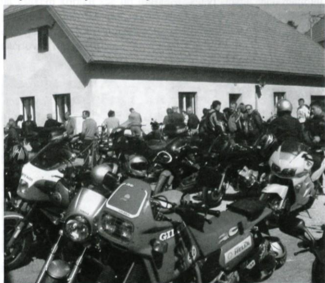
Motoristvo k blagoslovu nič koliko.

Na 1. maja dan je kaka stotina motoristov prijezdila na svojih bleščočih jeklenih konjičkih – raznoterih znamk in tipov –