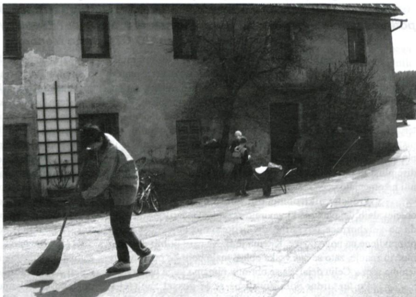
To pot so se izkazali mladi.

Kljub nezavidljivi udeležbi menimo, da smo bili dovolj učinkoviti; vas je naslednji dan le kazala malo lepšo podobo