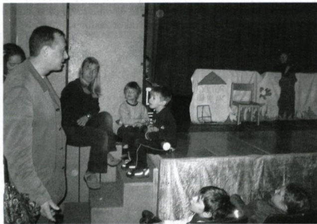
Lutkarje je obiskal župan Loške doline.

Za logaškimi, ki so nastopili prvi, so se predstavile lutke iz Zagorja ob Savi s predstavo Bratje, škratje , tat je, iz Trbovelj z igrico Čira-čara muc, iz Horjula z Mavrično ribico in iz Ivančne Gorice (s Kopanja) s Snežaki korenjaki. Vse predstave so bile odlično odigrane. Z zanimivimi lutkami, scenografijo, glasbo, takimi in drugačnimi zgodbicami, v katerih pa so z izjemo Bratje, škratje , tat je (tu so bili glavni junaki gozdni škratje) prevladovali živali, ki so jih občudovali otroci iz bližjih vrtcev in nižjih razredov osnovnih šol, jim navdušeno in občudujoče ploskali. Tako »živo« je bilo dogajanje na odru.