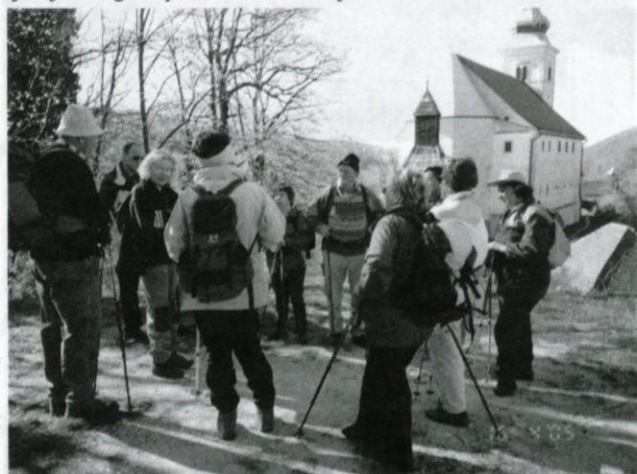
Na svetih gorah.