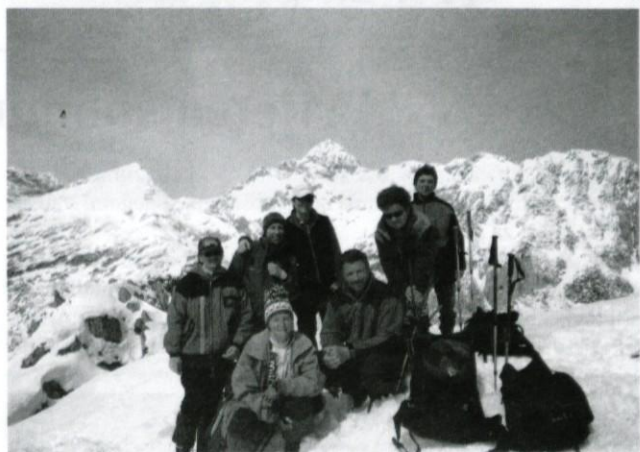
Sredi zasneženih vrhov.

Viševnik zelo radi obiskujejo planinci poleti in pozimi, saj je dostop razmeroma enostaven. Markirana pot je lepo speljana po severozahodni strani, vendar je lažji pristop z Rudnega polja. Najprimernejši čas za pohod je zima in zgodnja pomlad, ko je pot prekrita s snegom; v kopnem je pot manj prijetna, ker je mestoma prerasla z rušjem.