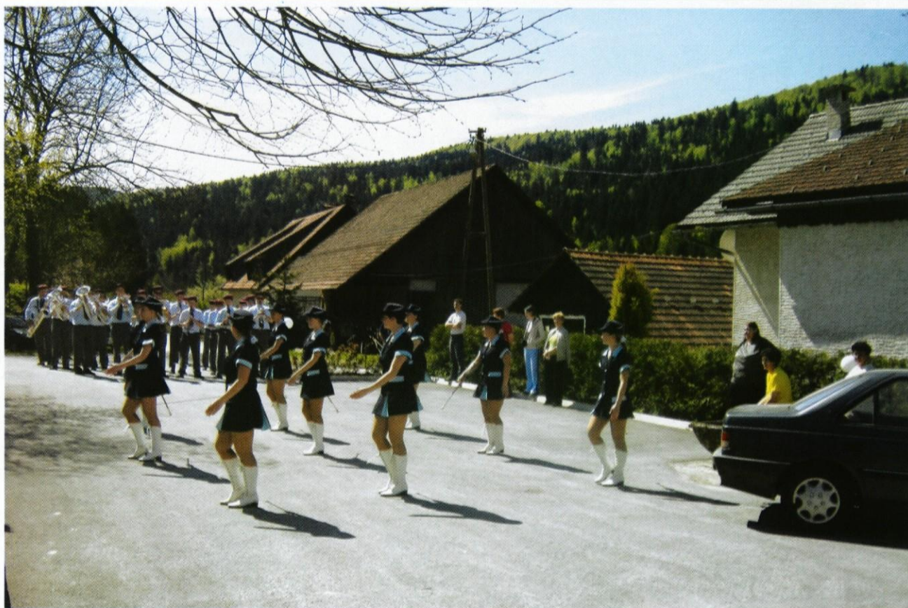
Ob letošnjem prvem maju so Grčarevčane obiskali logaški godbeniki z mažoretami.