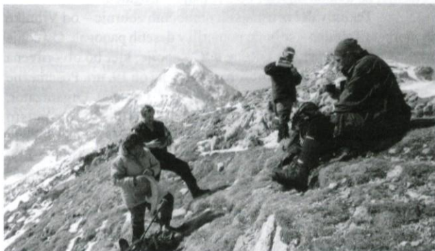
Prigrizek na Kalški gori.

Zgodaj zjutraj se je 3. aprila 5 logaških planincev namenilo na Kalško goro. Jutro je naredilo lep dan, ko so se planinci peljali mimo Kamniške Bistrice do gozdne poti Žagana Peč. Z zimsko opremo so se planinci podali po nemarkirani lovski poti v hrib.