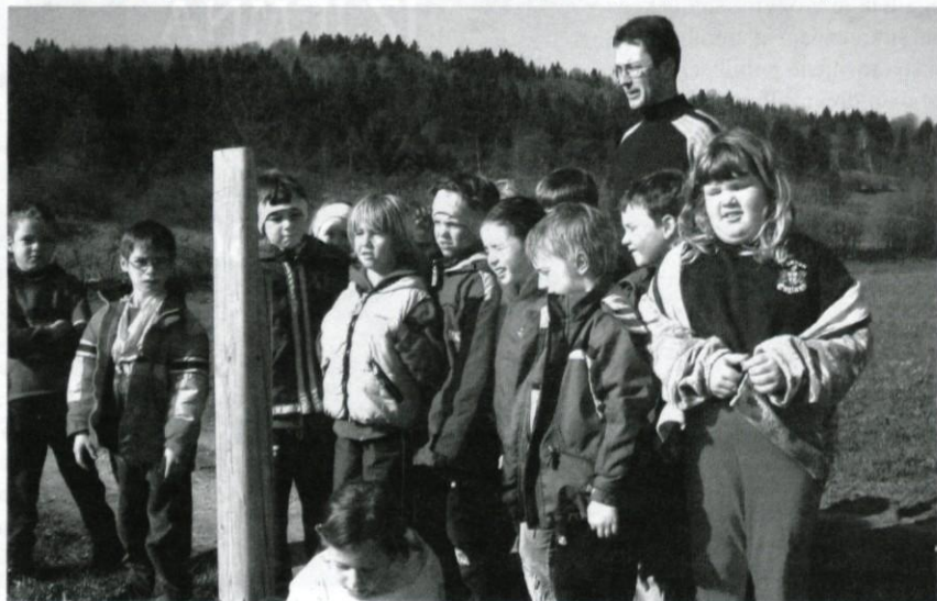
Učenci so prvi prešli novo sprehajalno pot.