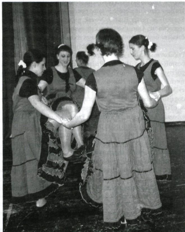
V ritmu živopisnega kan-kana.

Po letu dni so se v organizaciji Območne izpostave JSKD Logatec na odru Narodnega doma ponovno zavrteli fantje in dekleta na 3. območnem srečanju otroških plesnih skupin. Njihove nastope je spretno povezovala Renata Gutnik. Tokrat so se predstavile tri osmošolke, s plesom »začarane« sošolke, ki so se poimenovala Pike poke, mlajši plesalci, učenci OŠ »8 talcev«, ki so zaplesali v skupinah »Delfinčki« in »Sezuti čevelj« ter tri mažoretne skupine v različicah – s palicami, s trakovi in s kan-kanom. Vsega torej šest skupin.