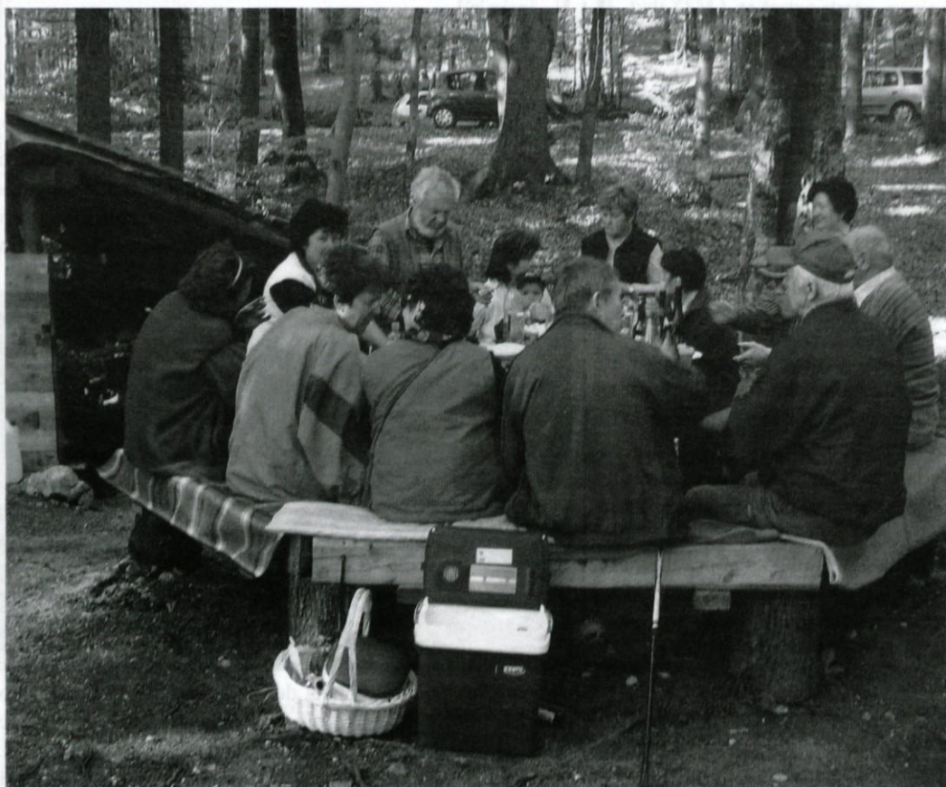
Prvomajska družabnost pod Tolstim vrhom.

Že več desetletij se osmero (sprva celo devetero) logaških družinskih parov srečuje za prvi maj v Tolstem vrhu pri »Suhi štirni«; v prijetnem okolju erkerjevine se zbero na prijazni družabnosti najprej sami, nato z družinami.