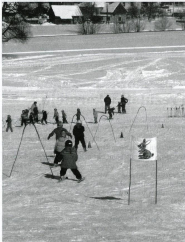
Pa je šlo po snegu.

Od oktobra do februarja so nekateri otroci obiskovali smučarsko pripravljalnico v vrtcu in poskrbeli za kondicijsko pripravljenost. Tudi v vrtcu Kurirček smo v prvem tednu marca izkoristili ugodne snežne razmere in izvedli tečaj za pet- do šestletnike.