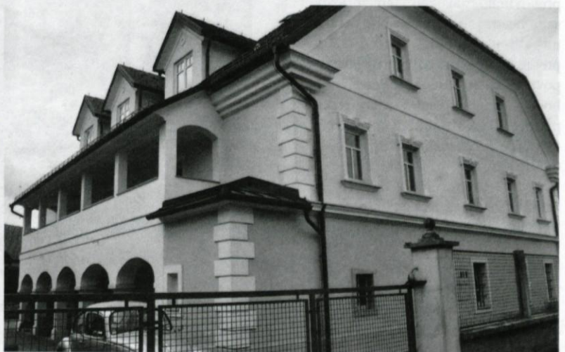
Prenovljena Jelenčevo lepota - z zadnje, dvoriščne strani.