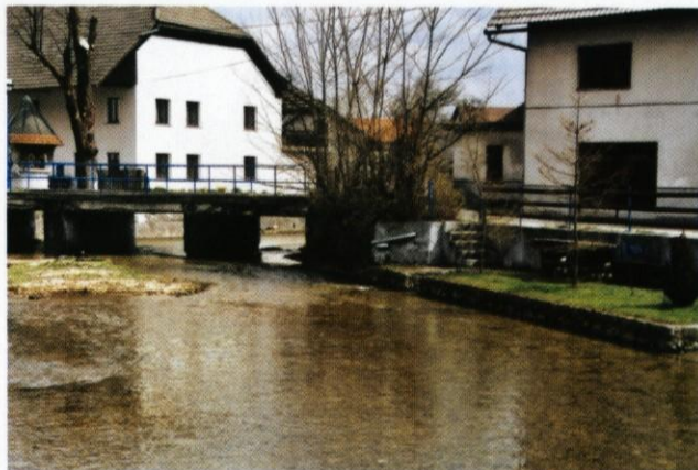
Nekdanje perišče na Brodu.

Mimoidočemu obiskovalcu se voda na prvi pogled zdi še danes dokaj čista. Vprašanje je le, kaj bi porekle številne odpadke, ki se kljub urejeni kanalizaciji in čistilni napravi pridno stekajo v potok.