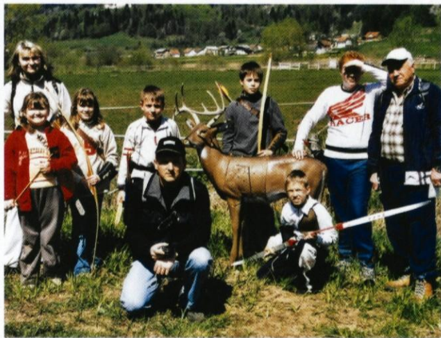
David (drugi z desne) ni prehitel le prvega.

Tudi v Logatecu je vedno več mladih in starejših, ki se zanimajo za lokostrelstvo; vključeni so v lokostrelski klub MINS Postojna in vadijo s postojnskim trenerjem na zemljišču prejšnje vojašnice za Košem.