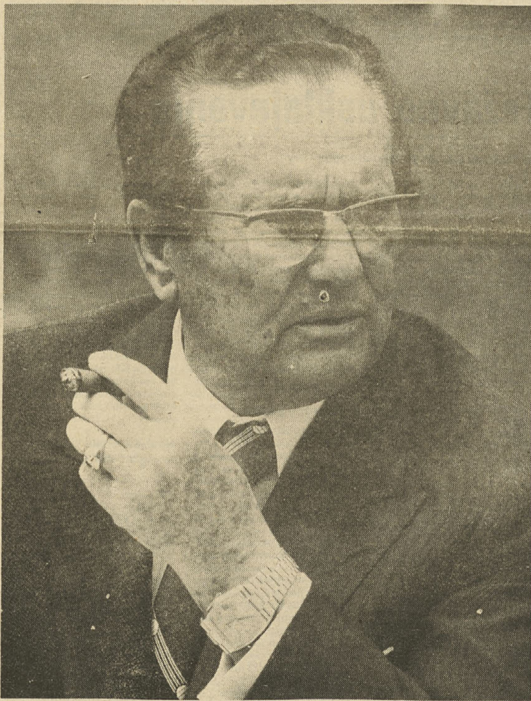
Maj, čas, ko se pomlad požene v svoj vrh, mesec, ki nam je simbol mladosti. Sredi sonca in zelenja se nam spomin vrača k Njemu, čigar življenje in delo sta neločljivo povezana z mladostjo in vzponom nove Jugoslavije. Tudi zdaj, ko ga že tri leta ni več med nami, je njegova misel tu, živa in resnična, trdna in usmerjajoča, kot misli velikih ljudi, ki jih preživijo še stoletja.

ško in strokovno izobraženi in pedagoško-metodično sposobni in koliko prej bodo opustili zastarela pojmovanja o šolski izobrazbi otrok in mladine. To pomeni, da moramo v prihodnje posvetiti posebno pozornost šolam, v katerih se pripravljajo učiteljski kader, hkrati pa moramo poskrbeti za neprenehno izpopolnjevanje učiteljev med njihovo prakso... Iz pisma oktobra 1958