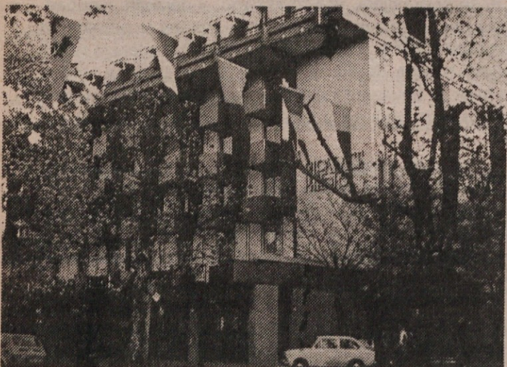
PH-PALACE HOTEL, Corso Italia 63

34 170 Gorizia-Gorica, Italy; Tel.: 0481-82166; Telex 461154 PAL GO I